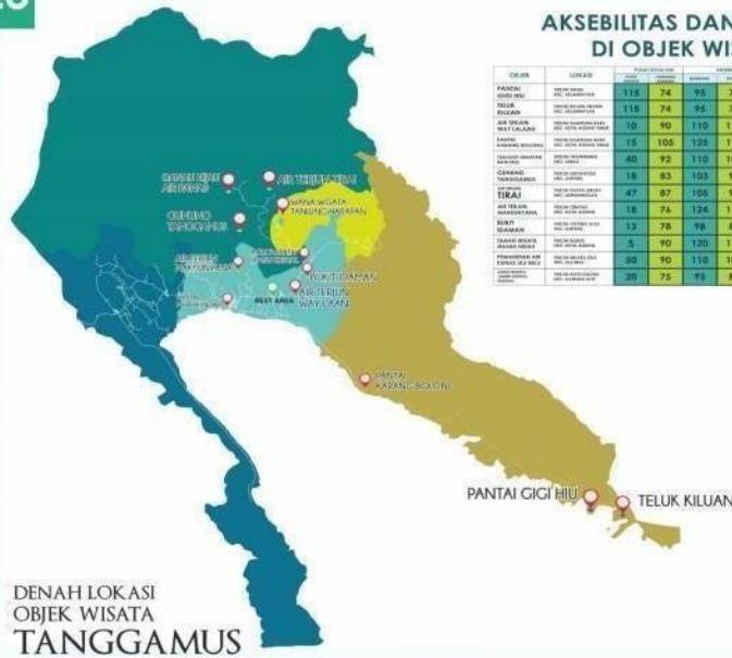
DENAH LOKASI OBJEK WISATA TANGGAMUS