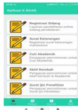
Gambar 5. Tampilan Menu Utama Aplikasi

Berikut ini merupakan tampilan utama pada tombol menu dashboard pada aplikasi E-BAAK yang dapat dilihat pada gambar 5 dibawah ini: