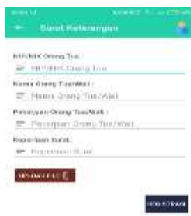
Gambar 7. Tampilan Menu Surat Keterangan

Pada halaman ini berisikan tombol menu surat keterangan guna untuk kebutuhan mahasiswa IIB Darmajaya dan mengirimkan kepada baak kemudian baak akan menerima permohonan mahasiswa dan mengurusnya. Berikut ini adalah merupakan tampilan pada menu surat keterangan yang dapat dilihat pada gambar 7 dibawah ini: