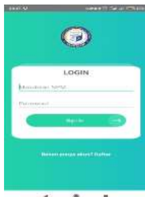
Gambar 3. Tampilan Halaman Menu Login

Berikut ini merupakan tampilan dari menu login yang dapat dilihat pada gambar 3 dibawah ini :