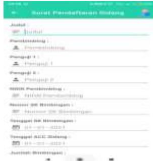
Gambar 6. Tampilan Menu Registrasi Sidang

merupakan tampilan pada menu setoran yang dapat dilihat pada gambar 6 dibawah ini: