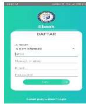
Gambar 4. Tampilan Halaman Menu Register

Berikut ini merupakan tampilan dari menu register yang dapat dilihat pada gambar 4 dibawah ini: