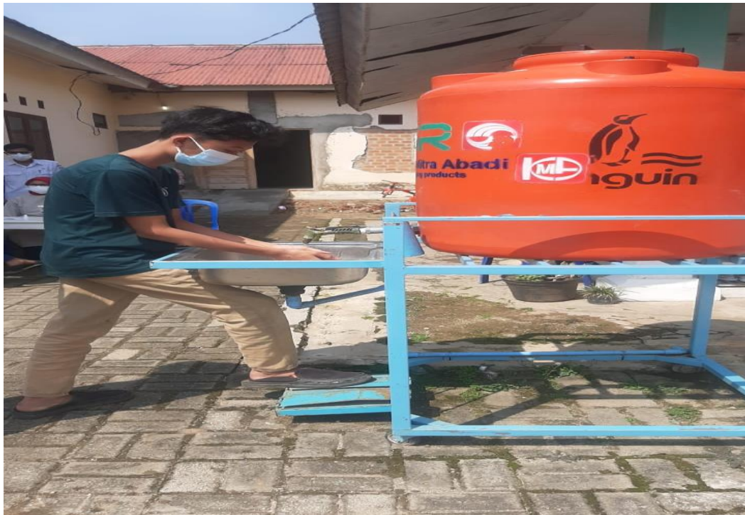
Gambar 2.3.3 Mencuci tangan

Saat pandemi Covid-19, semua orang harus bisa menjaga kesehatannya. Salah satunya dengan menerapkan protokol kesehatan. Hal ini juga berlaku bagi semua masyarakat baik yang muda dewasa ataupun lansia.. Sebagai upaya pencegahan penyebaran virus, maka setiap masyarakat harus menjaga kebersihan tubuh. Virus ini menular dengan berbagai cara seperti menular melalui udara, cairan, interaksi dengan orang terpapar virus, dan sebagainya. Sangat tidak memungkinkan untuk masyarakat terutama orang tua dan anak-anak yg rentan terkena penyakit untuk melakukan aktivitas secara normal tanpa menerapkan protokol kesehatan untuk melanjutkan proses aktivitas di masa pandemi ini. Oleh karena itu kelurahan dan saya melakukan sosialisasi tentang Covid-19 di Desa Banjar Negeri mengenai Pentingnya Menjalankan Protokol Kesehatan Untuk Melanjutkan Aktivitas Selama New Normal .