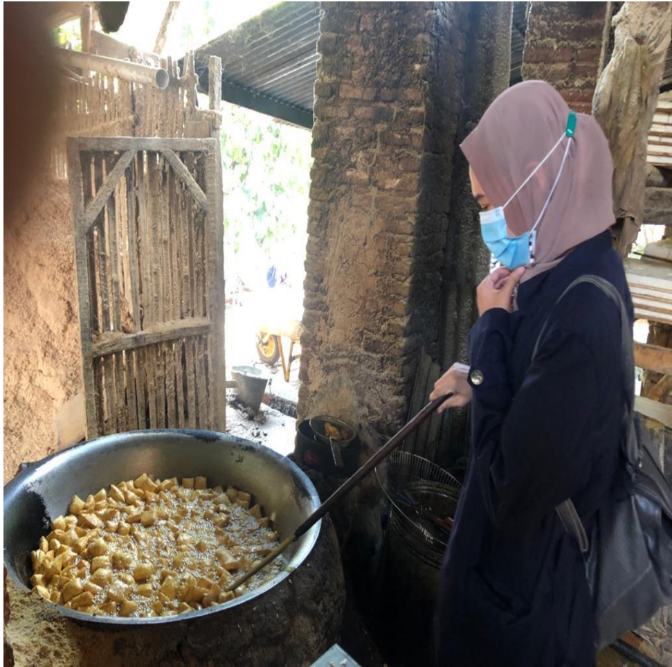
Gambar 2.3.3 Pembuatan Tahu