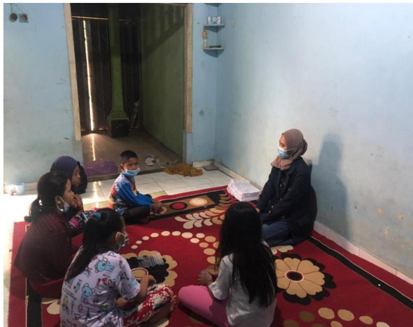
Gambar 2.3.5 himbauan terhadap anak-anak

Dan disini saya memberikan sebuah simbauan ataupun informasi kepada anak-anak pentingnya belajar online dan bahayanya virus corona saat ini.Memberikan informasi kepada anak tentang virus Corona tidaklah mudah. Cara menerangkan yang kurang tepat bisa membuat anak tidak memahami bahaya virus Corona atau justru merasa takut. Oleh karena itu, orang tua lah peran yang paling penting untuk menghimbau anak-anaknya tentang bahayanya virus corona-19.