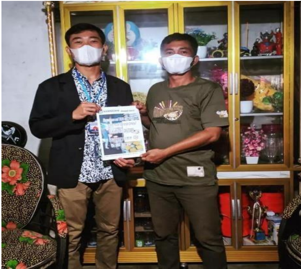
Gambar 2.2 Mencari Mitra Produk Di Warung dan Promosi Ampas Tahu Ke Rumah Warga