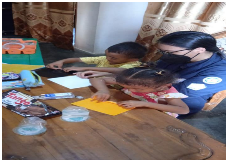
Gambar 2.3.10 Kreatifitas membuat kipas dari kertas origami

Tujuan diadakan kegiatan ini adalah sebagai bentuk kreatifitas mereka dalam mengekspresikan diri mereka dalam membuat suatu hal. Dari kegiatan ini, mereka sangat berantusias membuat kreatifitas ini.