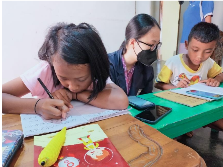
Gambar 2.3.9 Kegiatan pendampingan anak sekolah online

Di masa pandemi ini, anak-anak sekolah online mengalami kesulitan dalam mengerjakan tugas mereka. Kurangnya penjelasan dari guru secara langsung membuat para anak-anak sulit memahami pembelajaran dari sekolah online ini. Ditambah lagi orang tua mereka yang mengajari anak-anaknya setelah mereka bekerja untuk mencukupi kebutuhan sekolah mereka.