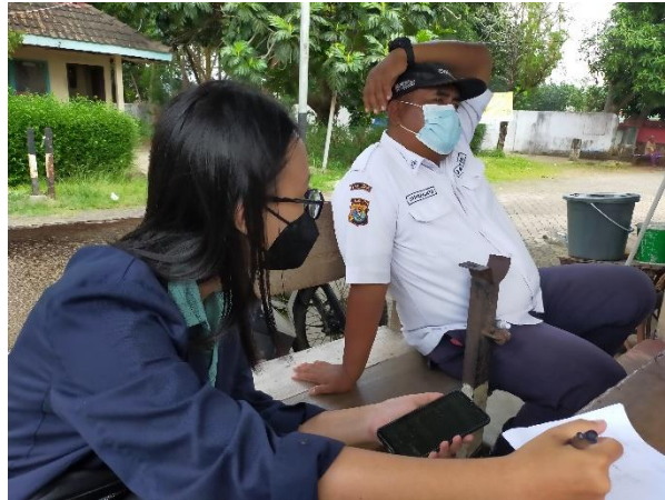
Gambar 2.3.8 Pencatatan Jumlah Penduduk Desa Kedamaian