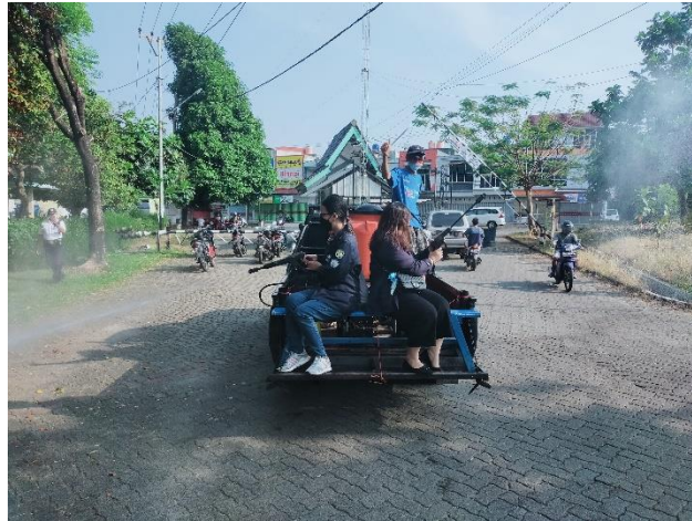
Gambar 2.3.6 Penyemprotan disinfectan

Tujuan penyemprotan disinfectan merupakan langkah pencegahan meluasnya virus corona serta meningkatkan kebersihan untuk pencegahan penyebaran COVID-19 di daerah Kedamaian.