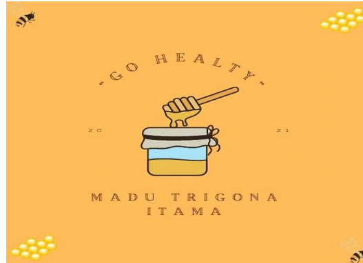
Gambar 2.3.3 Membuat Logo untuk pengemasan produk

Logo merupakan salah satu bentuk proses branding dan strategi marketing. Dimana logo menjadi bentuk penggambaran maupun identitas suatu usaha, sehingga logo tersebut menjadi citra dari usaha. Ini adalah alasan saya ingin membuat logo agar menarik perhatian produk lebih menarik.