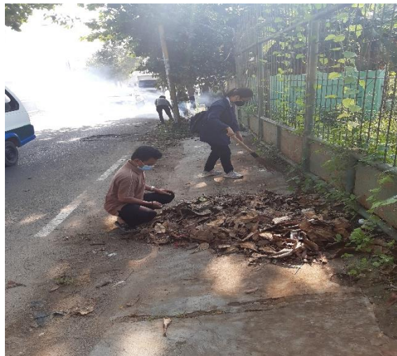
Gambar 2.3.4 kegiatan harian gotong royong oleh RT dan Lurah

Kegiatan ini merupakan kegiatan rutin yang diadakan setiap hari Jum'at oleh Lurah, RT, Linmas, Staf Babinsa, Babinkantibmas, kegiatan gotong royong bersih-bersih ini diadakan sebagai wujud peduli agar lingkungan sekitar tetap bersih dan mengurangi banjir.