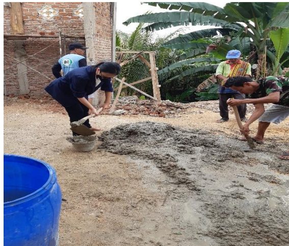
Gambar 2.3.2 Gotong Royong Untuk pembangunan TPA