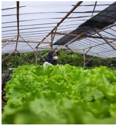
Gambar 2. 1 Evaluasi Lokasi

Saya di sini menyeleksi dan mengobservasi apa saja yang harus di kembangkan dari Alfian fram agar UMKM sayuran Hidroponik ini bias berkembang dalam pangsa pasar yang lebih luas maka dai itutujuan saya meng observasi ini agar menciptakan ide – ide dalam menguasai penambahan pendaptan .