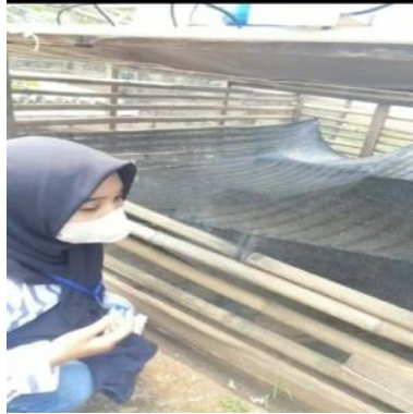
Gambar 2. 2 Mempelajari Kinerja Air