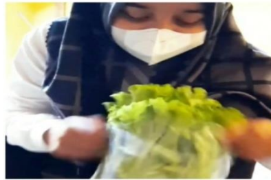
Gambar 2. 4 Pengemasan Selada