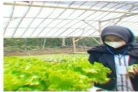
Gambar 2. 3 Memanen Selada

Melakukan pemanenan selada dan di sini saya memanen selada jenis bohenavian yang sudah sekitar 25 hari pertumbuhnya