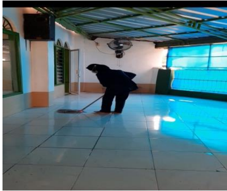
Gambar 2. 6 Membersih tempat ibadah

Membantu Masyarakat dalam membesihkan tempat dan menjaga kebersihan tempat ibadah agar terawat