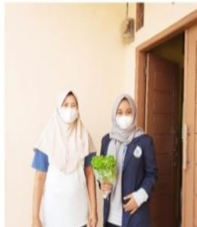
Gambar 2. 5 Penyuluhan

Melakukan dan membuat laporan penyuluhan yang dilakukan saya kepada ibu Rumah tangga apa mengenai Sayuran hidroponik dan mengenalkan bagaimana cara penanaman sayuran hidroponik dan menjelaskan bahwa sayuran tersebut tidak berbahaya untuk dikonsumsi