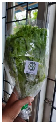
Gambar 2. 7 Memberi Label Selada

Yakni bertujuan dalam melakukan penempelan lebel guna sebagai identitas dalam sebuah produk agar memudahkan pembeli dalam mencari lokasi penjualan melalui google dengan akun instagaram yang tertera.