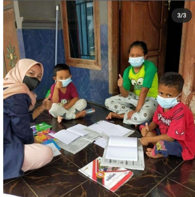
Gambar 2.5 Pendampingan Belajar Terhadap Siswa Siswa