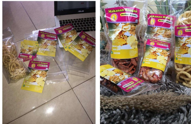
Gambar 2.4 Membuat Kemasan Baru