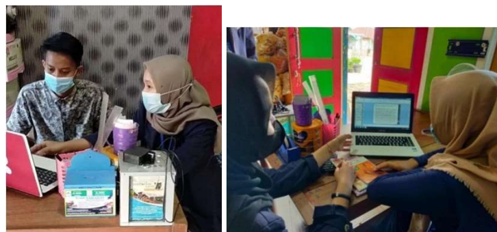
Gambar 2.1 Pelatihan Akun Social Media Shopee

Pada masa pandemic ini, Berkah Gendis mengalami banyak kerugian seperti jarang nya pembeli yang membeli produk makanan ringan, harga bahan pokok yang terus meningkat. Pada kesempatan PKPM ini pengabdian membantu UMKM dalam pembuatan produksi dan pengembangan UMKM dengan Memberikan pelatihan akun social media berupa shopee, instagram dan facebook untuk mempermudah proses bisnis jual beli online pada UMKM Berkah Gendis.