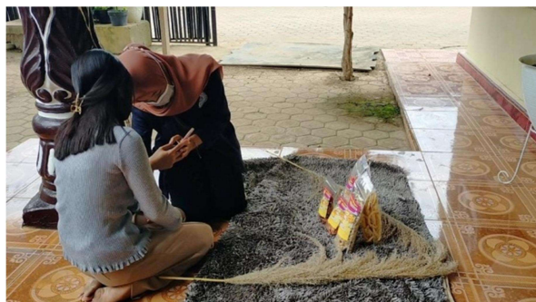
Memberikan Pengarahan Pengambilan Foto Produk