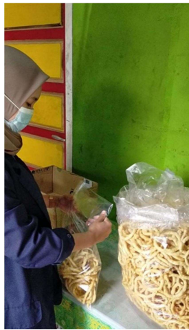
Membantu Kegiatan Jual Beli di Toko Berkah Gendis