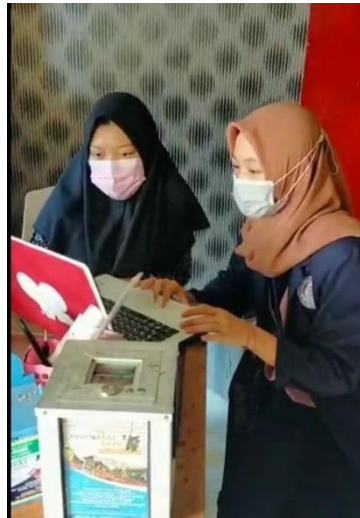
Gambar 1.3 Cara pemasaran produk aplikasi E-Commerce dan Sosial media.

Pemaparan materi tentang Bisnis Digital kepada Karyawan UMKM makanan ringan Berkah Gendis. Dalam menunjang realisasi usaha pada UMKM setempat, maka dari itu diperlukan pemahaman terkait bisnis online. Pada kesempatan ini pengabdian dapat menyampaikan beberapa point terkait strategi untuk menjalankan bisnis online. Dari diskusi bersama pengelola UMKM di tempat, didapat kendala-kendala yang mereka alami, seperti kesulitan dalam pembuatan Media Sosial & E-Commerce yang berperan untuk proses pemasaran dan aktivitas digital lainnya. Setelah semua memahami bisnis online secara teori langkah yang nantinya pengabdian ambil yaitu pendampingan dalam pembuatan media dalam pemasaran