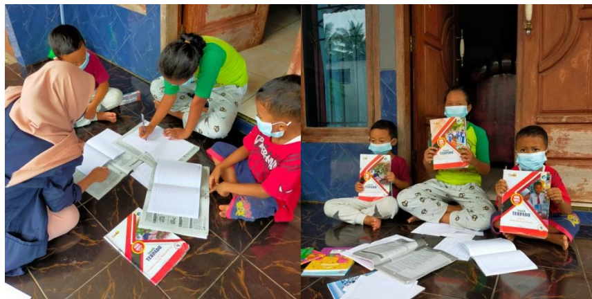
Gambar 2.3 Mendampingi siswa/i belajar bersama tingkat SD di rumah.

Acara perayaan ini memang setiap tahunnya diadakan untuk memperingati HUT-RI. Acara ini dimeriahkan dengan mengadakan berbagai lomba. Masyarakat sekitar sangat antusias mengikutinya.