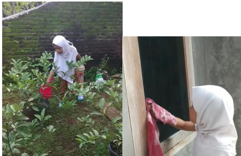
Gambar 3.2 Kegiatan menjaga kebersihan lingkungan dengan anak-anak lingkungan sekitar.