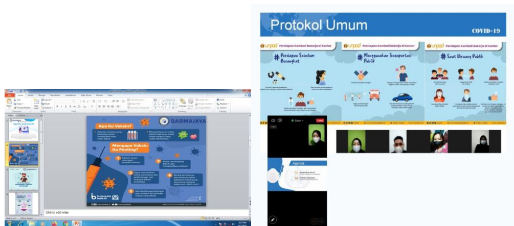
Gambar 3.3 Pembuatan materi dan sosialisasi mengenai vaksin dan pencegahan Covid-19 melalui zoom meeting.