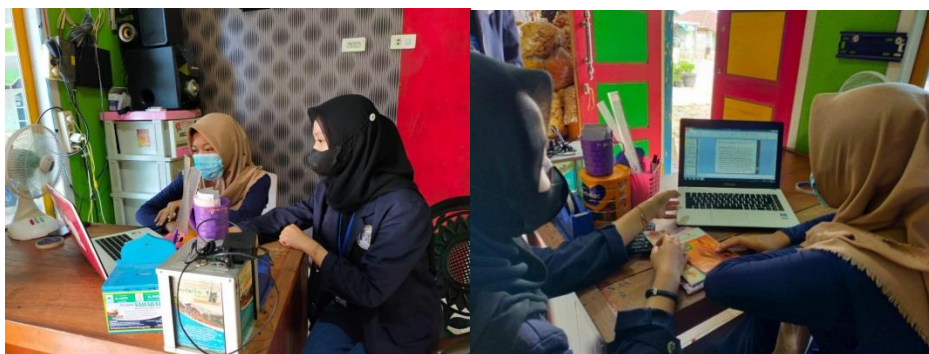
Gambar 1.2 Mengenalkan Aplikasi E-Commerce pada UMKM Makanan Ringan.

Penjelasan ini guna memudahkan penyusunan laporan, seperti perhitungan Neraca, dan Laporan Laba Rugi untuk mengetahui pemasukan dan pengeluaran usaha sehingga tertata lebih baik dan memudahkan untuk melihat setiap keuntungan penjualan.