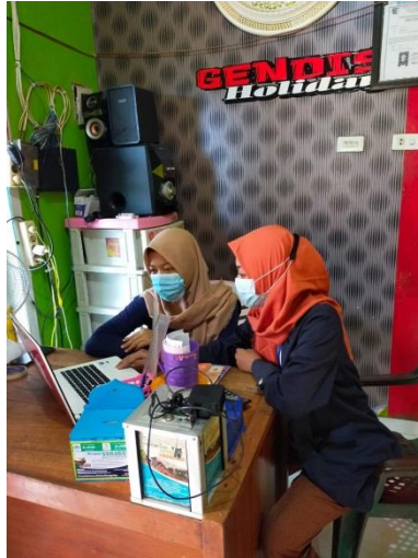
Gambar 1.1 Penjelasan kepada pemilik UMKM mengenai penyusunan laporan keuangan sederhana.

Penjelasan ini guna memudahkan penyusunan laporan, seperti perhitungan Neraca, dan Laporan Laba Rugi untuk mengetahui pemasukan dan pengeluaran usaha sehingga tertata lebih baik dan memudahkan untuk melihat setiap keuntungan penjualan.