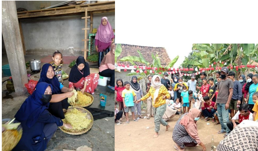
Gambar 2.2 Berpartisipasi dan membantu acara kegiatan HUT-RI di Desa.

Acara perayaan ini memang setiap tahunnya diadakan untuk memperingati HUT-RI. Acara ini dimeriahkan dengan mengadakan berbagai lomba. Masyarakat sekitar sangat antusias mengikutinya.