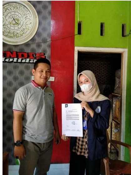
Gambar 3.3 Izin pelaksanaan PKPM Mandiri di UMKM Makanan Ringan.