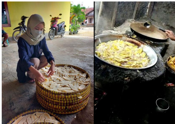
Gambar 1.7 Peninjauan ke pabrik produksi makanan ringan.

Kegiatan ini untuk melihat bagaimana pembuatan makanan ringan jenis Kerupuk dan Keripik, sekaligus membantu proses pembuatan di pabriknya. Jenis kerupuk yang di produksi berbagai macam yaitu, Kerupuk cumi, Kerupuk mawar, Makaroni, dan Kerupuk udang, serta Keripik Singkong dan Keripik Pisang. Proses penggorengan dilakukan dua kali yaitu menggunakan minyak sedang dan panas, serta menggunakan api yang harus tetap menyala dengan bantuan alat untuk meniup api secara otomatis agar suhu tetap terjaga menggunakan mesin vakum dan pipa besi.