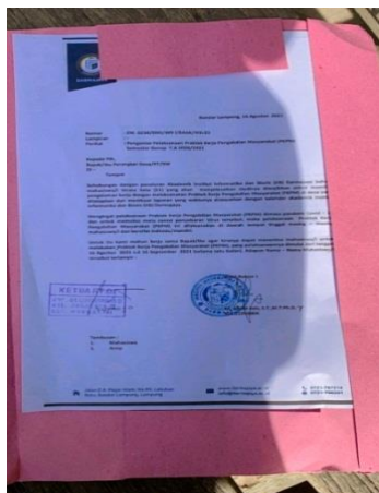
(Surat Balasan Izin Dari RT)