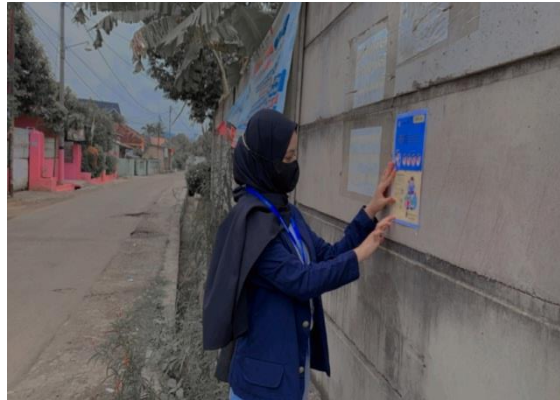
Gambar 2.6. Poster Sosialisasi Gambar 2.6.1 Menempelkan poster