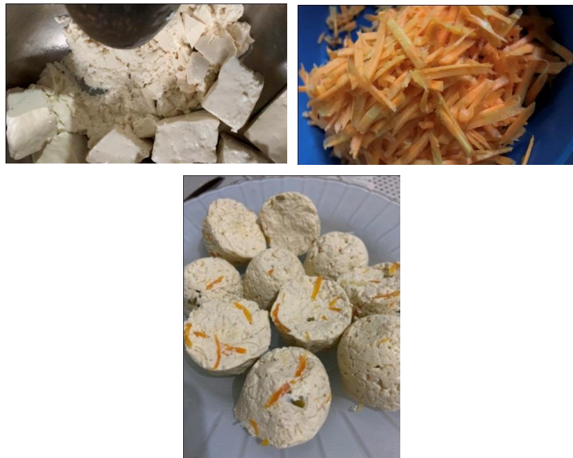
Gambar 2.3. Inovasi Menu Olahan

di jadikan sebagai peluang usaha jajanan. (diperlukan adanya sebuah kreatifitas dan inovasi yang dilakukan oleh pelaku bisnis bertujuan agar usahanya tetap berkembang dan bertahan).