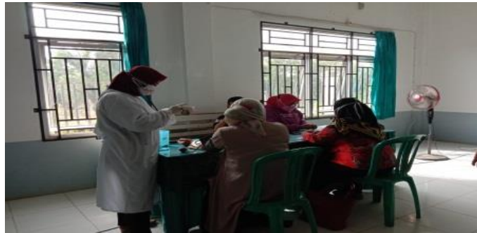
Gambar 2.7.1 Vaksinasi