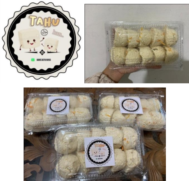
Gambar 2.4. Packaging yang siap dipasarkan