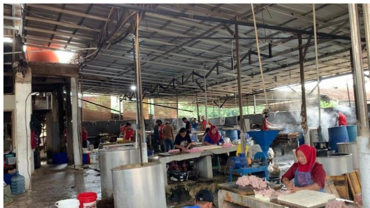
Gambar 2.1. Izin UMKM

UMKM adalah roda penggerak perekonomian Indonesia. Ketika berbicara tentang bisnis dan ekonomi, apalagi tentang dunia usaha terkadang kita dihadapkan pada satu istilah yang sangat berperan terhadap perekonomian yaitu UMKM. UMKM secara umum adalah singkatan dari Usaha Mikro Kecil dan Menengah. Yang mana ini merupakan satu model baru dalam kegiatan perniagaan atau perdagangan. Ada juga yang mengartikan bahwa UMKM adalah suatu usaha perniagaan yang pengelolaannya dilakukan oleh individu atau perorangan serta badan usaha dengan lingkup kecil yang lebih dikenal dengan istilah mikro.