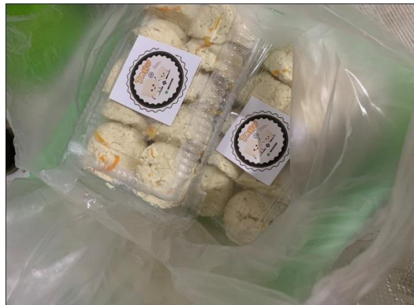
(Inovasi Menu Baru Terbuat Dari Tahu)