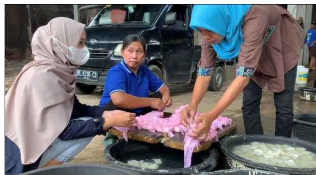
Gambar 2.2. Proses Pembuatan