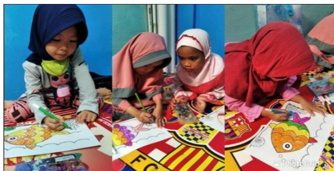
Gambar 2.5.1 Edukasi Bersama Anak-Anak