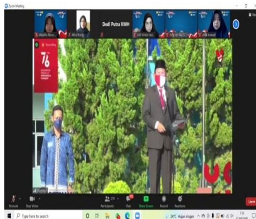
(Upacara 17 Agustusan Via Zoom)