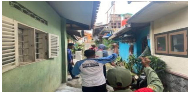
Gambar 2.7.2 Penyemprotan Disinfektan