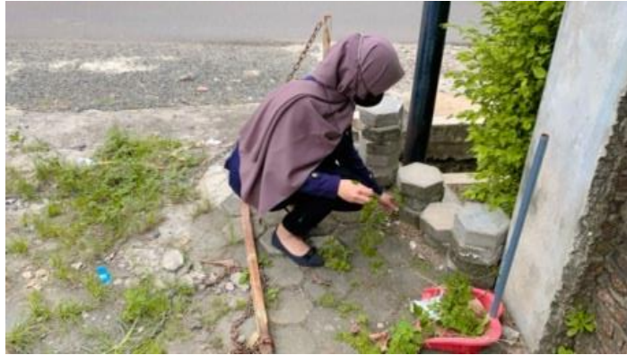
Gambar 2.7. Jum'at Bersih