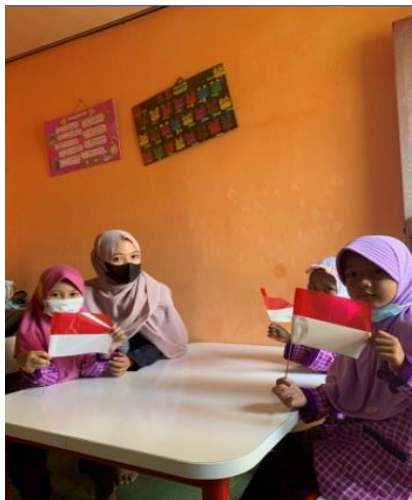
Gambar 2.5. Edukasi Anak-Anak di TK Rumah Pintar

Dalam penerapan belajar online ini tidak sedikit siswa yang mengalami kesulitan dalam belajar dikarenakan kurangnya efektifitas interaksi komunikasi antara guru dan siswa, maka dari itu saya membantu proses belajar anak-anak yang terdampak pandemi ini.