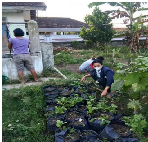
Gambar 2.15 Berkreasi Menggunakan Barang Bekas