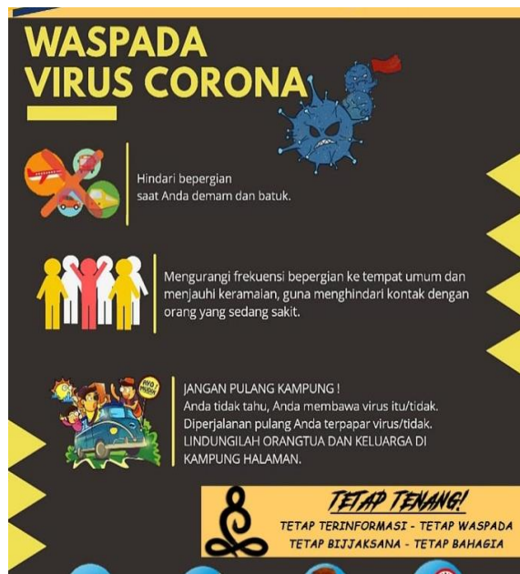
Gambar 2.9 Pembuatan Poster COVID-19

Dalam hal ini saya membuat poster pencegahan dan penanggulangan bahaya COVID-19. Dengan saya membuat poster tersebut diharapkan mampu mencegah penyebaran virus melalui kegiatan edukasi COVID-19..