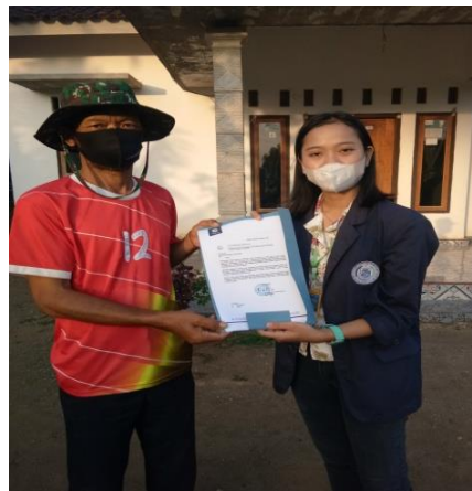
Gambar 2.10 Pemberian Surat Izin kepada Pak RT 011