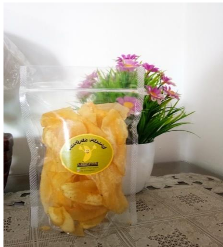
Gambar 2.4 Keripik Pisang Varian Rasa Original

Dalam usaha inovasi adalah salah satu senjata untuk dapat mempertahankan produk unggulan perusahaan. Karena dengan inovasilah produk dapat lebih dikenal karena produk juga harus mengikuti perkembangan zaman agar dapat diterima konsumen. Maka perlu adanya pelatihan untuk memenuhi kebutuhan dan perkembangan zaman yang begitu cepat. Inovasi yang dilakukan disini ialah penambahan varian rasa. Pada awalnya Usaha Mandiri Keripik Pisang Catur Putri hanya memiliki satu macam produk untuk di pasarkan, saya menginovasi menjadi beberapa macam varian yaitu keripik pisang rasa balado dan keripik pisang rasa