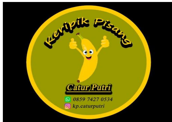
Gambar 2.2 Merk Produk Keripik Pisang Catur Putri

Merk Produk ini didesain menggunakan Photoshop. Dengan pembuatan label (stiker) tersebut diharapkan dapat meningkatkan penjualan dari Usaha Mandiri Keripik Pisang Catur Putri itu sendiri. label ini akan digunakan untuk meningkatkan penjualan dan nantinya akan diletakkan dibagian depan kemasan.