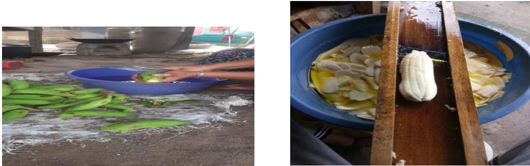
Gambar 2.3 Proses Pengolahan Bahan Baku