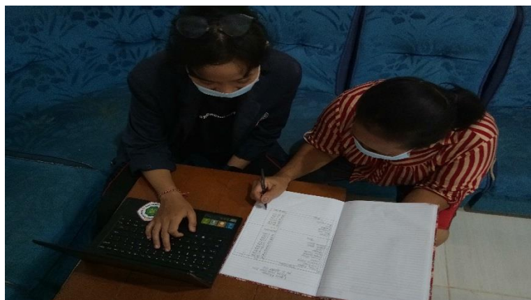
Gambar 2.1 Memperkenalkan Cara Membuat Laporan Keuangan