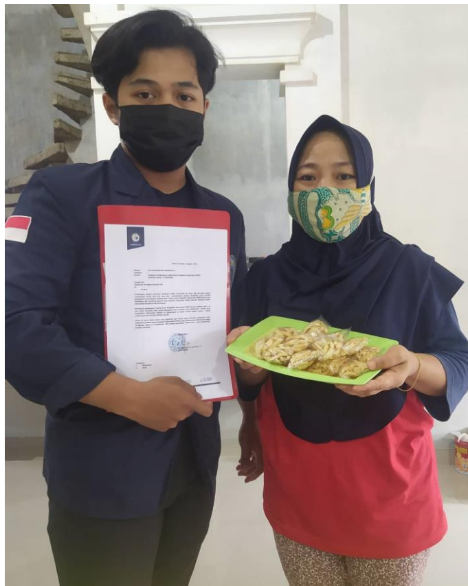
Gambar 2.2 Perizinan Kegiatan Kepada UMKM Tusuk Gigi Gurih

UMKM tersebut sempat terhambat dalam produksi karena kurangnya pengetahuan mengenai inovasi produk dan kurangnya pengetahuan mengenai pembukuan dan pemasaran dengan memanfaatkan teknologi sebagai penjunjang aktivitas tersebut. Oleh karna itu, kegiatan yang saya lakukan untuk memulihkan UMKM tersebut yaitu dengan membantu dalam proses pembuatan, pencetakan dan pengemasan produk UMKM Tusuk Gigi Gurih.