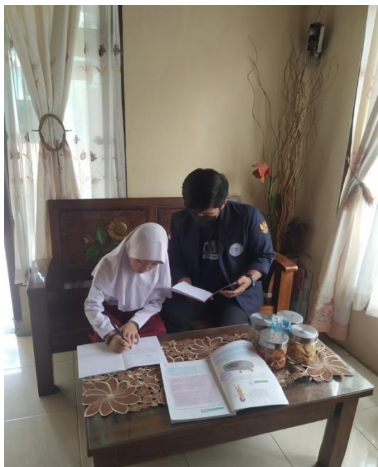
Gambar 2.7 Bimbingan Proses Pembelajaran