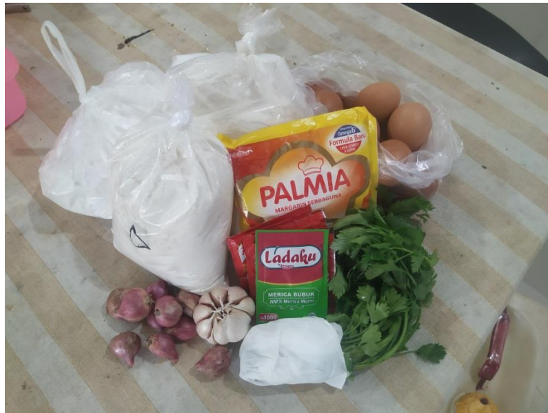
Foto Bahan Pembuatan Stick Goreh Mom's Lina