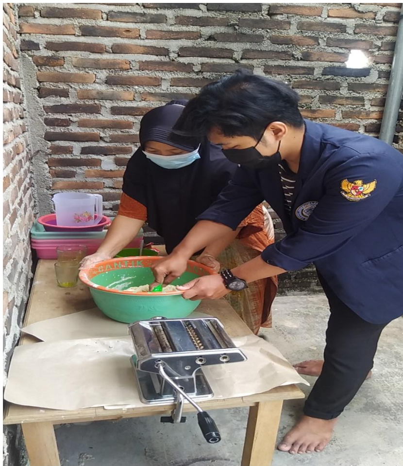
Foto Saat Menguleni Adonan Stick Gurih