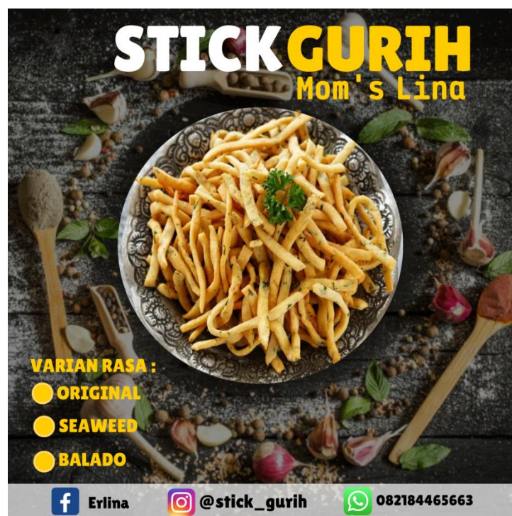
Gambar 2.5 Inovasi Design Logo Produk Baru

Desain logo yang dimiliki UMKM Tusuk Gigi Gurih sebelumnya dirasa kurang efektif, karena pada logo tidak terdapat informasi kontak yang dapat dihubungi apabila pelanggan ingin melakukan pemesanan kepada UMKM. Dari permasalahan tersebut, saya membantu dalam mereDesain logo dan mencantumkan informasi kontak agar dapat mempermudah pelanggan dalam melakukan pemesanan, selain itu pada Desain logo produk baru dibuat semenarik mungkin karena bertujuan untuk menarik minat pelanggan UMKM Tusuk Gigi Gurih.