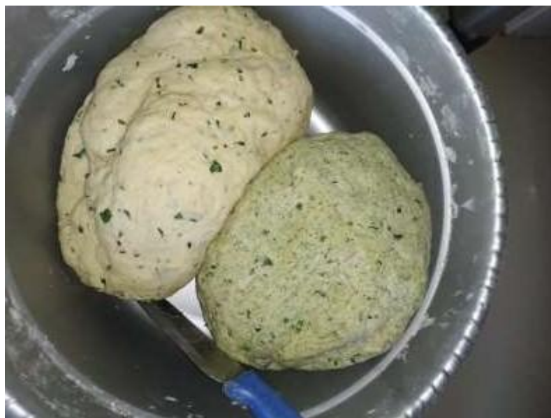
Foto Hasil Adonan Yang Telah Di Uleni