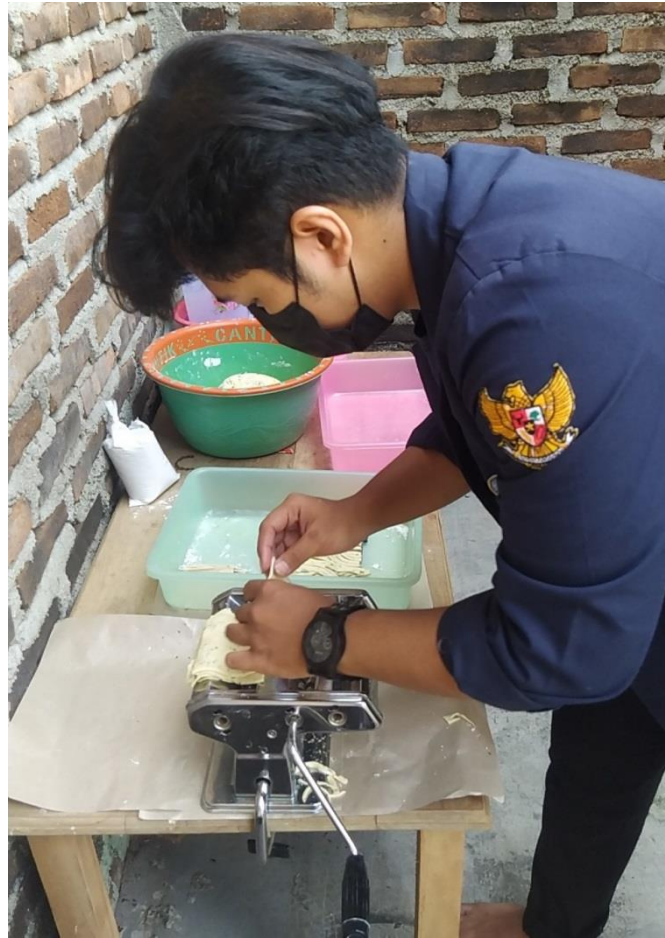
Gambar 2.3 Membantu Proses Pembuatan Tusuk Gigi Gurih