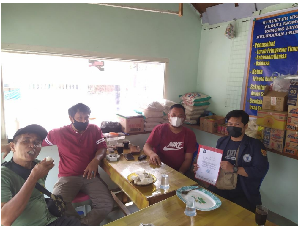
Membantu Posko Peduli Isoman COVID-19