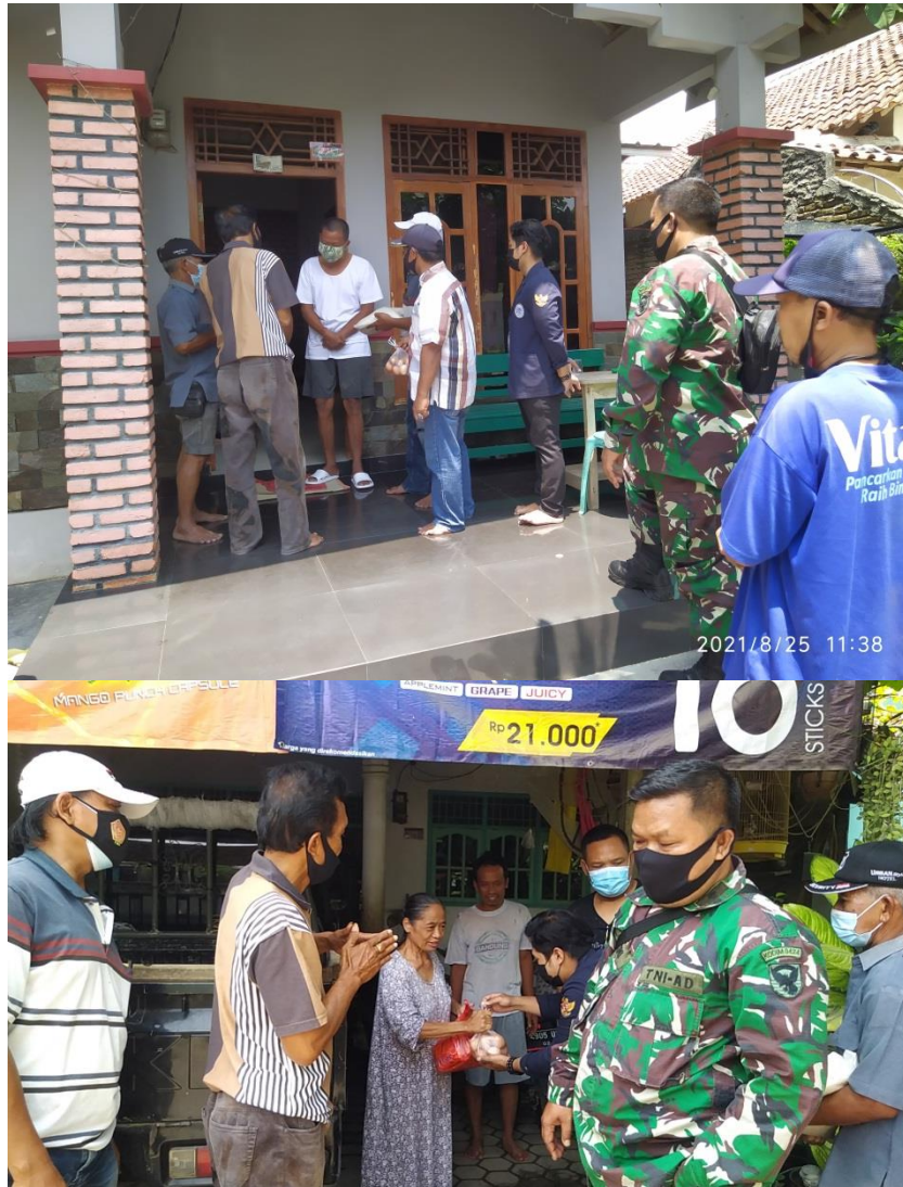
Proses Pembagian Sembako Untuk Masyarakat Yang Terkena Dampak COVID-19