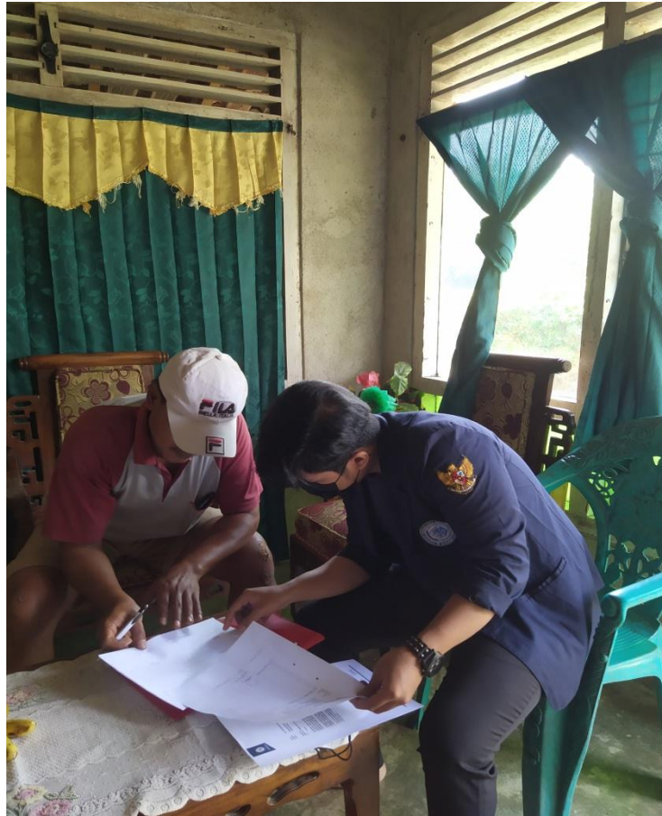
Foto Bersama RT 008 Saat Hari Pertama Melakukan PKPM