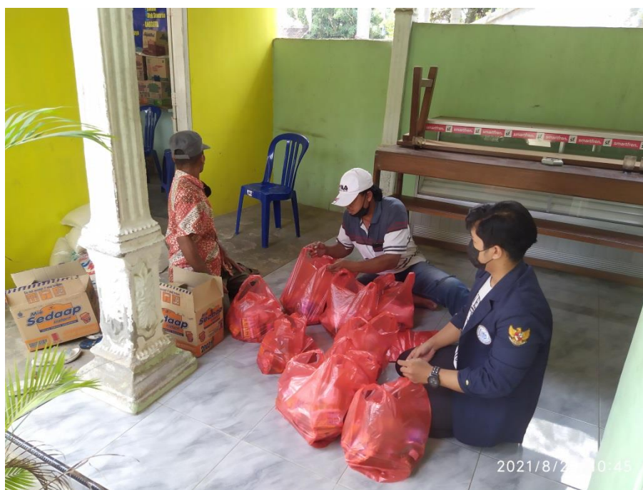
Pengemasan Sembako Sebelum Di bagikan