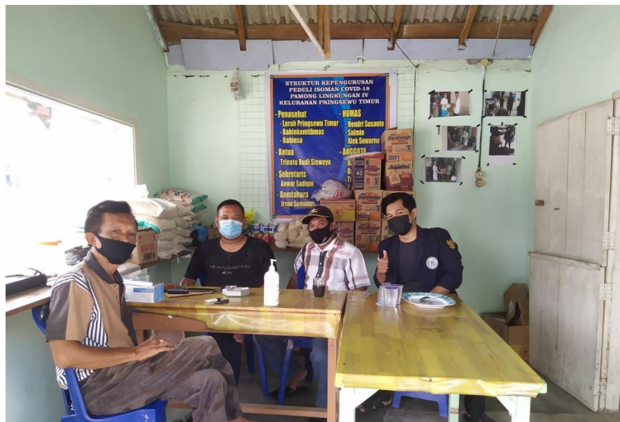
Gambar 2.9 Membantu Posko Peduli Isoman COVID-19