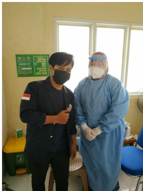
Gambar 2.8 Program Vaksinasi di Puskesmas Pringsewu Timur

Peran saya disini adalah membantu program pemerintah sehingga terlaksana sepenuhnya, khususnya di lingkungan tempat saya tinggal seperti vaksinasi yang dilaksanakan pada Puskesmas di Pringsewu Timur.