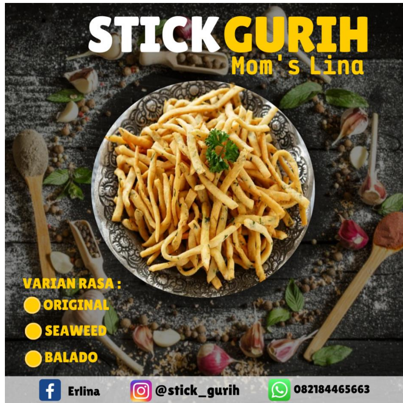
Pembuatan Logo Design Sticker