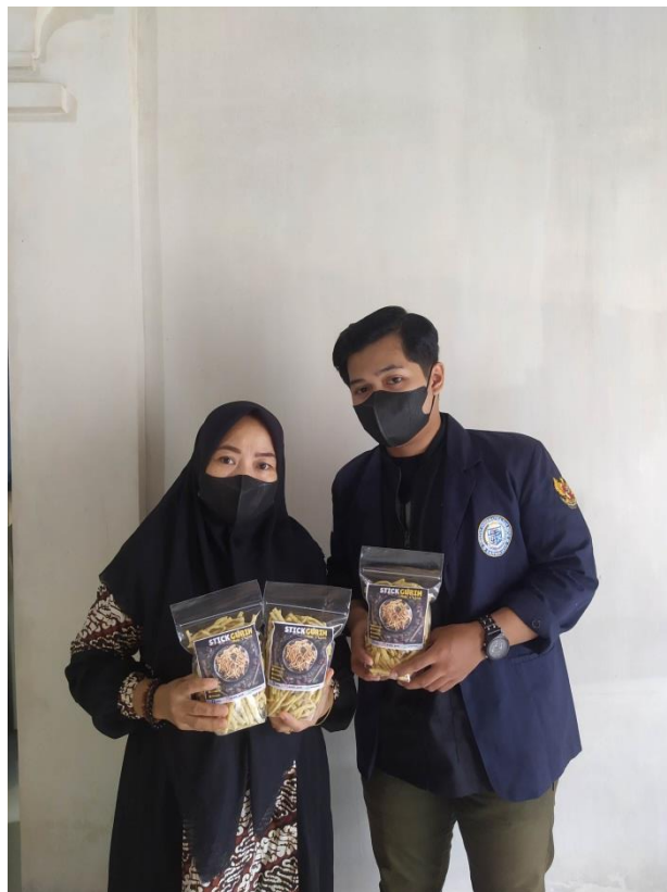
Foto Hasil Produk Yang Siap di Jual