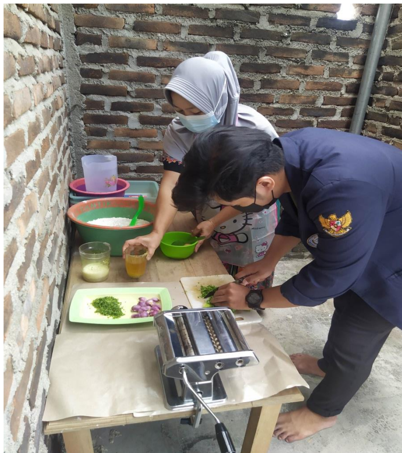
Foto Saat Pemoangan Bahan-Bahan Stick Goreh