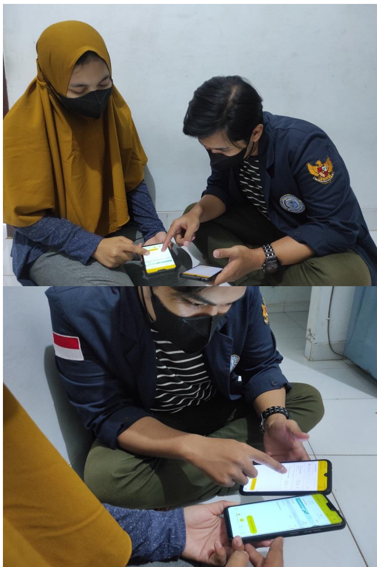
Gambar 2.4 Pengarahan Pengoprasian Aplikasi BukuKas.