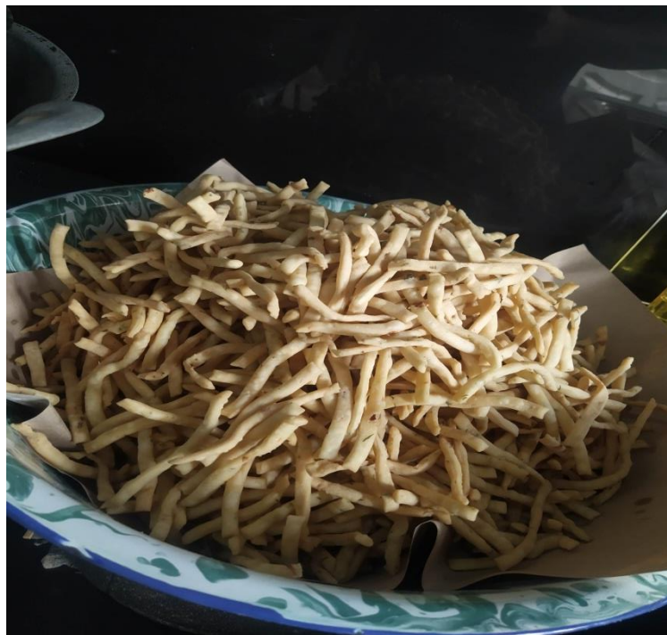
Hasilnya Setelah di Goreng