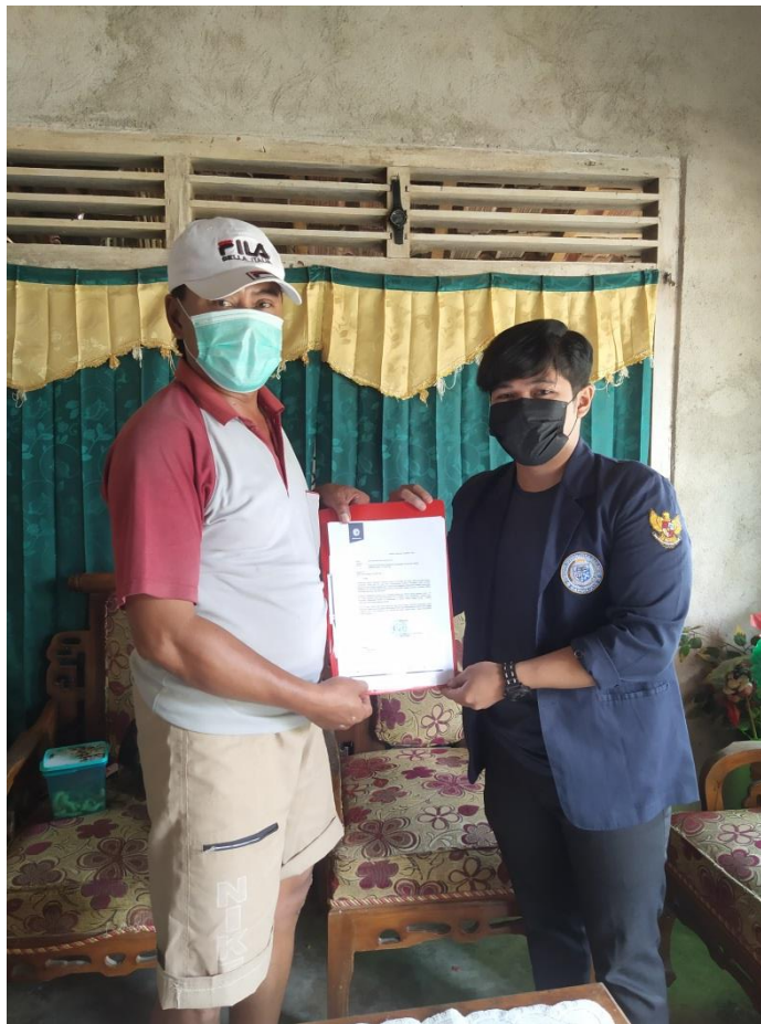
Gambar 2.1 Perizinan PKPM Mandiri Kepada Aparatur Desa

Mengunjungi Rumah RT (Rukun Tetangga) untuk memperkenalkan diri dan memberitahukan bahwa saya meminta izin akan menjalankan agenda yang sudah saya rincikan kegiatannya serta meminta dampingan RT untuk menjalankan beberapakegiatan yang akan saya lakukan.