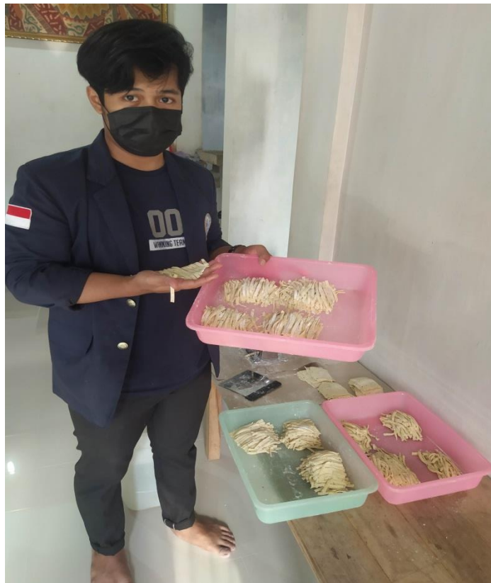
Foto Proses Penggilingan dengan Mesin Penggiling Manual