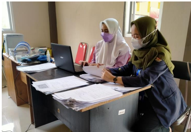
Foto Membantu Input Data Manual Di Puskesmas Mataram Baru