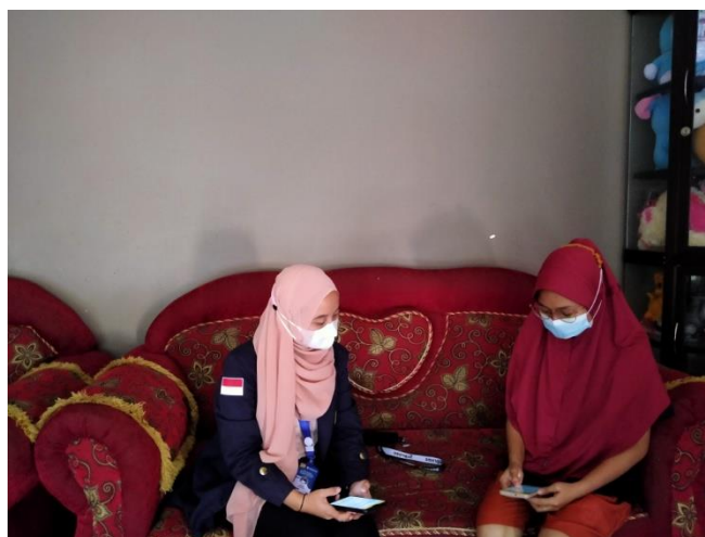
Foto Pemasaran Produk Melalui Media Sosial Instagram