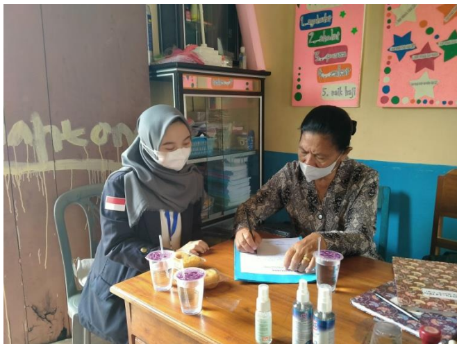
Gambar 2.8 Perizinan Kepada Kepala Sekola TK Mardi Siwi

Kegiatan yang saya lakukan pada TK Mardi Siwi adalah meminta perizinan untuk membantu guru desa dalam bimbingan proses pembelajaran serta membantu mengarahkan siswa-siswi dalam mengerjakan tugas yang diberikan wali kelas (guru) di TK Mardi Siwi dengan tetap menerapkan protokol kesehatan.