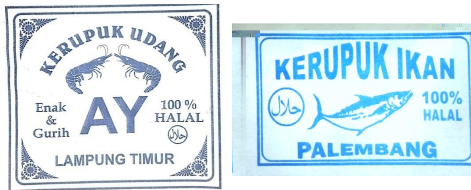
Gambar 2.5 Desain Logo Produk Lama

Desain logo yang dimiliki UMKM Kerupuk “AY” sebelumnya dirasa kurang efektif, karena pada logo tidak terdapat informasi kontak yang dapat dihubungi apabila pelanggan ingin melakukan pemesanan kepada UMKM. Dari permasalahan tersebut, saya membantu dalam meredesain logo dan mencantumkan informasi kontak agar dapat mempermudah pelanggan dalam melakukan pemesanan, selain itu pada desain logo produk baru dibuat semenarik mungkin karena bertujuan untuk menarik minat pelanggan UMKM Kerupuk “AY”.