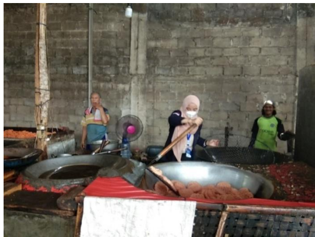
Foto Proses Penggorengan Kerupuk