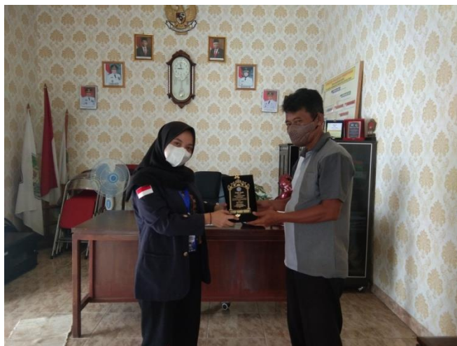
Foto Pemberian Plakat Sebagai Ucapan Terimakasih Kepada Desa Mataram Baru