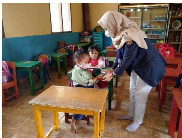
Foto Penggunaan Handsinitizer Pada Siswi TK Mardi Siwi