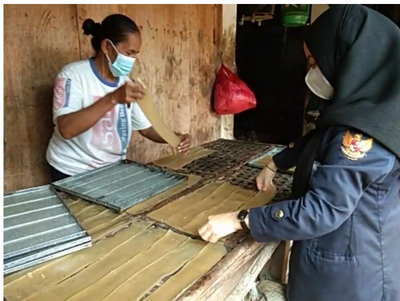
Gambar 2.3 Membantu Kegiatan UMKM Kerupuk “AY”