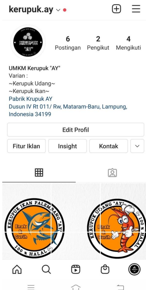
Gambar 2.6 | Memasarkan Ke Media Sosial Instagram

Selain itu juga, saya membuatkan media sosial sebagai sarana pemasaran agar pemasarannya menjadi semakin meluas. Karena saat ini para konsumen sangat menyukai hal-hal yang sifatnya online dan praktis tanpa harus keluar rumah untuk membeli produk tersebut.