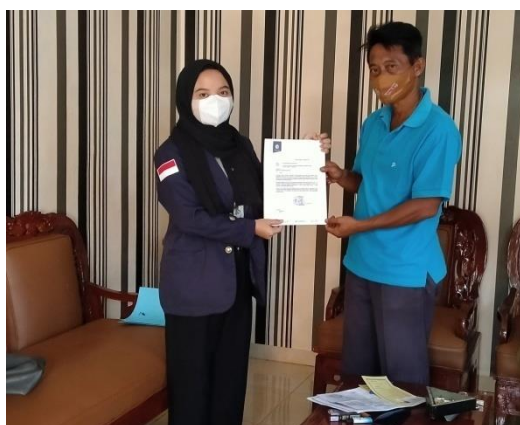
Gambar 2.1 Perizinan PKPM Mandiri Kepada Kepala Desa

Mengunjungi Balai Desa Mataram baru untuk memberitahukan bahwa saya meminta izin akan menjalankan agenda PKPM Mandiri yang sudah saya rincikan kegiatannya serta meminta dampingan Kepala Desa untuk menjalankan beberapakegiatan yang akan saya lakukan.