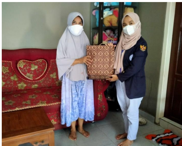
Foto Pemberian Bingkisan Sebagai Ucapan Terimakasih Kepada Pemilik UMKM Kerupuk “AY”