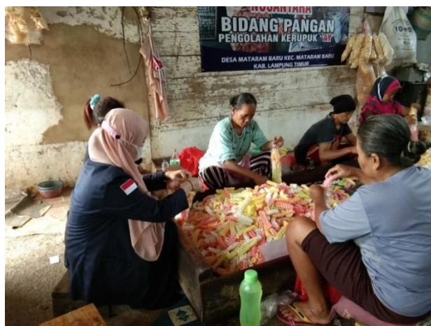
Foto Pengemasan Kerupuk