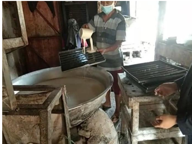
Foto Proses Pembuatan Kerupuk