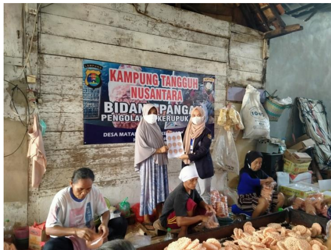
Foto Penyerahan Inovasi Logo Produk Kepada Pemilik UMKM Kerupuk “AY”