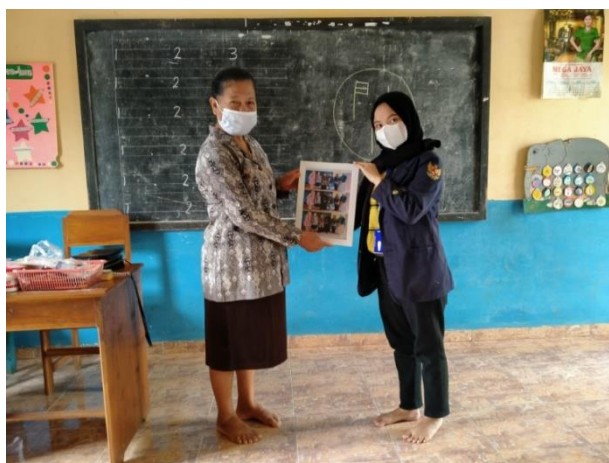
Foto Pemberian Bingkisan Sebagai Ucapan Terimakasih Kepada TK Mardi Siwi