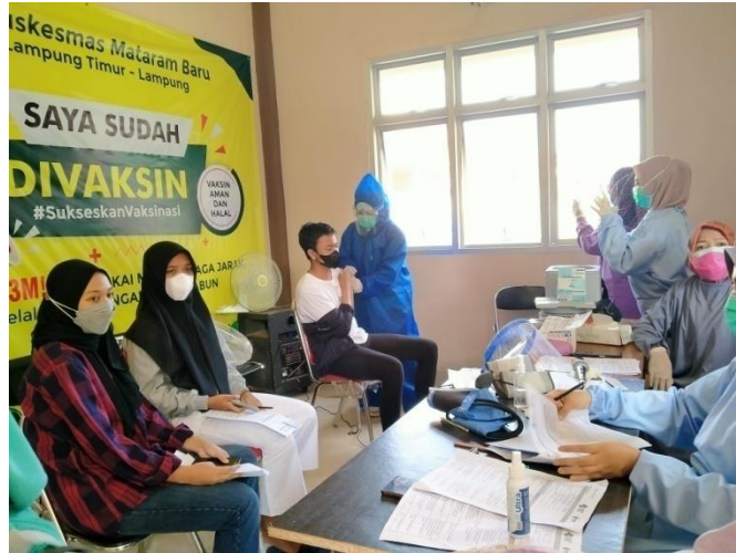
Foto Kegiatan Vaksinasi Di Puskesmas Mataram Baru