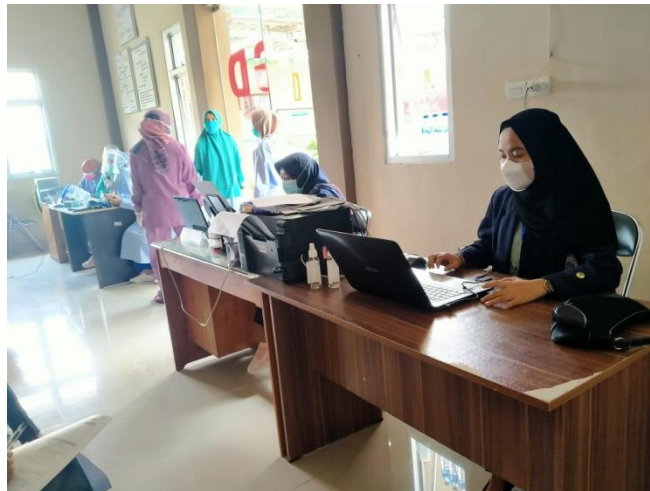
Gambar 2.10 Program Vaksinasi di Puskesmas Mataram Baru

Peran saya disini adalah membantu program pemerintah sehingga terlaksana sepenuhnya, khususnya di lingkungan tempat saya tinggal seperti vaksinasi yang dilaksanakan pada Puskesmas di desa Mataram Baru. Selain itu saya melakukan kegiatan sosialisasi pentingnya mencuci tangan setelah bepergian, tidak melakukan kontak fisik secara langsung serta menjaga jarak dengan orang lain.