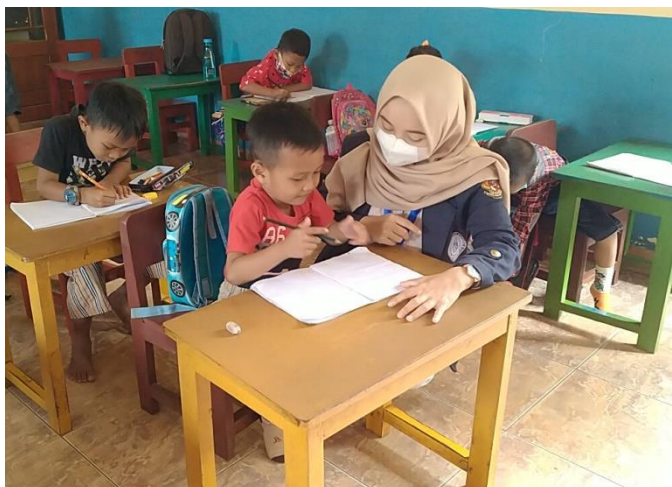
Gambar 2.9 Bimbingan Proses Pembelajaran