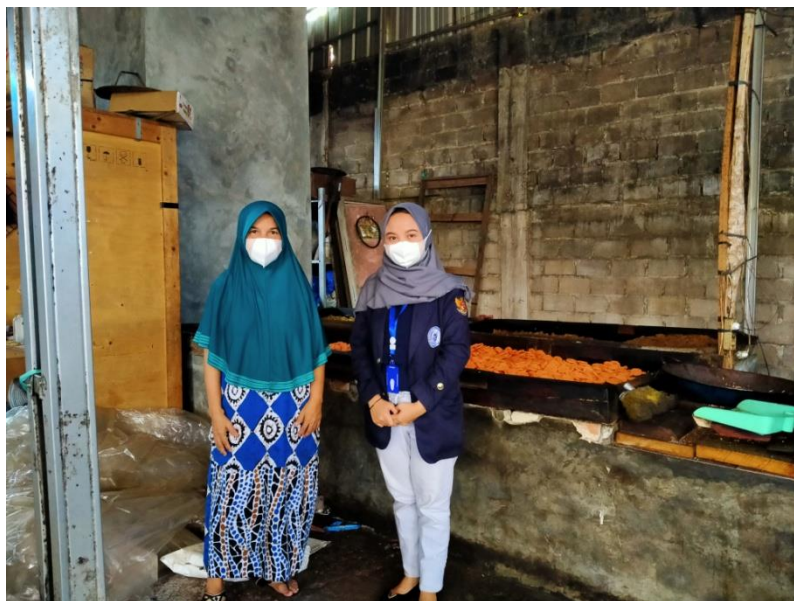
Gambar 2.2 Perizinan Kegiatan Kepada UMKM Kerupuk “AY”

sebagai penjunjang aktivitas tersebut. Oleh karena itu, kegiatan yang saya lakukan untuk memulihkan UMKM tersebut yaitu dengan membantu dalam proses pembuatan, pencetakan dan pengemasan produk UMKM Kerupuk “AY”.