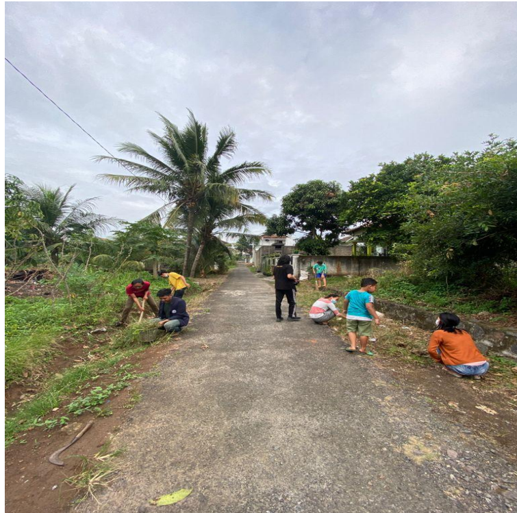
Gambar 2.3.9 Melaksanakan gotong royong.

Kegiatan ini bertujuan untuk membantu masyarakat bersih-bersih desa dan membersihkan got untuk aliran air ketika hujan ,supaya tidak banjir. Gotong royong juga membuat kita lebih akrab dengan masyarakat.