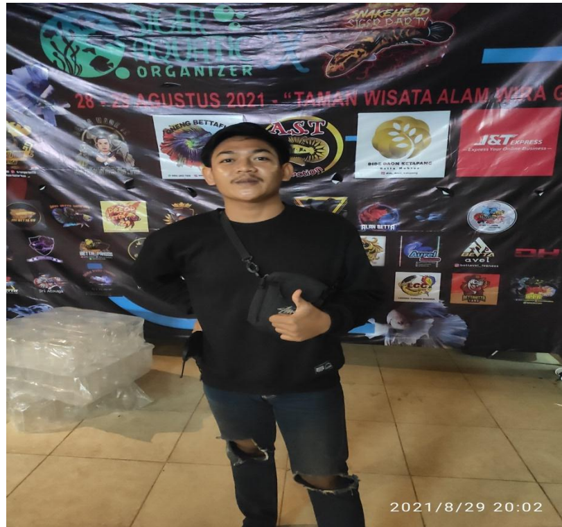
Gambar 2.3.3 Mengikuti perlombaan ikan cupang hias.

Kegiatan ini bertujuan untuk meningkatkan harga jual ikan cupang hias dan mampu bersaing dengan UMKM lainya serta memberikan nama untuk UMKM ikan cupang BETTABETTIFAN.LPG.