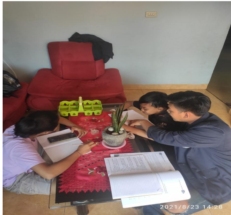
Gambar 2.3.6 Membantu anak-anak dalam sekolah Online.

Kegiatan ini bertujuan untuk membantu anak-anak di mana saat pandemic ini anak-anak tidak bias sekolah seperti biasanya, sehingga mereka di tuntut mandiri maka dari itu saya berinisiatif untuk membantu mereka belajar.