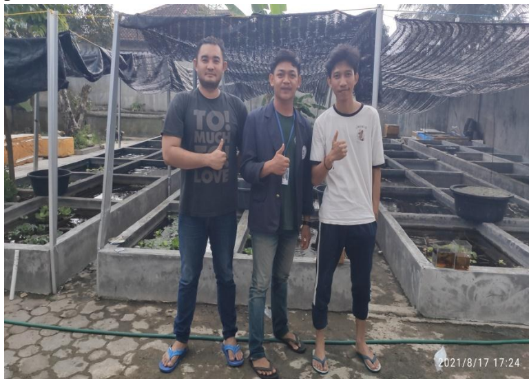
Gambar 2.3.2 Mengadakan sosialisasi dan wawancara dengan pemilik UMKM.

Kegiatan ini bertujuan untuk meminta izin melaksanakan UMKM dan mengetahui kendala apa saja yang terjadi di UMKM tersebut selama pandemi Covid-19 ini.