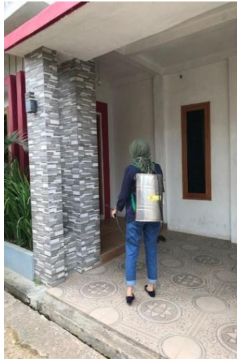
Gambar 2.3.5 Penyemprotan disinfektan

covid 19 .Disinfektan adalah sebutan bagi larutan atau zat kimia tertentu yang dapat membunuh bakteri atau mirkroorganisme yang ada pada suatu objek tertentu.