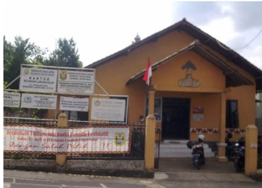
Gambar 1.1.1 Profil dan Potensi Desa

Kecamatan Tanjung senang adalah salah satu bagian dari wilayah Kota Bandar Lampung. Kecamatan tanjung senang memiliki batas wilayah utara yaitu kecamatan rajabasa dan kabupaten lampung selatan, batas wilayah timur yaitu kabupaten lampung selatan, batas wilayah selatan yaitu kecamatan labuhan ratu, kacamatan way halim, dan kecamatan sukarama. Batas wilayah barat yaitu kecamatan rajabasa. Kecamatan tanjung senang merupakan daerah dengan luas desa/kelurahan dengan luas 5km 2 kecamatan tanjung. Kelurahan labuhan dalam yang berjarak 5km dari kota Bandar Lampung.