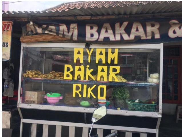
Gambar 1.1.2 Profil UMKM

Nama Usaha : Nasi goreng Dan Pecel lele Riko