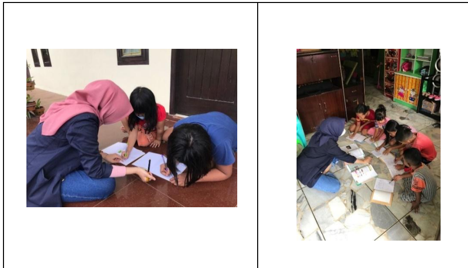
Gambar 2.3.6 Proses Pembelajaran Pada Lingkungan Sekitar