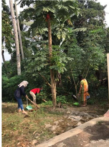
Gambar 2.3.7 Kegiatan Gotong Royong