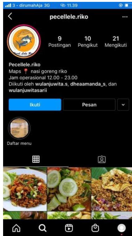
Gambar 2.3.2 Memasarkan produk di media sosial