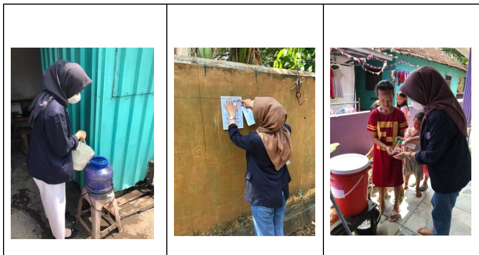
Gambar 2.3.4 Upaya Penanganan Covid-19 Membuat prokes

RT 07 labuhan dalam dan di UMKM, guna mencegah konsumen – konsumen yang datang terhindar dari Virus Covid-19. Selain itu, kita juga perlu memberikan pengetahuan kepada masyarakat dengan informasi – informasi mengenai protokol Kesehatan yang ada. Dengan metode pemasangan pamflet di daerah labuhan dalam diharapkan dapat menambah wawasan kepada masyarakat untuk terus menjaga Kesehatan dan terus mengikuti protokol Kesehatan yang ada.