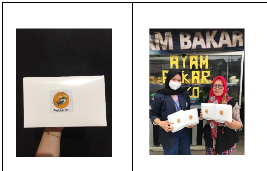
Gambar 2.3.3 Inovasi packaging di UMKM

Pada packaging yang saya buat. Warna putih adalah warna yang sangat cocok, melihat sebuah karakter elegan dan modern menjadikan warna putih adalah warna pilihan saya. Pada bagian tengah kemasan saya beri sebuah logo.