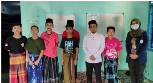
Gambar 2.12 Pemberian bingkisan