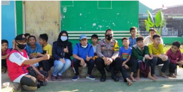
Gambar 2.11 Silaturahmi ke PONPES Yatim Duafa