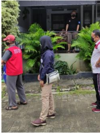
Gambar 2.9 Penyemprotan disinfektan