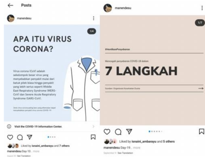
Gambar 2.15 Sosialisasi online

Selain sosialisasi secara door to door, saya juga melakukan sosialisasi Covid-19 dengan menggunakan Instagram sebagai media untuk melakukan sosialisasi. Tujuannya adalah untuk mengingatkan kembali masyarakat tentang adanya pandemi Covid-19 dan memberikan edukasi tentang pencegahan penyebaran Covid-19.