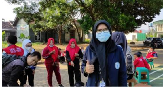
Gambar 2.10 Gotong royong