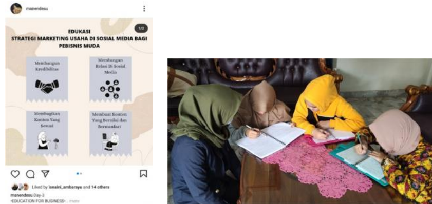
Gambar 2.13 Edukasi

pembelajaran anaknya. Selain itu edukasi yang dilakukan adalah memberikan strategi marketing secara online melalui Instagram.