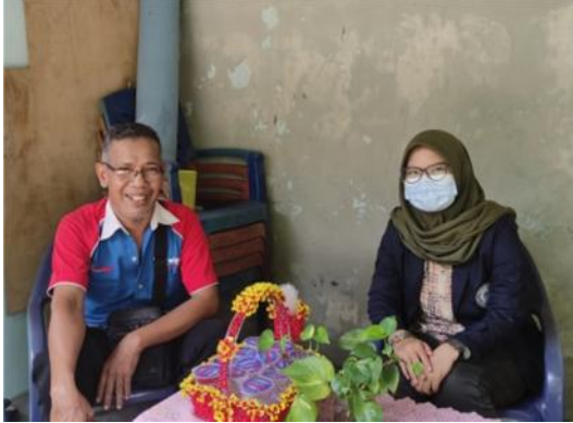
Gambar 2.2 Meminta arahan survey

ketiga UMKM tersebut, saya mendapat izin dari pemilik umkm Rumah Kopi dan Popcorn untuk melihat dan mengetahui kondisi umkm.