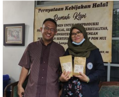
Gambar 2.3 Kunjungan umkm kopi

Setelah mengunjungi dan berbincang bersama pemilik umkm kopi dan popcorn, saya memilih umkm Popcorn untuk melakukan kegiatan PKPM, karena pemilik umkm Rumah Kopi sudah sangat baik dalam mengelola umkmnya.