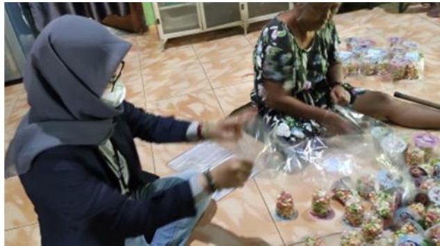
Gambar 2.6 Membantu proses Packing