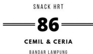
Gambar 2.7 Logo baru

Berdasarkan perbincangan dengan pemilik, pemilik menginginkan adanya pembuatan ulang logo untuk umkmnya, sehingga saya dapat membantu pemilik dalam pembuatan ulang logo dan e-marketing. Saat pembuatan logo, saya meminta pendapat dari pemilik dan membahas bentuk ataupun desain untuk logo baru umkm.