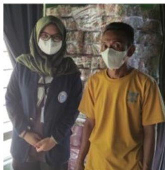
Gambar 2.4 Meminta izin

Saat saya berkunjung dan berbincang dengan pemilik umkm, ternyata umkm Popcorn ini kurang memanfaatkan e-marketing. Setelah berbincang saya diajak untuk melihat proses produksi popcorn dan pengemasannya.