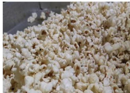
Gambar 2.5 Hasil jadi popcorn asin