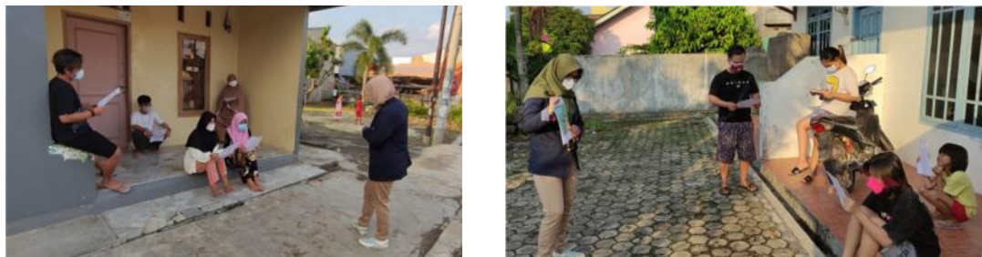
Gambar 2.14 Sosialisasi Covid-19

Dengan meningkatnya kasus Covid-19 yang ada di Bandar Lampung, khususnya di Desa Sepang Jaya, maka saya memutuskan untuk melakukan sosialisasi Covid-19. Kegiatan ini dilakukan untuk mengajak masyarakat agar disiplin protokol kesehatan. Sosialisasi dilakukan secara door to door agar lebih efektif dan efisien dibandingkan harus mengumpulkan masyarakat disatu tempat karena akan menyebabkan kerumunan. Media selebaran yang digunakan berisikan ajakan untuk tetap dirumah dan pentingnya penggunaan masker dimasa pandemi ini.