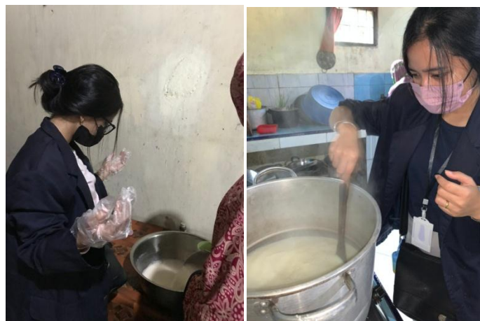
Gambar 2.1 Membantu produksi UMKM