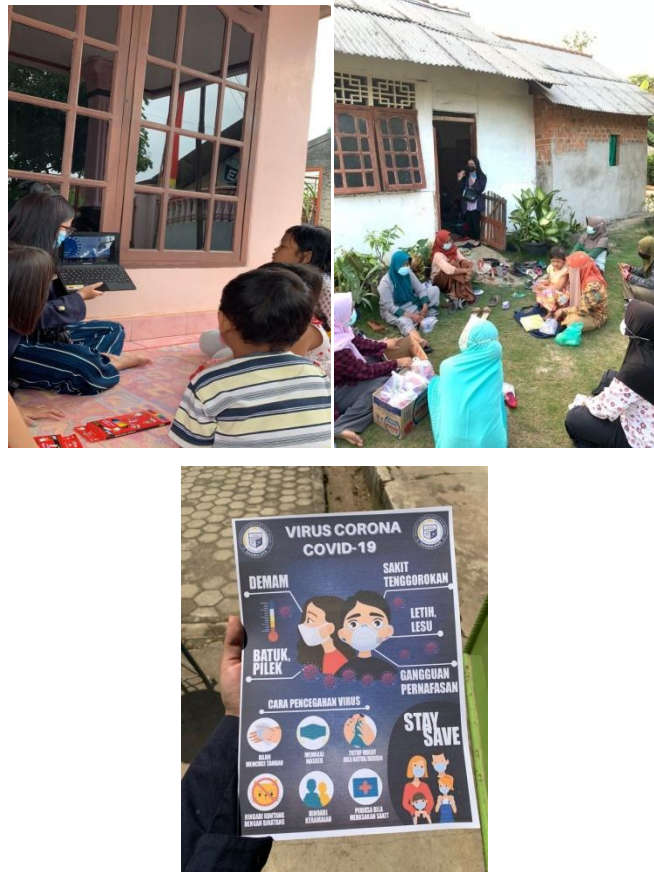
Gambar 2.5 Sosialisasi COVID-19