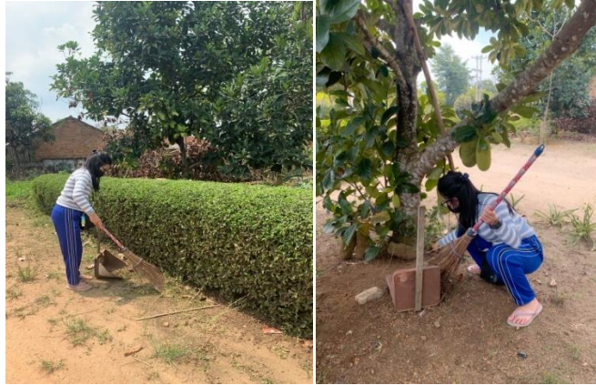
Gambar 2.6 Jumat bersih