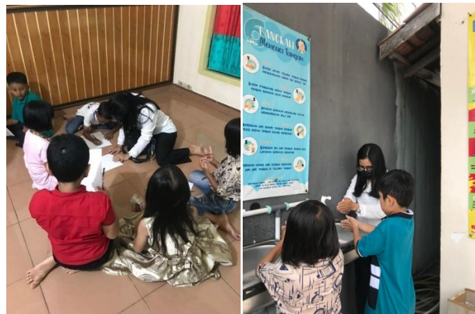
Gambar 2.2 Pendampingan belajar dan edukasi cuci tangan siswa SD

Setelah melakukan pendampingan belajar , anak anak diberikan edukasi bagaimana mencuci tangan yang baik dan benar , karena lain hal nya pada masa remaja , kanak kanak lebih mudah menggunakan tangan mereka untuk memegang dan menyentuh apapun yang ada didepan mereka tanpa memikirkan bakteri yang ada . Maka dari itu di lakukan edukasi tersebut guna meningkatkan pengetahuan menjaga diri dari bakteri yang ada pada tangan .