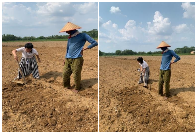
Gambar 2.7 Penanaman TOGA

Masyarakat desa Poncowati sebagian besar bermata pencaharian sebagai petani/perkebunan sehingga tidak asing lagi , jika banyak masyarakat yang melakukan TOGA . TOGA adalah tanaman obat keluarga ,tanaman obat ini merupakan jenis-jenis tanaman yang memiliki fungsi dan khasiat sebagai obat dan dapat dimanfaatkan juga sebagai peluang usaha . TOGA sangat baik dilakukan pada masa sekarang ini , mengingat COVID-19 sangat mudah masuk pada tubuh yang daya tahan nya rendah . Maka dari itu dengan dilakukan penanaman obat ,diharapkan memberikan dampak hal positif bagi kesehatan. TOGA yang dilakukan di desa Poncowati terdiri dari jahe , kunyit, kencur ,temulawaak ,lengkuas dan lempuyang .