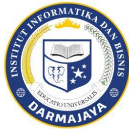
Gambar 1.4.1 Institut Informatika dan Bisnis Darmajaya

Institut Informatika dan Bisnis Darmajaya merupakan lembaga pendidikan tingkat universitas atau perguruan tinggi yang bertindak selaku institusi yang menaungi mahasiswa dalam Praktik Kerja Pengabdian Masyarakat (PKPM) tahun 2021. IIB DARMAJAYA berlokasi di Jl. ZA Pagar Alam No.93 Kecamatan Rajabasa ,Kota Bandar Lampung .