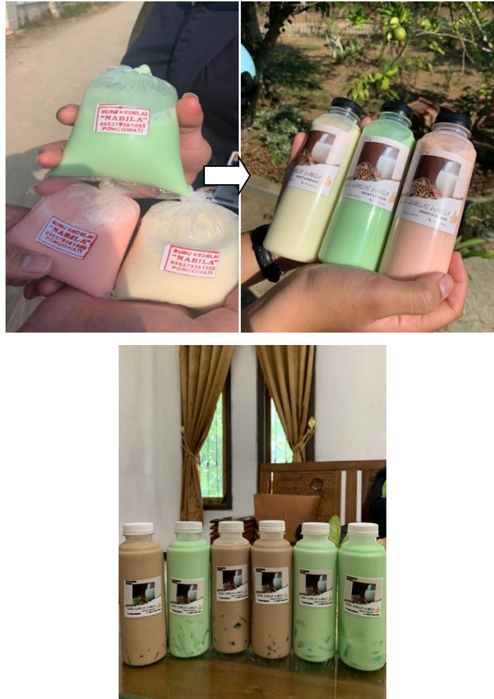
Gambar 2.4 Inovasi produk dan design