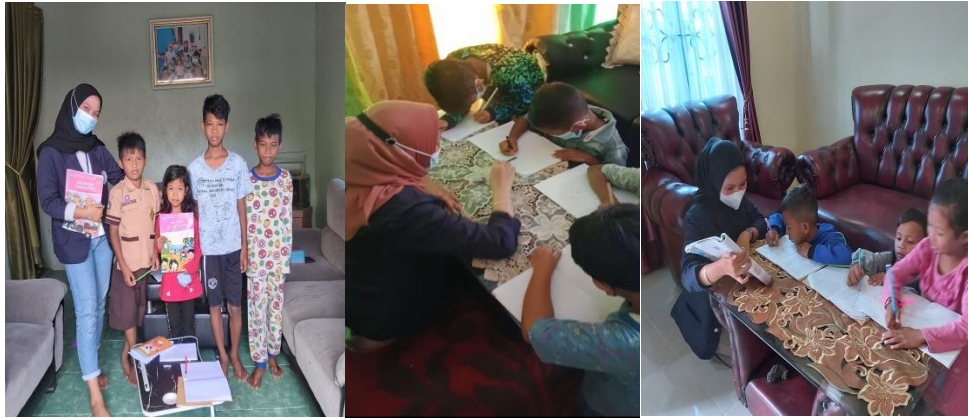
Gambar 2. 9 Melakukan kegiatan pendampingan belajar kepada adik-adik Sekolah Dasar