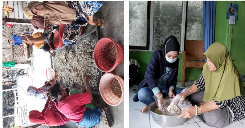
Gambar 2. 1 Penyortiran dan Pembuatan Olahan Stick Teri

Berikut ini, proses pembuatan stick teri yang berbahan dasar ikan teri dari penyortiran ikan teri hingga menjadi olahan stick teri.