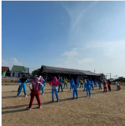
Gambar 2. 11 Ikut serta senam pagi bersama ibu-ibu warga Pulau Pasaran

Melatih daya tahan tubuh agar tetap sehat dan melatih daya ingat ibu-ibu dalam mengingat gerakan-gerakan senam yang diberikan, ibu-ibu merasa senang serta badan menjadi lebih sehat.