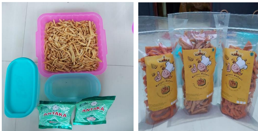
Gambar 2.5 Melakukan kegiatan inovasi baru pada produk olahan ikan teri dengan menambahkan varian rasa pada produk stick teri

Inovasi adalah proses atau hasil pengembangan pemanfaatan mobilisasi pengetahuan, keterampilan untuk menciptakan atau memperbaiki produk (barang/jasa). Melakukan inovasi pada bisnis juga merupakan salah satu strategi untuk menaikkan omset. Inovasi yang dimaksud ini yaitu menambahkan varian rasa pada produk stick teri dengan rasa yang kekinian.