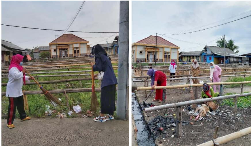
Gambar 2. 12 Ikut serta gotong-royong Bersama warga Pulau Pasaran