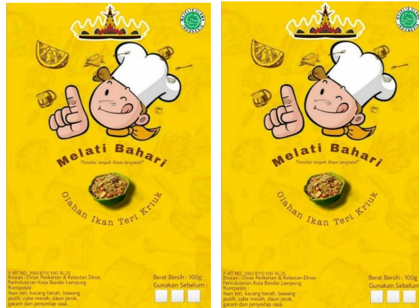
Gambar 2. 6 Membuat desain kemasan pada produk olahan ikan teri