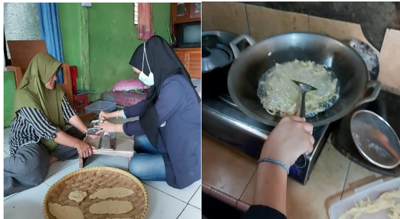
Gambar 2. 2 Mencetak Adonan dan Penggorengan Stick Teri