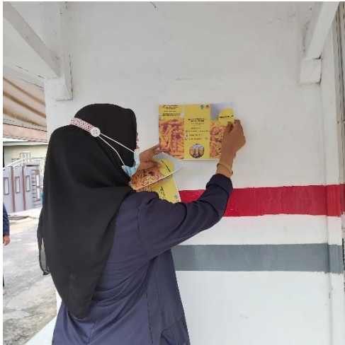
Gambar 7 Inovasi produk Stick Teri yaitu varian rasa baru