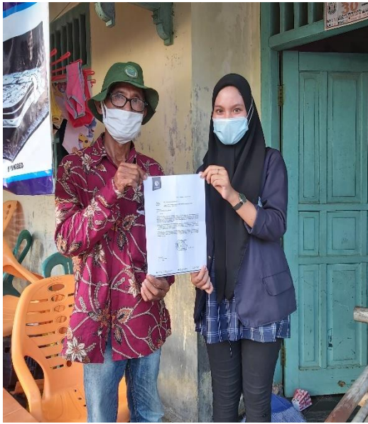
Gambar 1 Permohonan Izin kepada Ketua RT 09 dan pemilik UMKM Melati Bahari