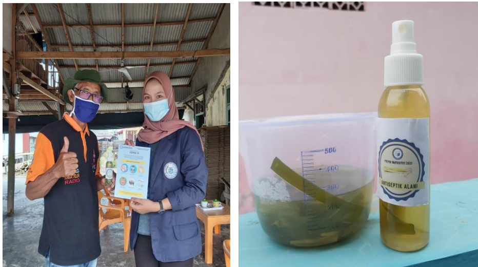
Gambar 2. 10 Melakukan kegiatan pembagian pamflet dan hand sanitizier kepada warga setempat

Agar masyarakat dipulau pasaran tetap menjaga kesehatan ditengah pandemi covid-19. Dengan adanya pembagian pamflet masyarakat di Pulau Pasaran menjadi taat pada protokol kesehatan.