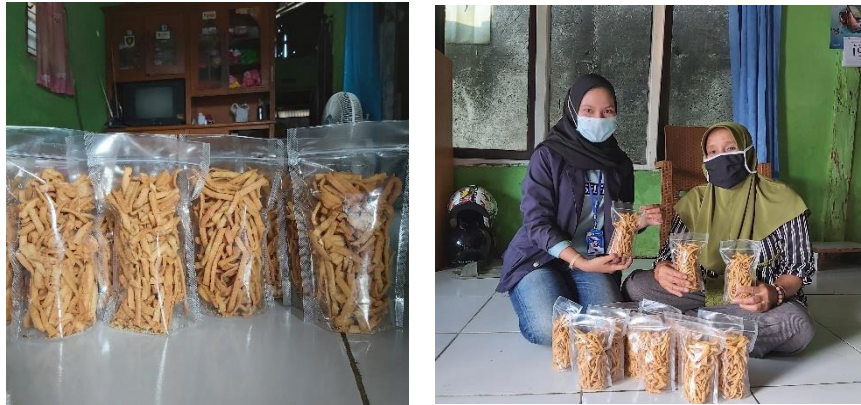
Gambar 2. 3 Pengemasan Produk Stick Teri