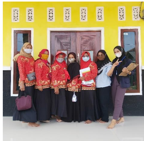
Gambar 16 Kunjungan ke kediaman Ibu Um sebagai salah satu pengrajin rajut di Pulau Pasaran