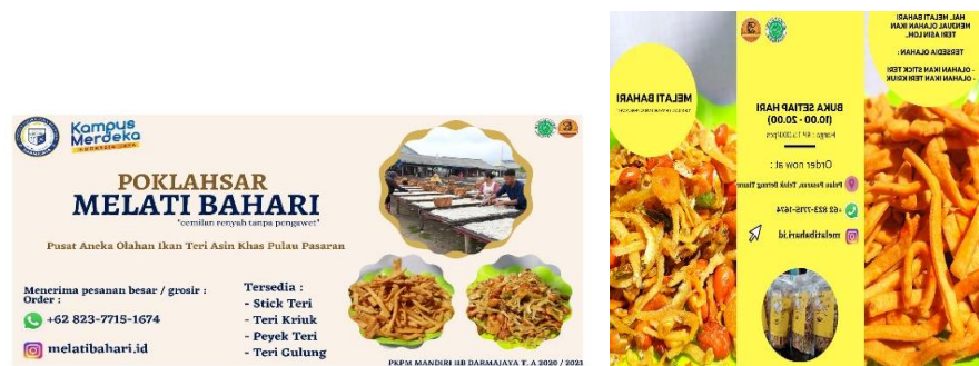
Gambar 2. 7 Melakukan kegiatan membuat banner dan brosur

Banner dan Brosur adalah sarana media promosi, banner merupakan media pemasaran yang berisi publikasi, iklan, dan promosi. Sedangkan, brosur dalam bentuk lembaran kertas yang berisi kata-kata dan informasi tentang suatu produk, dan beberapa gambar pendukung. Kita dapat menggunakan banner dan brosur untuk mempromosikan produk UMKM, selain itu menggunakan banner dan brosur juga akan mendapatkan keuntungan lebih banyak, karena secara tidak langsung menarik perhatian lebih banyak orang ketika melihatnya dan dapat memperluas target pasar UMKM Melati Bahari.