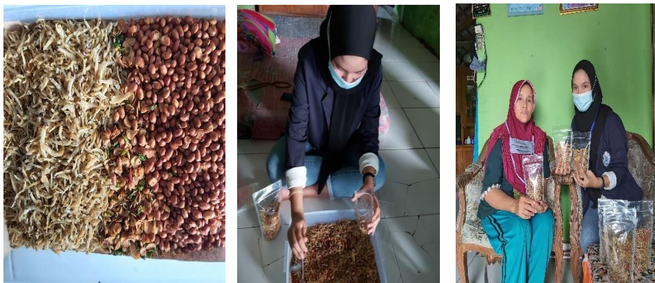
Gambar 2. 4 Membantu Pembuatan Produk Olahan Teri Kriuk

Pengembangan usaha yang dimaksud yaitu menciptakan produk baru atau olahan baru yang tetap menggunakan bahan dasar ikan teri sebagai ciri khas dari cemilan UMKM Melati Bahari. Tujuan pengembangan produk adalah untuk memberikan nilai maksimal bagi konsumen, memenangkan persaingan usaha dengan memilih produk yang inovatif. Dengan penambahan produk baru ini diharapkan dapat meningkatkan penjualan UMKM Melati Bahari.