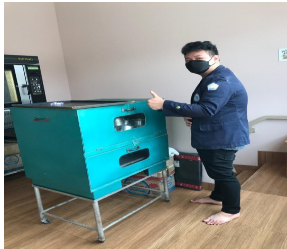
Gambar 2. Survey Lokasi PKPM