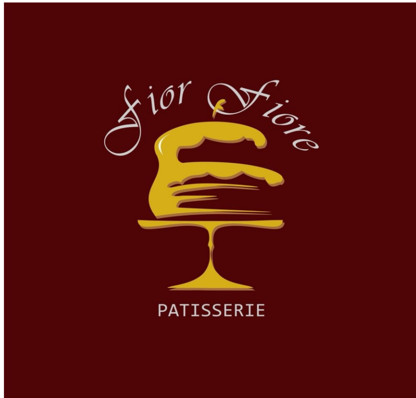
Gambar Logo Toko Kue Fiorfiore