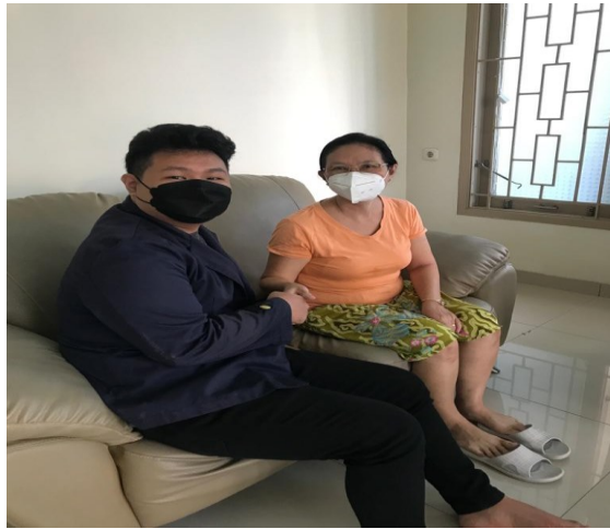
Gambar 1. Perkenalan dengan pemilik UMKM

Memperkenalkan diri dan meminta izin kepada pemilik UMKM untuk melaksanakan kegiatan PKPM selama 1 bulan.