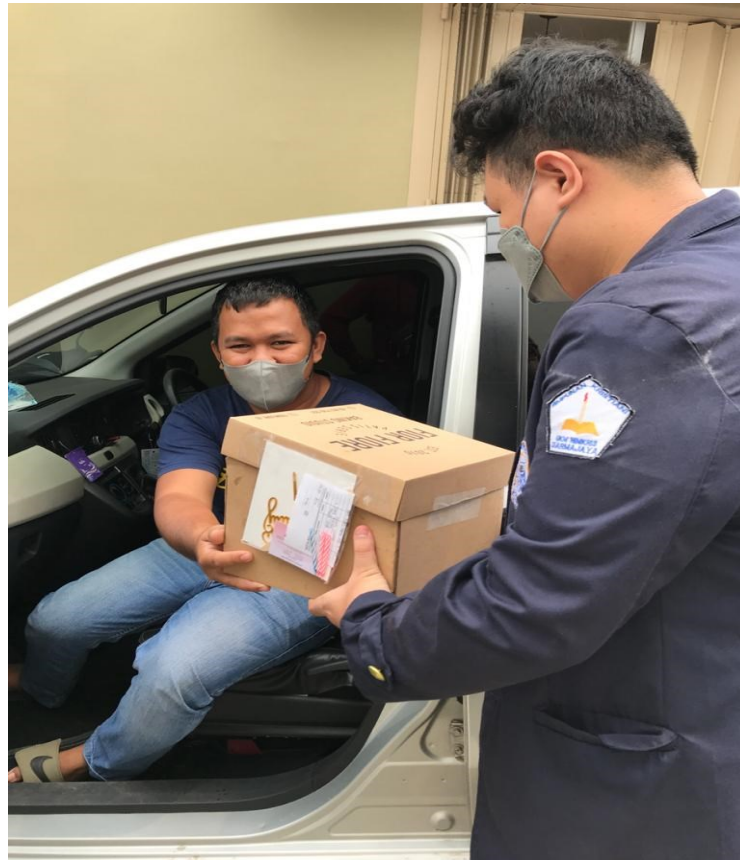
Gambar 5. Melayani pelanggan dan melakukan pembayaran