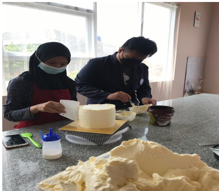
Gambar 4. Proses menghias kue