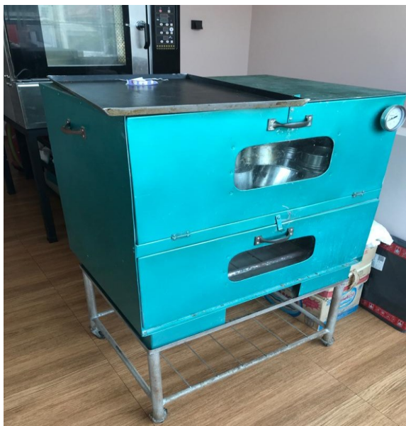
Gambar Oven yang digunakan