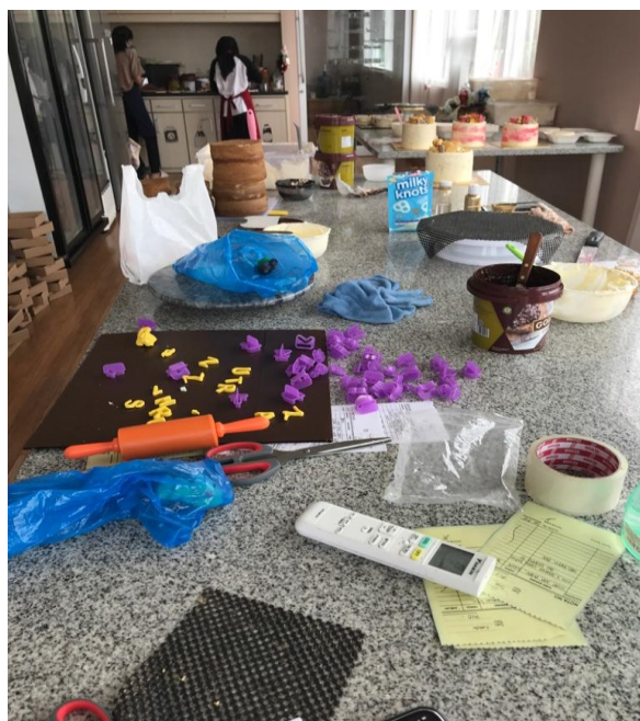
Gambar Suasana toko