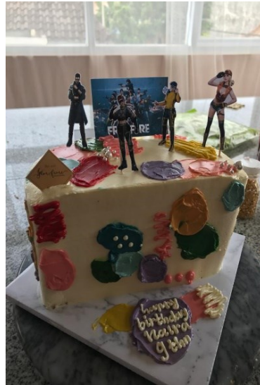
Gambar contoh produk