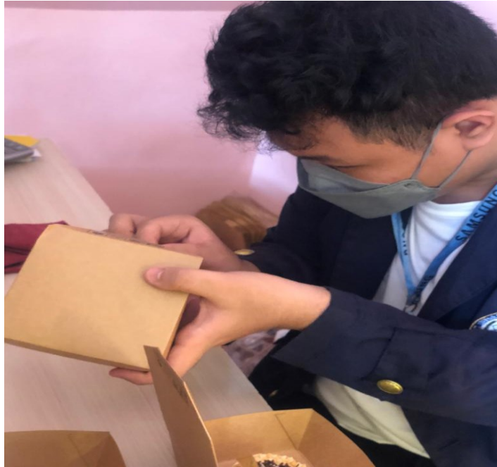
Gambar 3. Proses packing kue

Membantu kegiatan sehari-hari di toko seperti kasir, pembuatan kue, menghias kue dan membuat kartu nama toko.