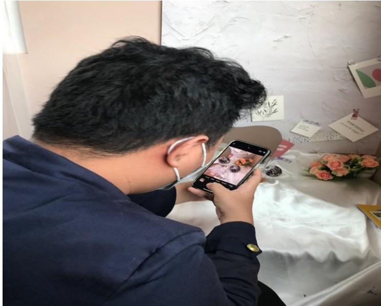
Gambar proses memfoto produk