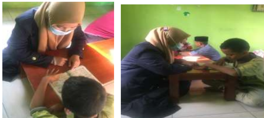
Gambar 5 Program Mengajar ngaji TPA

Dari program ini hasil yang didapat antusiasme anak-anak dalam semangat untuk mengaji dan semangat dalam memperdalam ilmu agama.