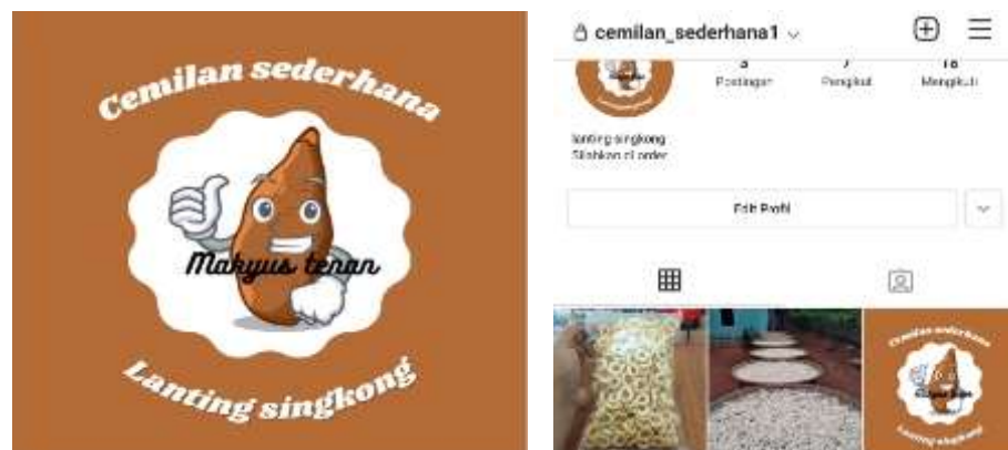
Gambar 3 Program berkunjung ke UMKM lanting

Hasil dari program kunjungan ini berhasil membuatkan logo dan membuatkan Akun Instagram. Tujuan membuatkan logo ini agar produk UMKM ini mempunyai ciri khas tersendiri. Sedangkan membuatkan akun instagram ini untuk memudahkan pemilik UMKM mempromosikan produk yang mereka jual.