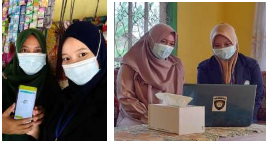
Gambar 4 Program Berkunjung ke UMKM warung kecil

Program berkunjung ke UMKM warung kecil ini berhasil membuat pemilik usaha warung kecil ini mengerti tentang pembukuan sederhana dan mengenal aplikasi pembukuan “Buku Kas”