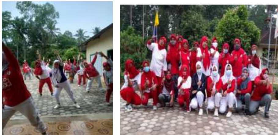
Gambar 8 Program senam bersama ibu-ibu

Hasil dari kegiatan ini adalah menambah aktifitas ibu-ibu sekitar untuk meningkatkan kesehatan dan kebugaran sehingga di jauhkan segala penyakit.