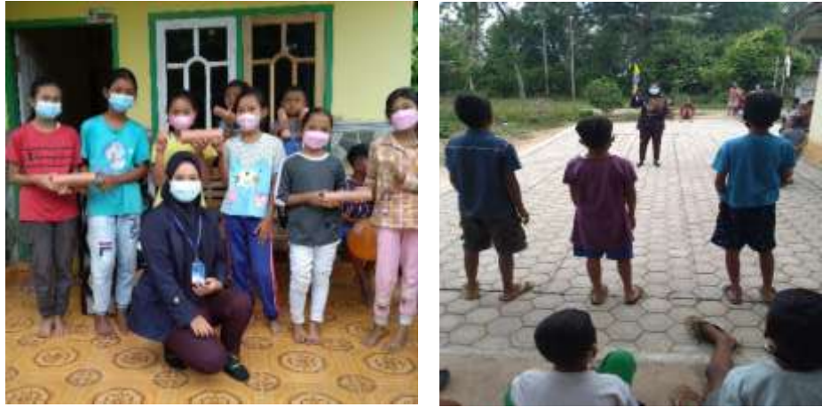
Gambar 7 Program mejadi panitia 17 Agustus