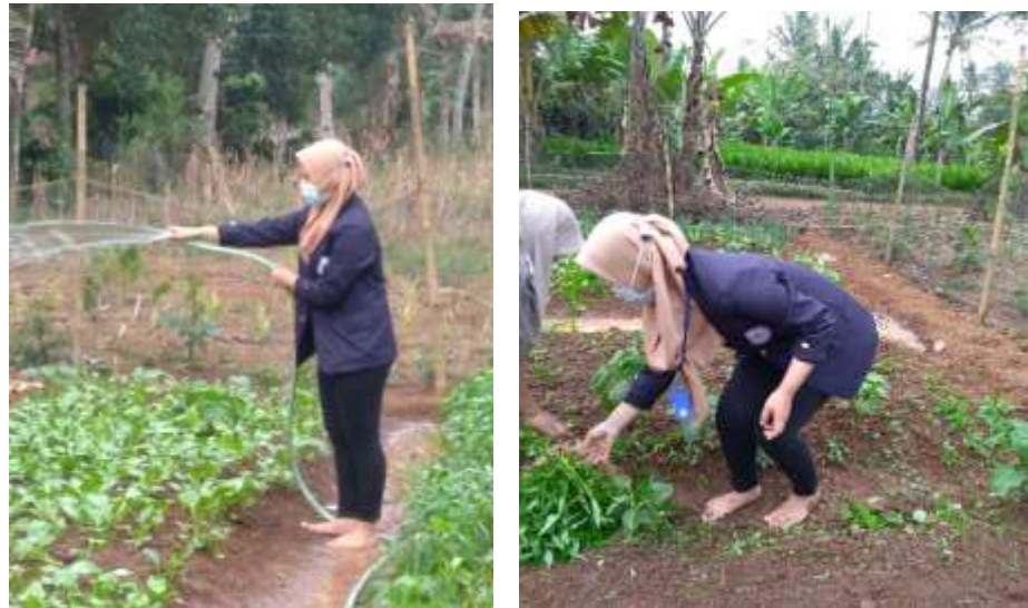
Gambar 6 Program membantu ibu-ibu KWT

Hasil yang didapat dari program ini adalah membantu meringankan ibu-ibu KWT dalam kegiatan menanam, menyirami dan memanen sayur-sayuran. Serta membantu menjualkan sayur-sayurannya.