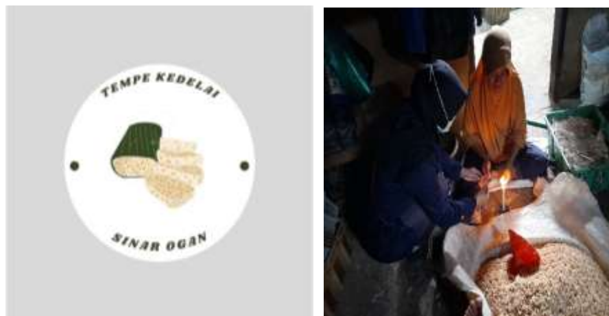
Gambar 1 Program berkunjung ke UMKM Tempe

Program berkunjung ke UMKM Tempe yang saya lakukan ini untuk meningkatkan kreatifitas pemilik UMKM Tempe yang mana pemilik UMKM ini hanya tau cara membuat tempe tetapi mereka tidak tau teknologi digital sekarang. Hasil dari kegiatan ini adalah pemilik UMKM tempe ini jadi tau bagaimana cara menggunakan media sosial untuk media promosi. Selain itu, saya berhasil membuatkan logo. Yang bertujuan untuk UMKM tempe ini mempunyai ciri khas tersendiri.