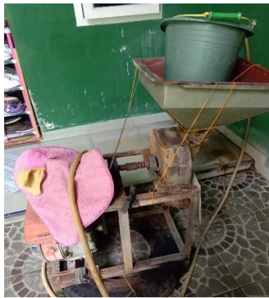
Gambar alat dan bahan pembuatan tempe