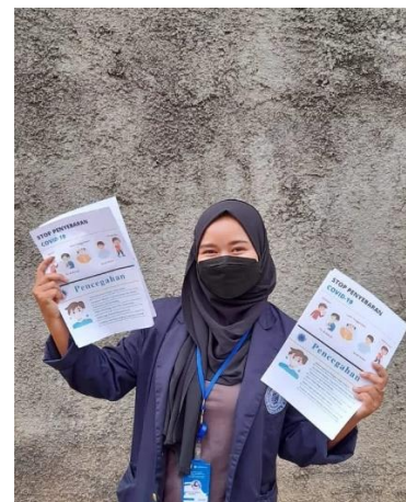
Gambar 2.3.7 sosialisasi covid-19