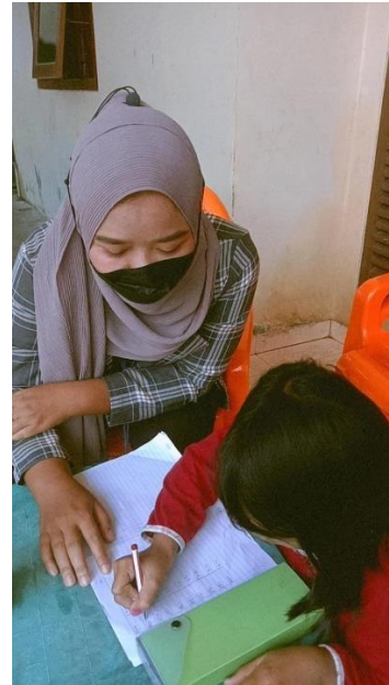
Gambar 2.3.7 pendampingan belajar anak SD Gunung Sulah