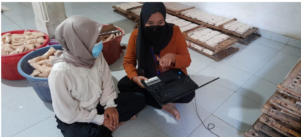
Gambar pengarahan bisnis online