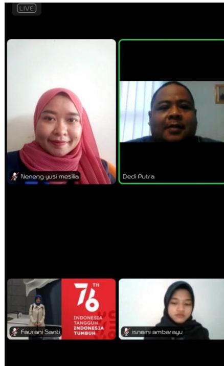
Pelepasan PKPM 2021 secara online