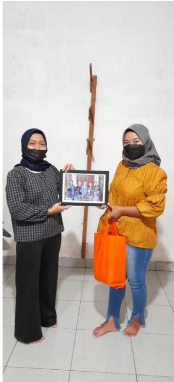
Gambar 2.3.9 penyerahan cendra mata