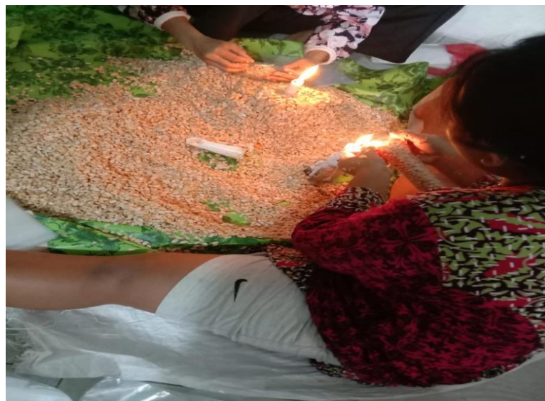
Gambar proses pengemasan tempe