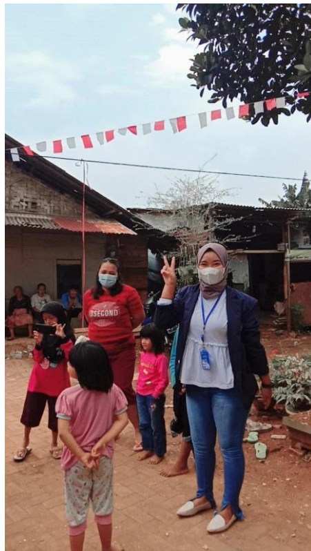
Gambar 2.3.8 kegiatan 17 Agustus

Program ini bertujuan untuk memperingati jasa para pahlawan yang telah gugur mendahului kita demi kemerdekaan Indonesia, memperingati 17 Agustus adalah salah satu sikap cinta tanah air. Dan program ini dilaksanakan bersama dengan warga sekitar Gunung Sulah, khususnya anak-anak dan ibu-ibu di sekitar desa Gunung Sulah.