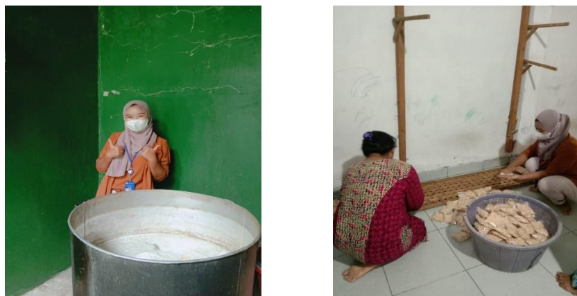
Gambar 2.3.2 cara pembuatan hingga pengemasan

Kegiatan pengabdian di tempat PKPM yaitu membantu melakukan kegiatan produksi pengolahan tempe dari pengenalan bahan hingga cara pengemasan tempe. Upaya pengembangan potensi dan meningkatkan daya pangs pasar UMKM pada masa pandemic covid-19