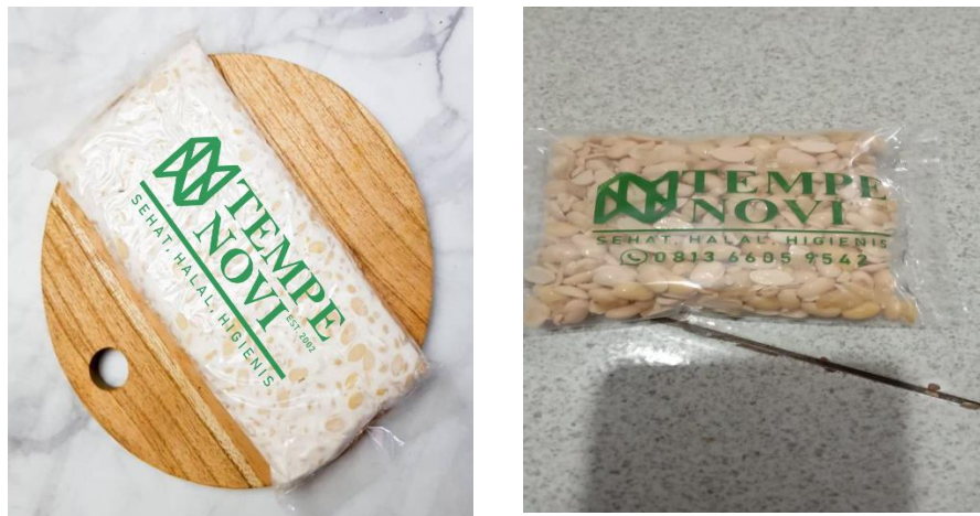
Gambar 2.3.3. logo pada plastik tempe Novi

Memberikan inovasi alat dan bahan kepada pemilik UMKM tempe, yaitu dengan memberikan inovasi merek pada plastik yang sebelumnya tidak memiliki logo. Pemberian logo atau merek dilakukan agar menarik perhatian masyarakat dan meningkatkan daya pangsa pasar agar menjadi lebih luas dari sebelumnya. Pemberian logo dan merek juga menjadi sebuah identitas baru yang akan menjadi daya tarik tersendiri bagi masyarakat yang akan membeli produk tempe Pak Novi. Dengan adanya logo masyarakat akan lebih mudah untuk mengenal tempe yang dipasarkan dan memiliki keunikan tersendiri dengan adanya logo atau merk yang diberikan. Dana yang di habiskan dalam pembuatan logo tersebut adalah Rp. 80.000-, dengan nilai 200 pc plastik.