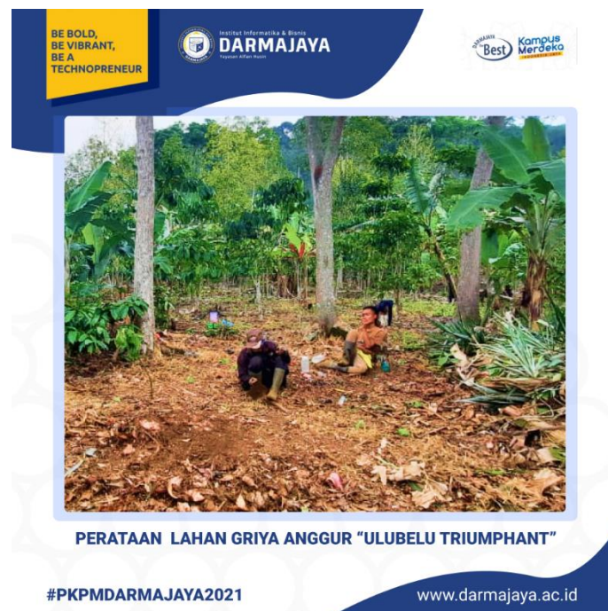
Gambar 1. Pembuatan Rumah Packhing Panaa Hidroponik