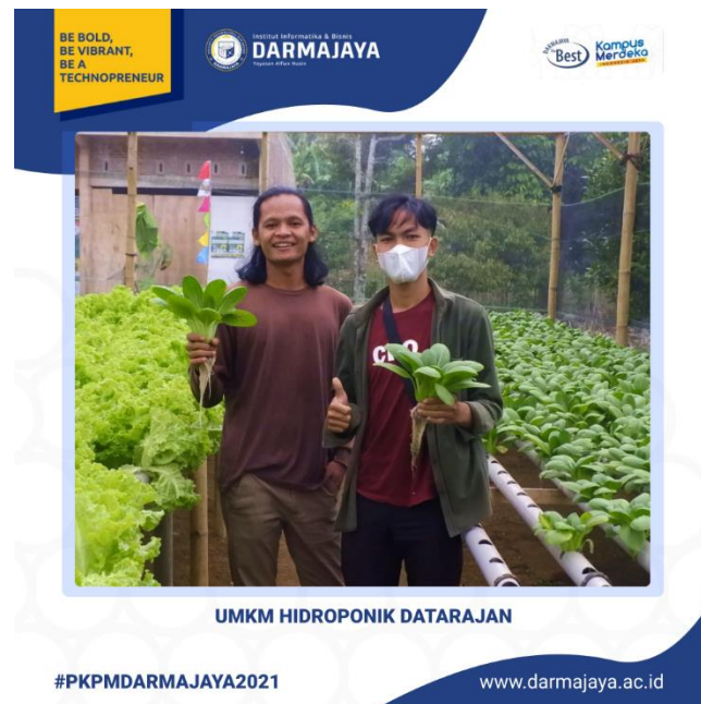
Gambar 4. Penyortiran Sayuran

4. Penyortiran sayuran dilihat pada Gambar 4.