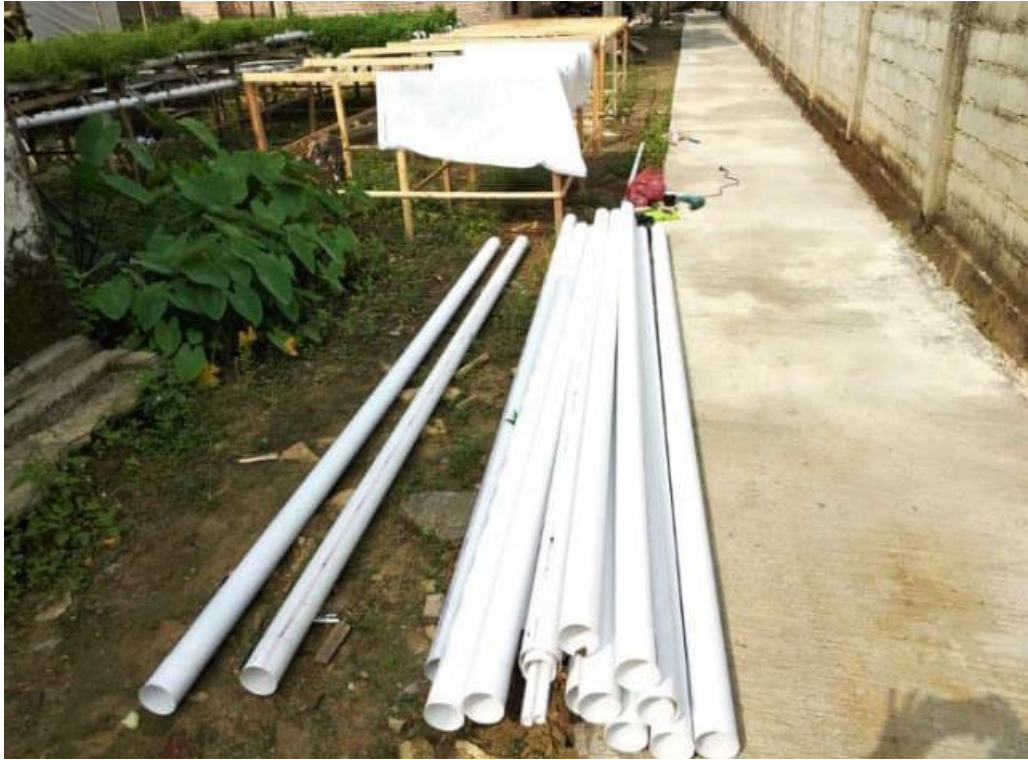
Gambar 5. Alat dan Bahan Instalasi Media Tanam Hidroponik