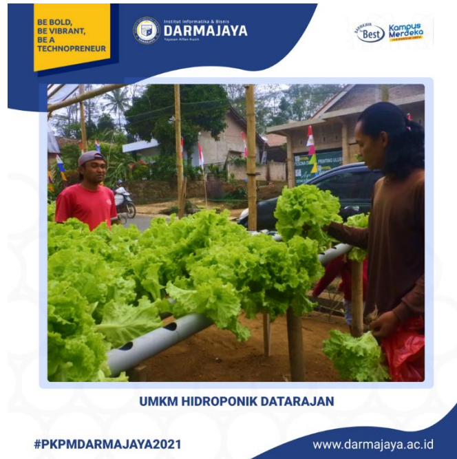
Gambar 2. Pemanenan Sayuran yang telah di Upload pada Sosial Media Pihak Mahasiswa