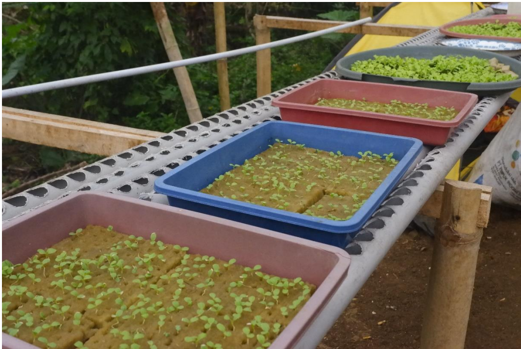
Gambar 6. Proses Penyemaian Pokcoy dengan Rokwoll