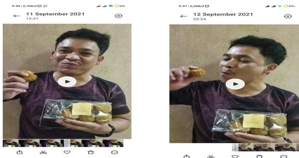
Gambar 2.4 Membuat Vidio Testimoni produk dari konsumen

Media sosial bisa digunakan untuk menunjang strategi marketing bisnis anda. Internet memberikan berbagai dampak positif terhadap perkembangan ekonomi masyarakat, karena banyak sekali pelaku usaha yang telah memanfaatkan teknologi untuk mempromosikan cita rasa yang didapatkan konsumen.