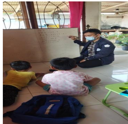
Gambar 2.6 Membantu adik-adik dalam belajar matematika dan bahasa indonesia.