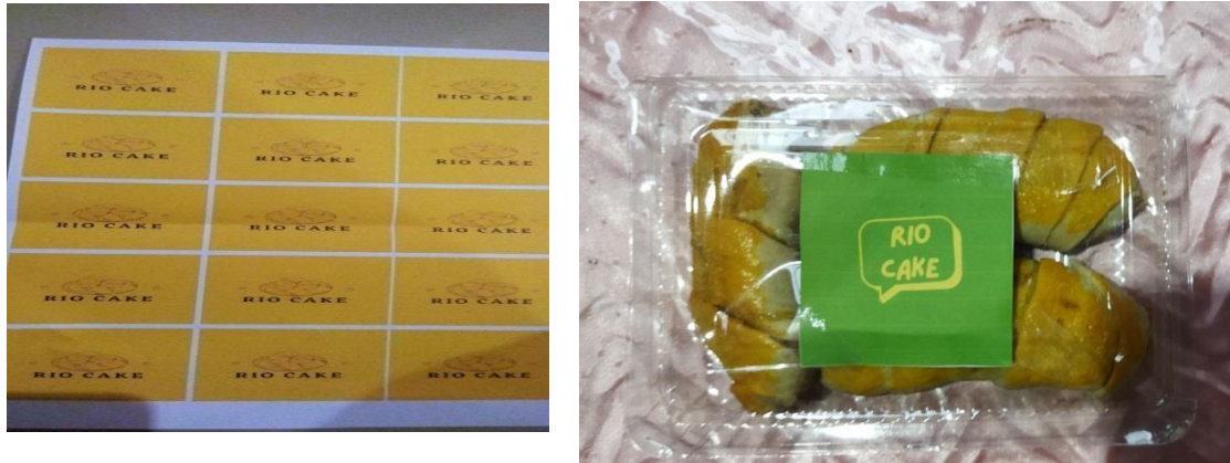
Gambar 2.2 Pembuatan Logo atau Merk& Packaging pada kemasan Kue Rumahan