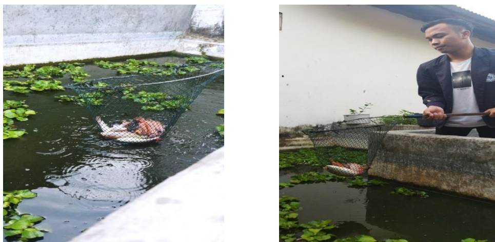
Gambar 2.7 Kegiatan Budidaya Ikan Nila

Dihari kamis saya diajak oleh tetangga saya yaitu Ibu Sari untuk membantu kegiatan dalam membudidayakan ikan nila yang di keelola di halaman rumahnya. Kegiatan tersebut diisi dari mulai pemeliharaan ikan dan kolam serta sampai pamanenan ikan yang sudah siap untuk dipanen.