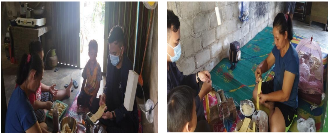
Gambar 2.1 Proses pembuatan kue rumahan

Kue rumahan umumnya terdiri dari dua jenis yaitu kue kering dan kue basah. Kedua jenis kue ini memiliki prospek yang sama cerahnya. Kue yang sekarang dibuat adalah kue basah yaitu kue Bolen yaitu kue yang berbahan dasar pisang