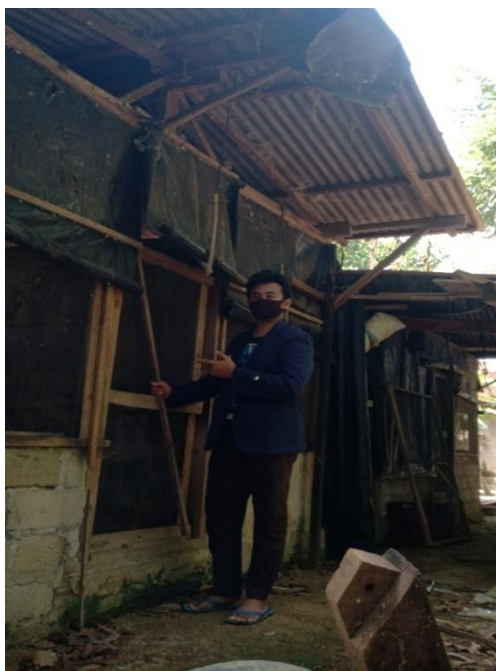
Gambar 3 : Kunjungan ke Lokasi di Sekitar Lingkungan.