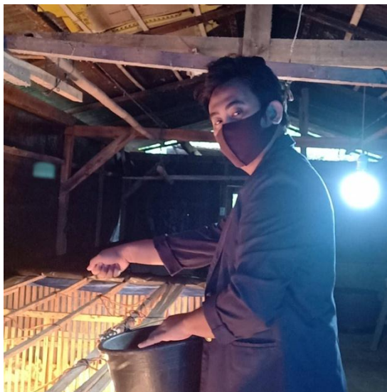
Gambar 7 : Proses Pemberian Pakan.