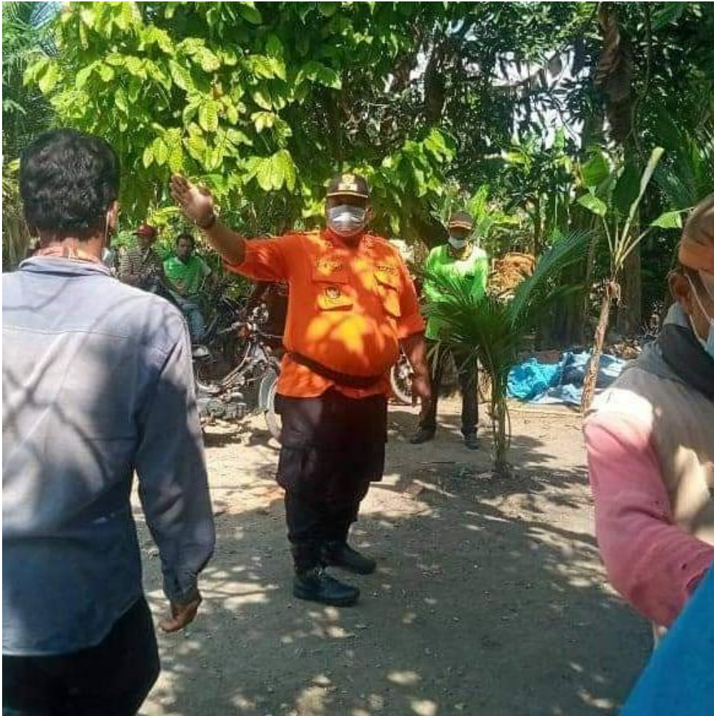
Gambar 12 : Proses Sosialisasi COVID-19.