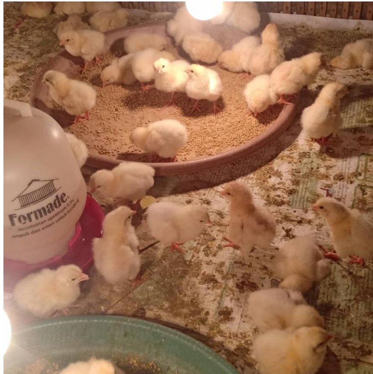
Gambar 8 : Kondisi ayam saat pemberian pakan.