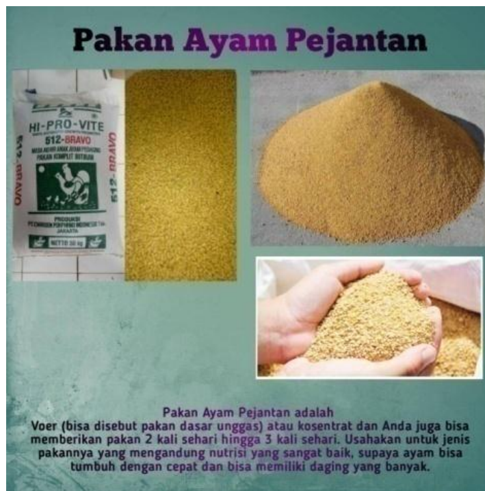
Gambar 2.3.8 : Gambar jenis-jenis pakan ayam pejantan. Jenis-jenis pakan ayam pejantan yaitu Konsentrat, Bekatul, dan Jagung.