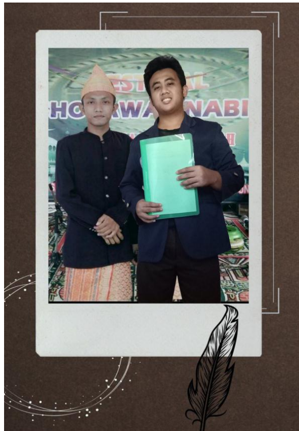
Gambar 1 : Proses Perizinan Yang Tertuju Kepada Perangkat Desa Setempat Dalam Rangka Untuk Melaksanakan PKPM Mandiri 2021.