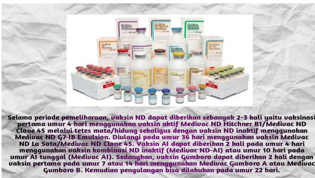
Gambar 13 : Jenis-Jenis Vaksin Yang Digunakan.