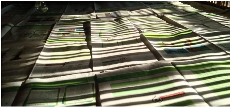
Gambar 6 : Proses Pemasangan Sekam Padi dan Koran Untuk Alas Ayam Pejantan.