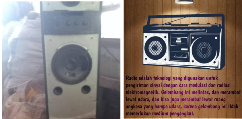
Gambar 2.3.4 & 2.3.5 : Gambar Radio Untuk media suara.

Prosesi Broding bertujuan untuk membuat bibit ayam merasakan kondisi tempat yang baru tetapi dengan keadaan suhu yang sama dengan saat berada di eraman induknya.