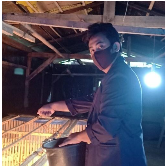
Gambar : 2.3.2 : Gambar ketika meberika pakan ayam.

Program ini bertujuan untuk membantu pemilik UMKM untuk mengenal media aplikasi untuk memudahkan pekerjaan sebagai pelaku UMKM di saat membuat pembukuan tentang usahanya. Dan bagi mahasiswa bertujuan untuk belajar mengenal dunia pekerjaan dan bisa memahami tentang sistematis suatu pekerjaan di dunia luar.