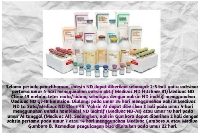
Gambar 2.3.9 : Gambar jenis-jenis vaksin untuk ayam pejantan.

Jenis-jenis vaksin untuk ayam pejantan yaitu Vaksin ND, AI, IB, dan korista. Dan cara penyalurannya yaitu