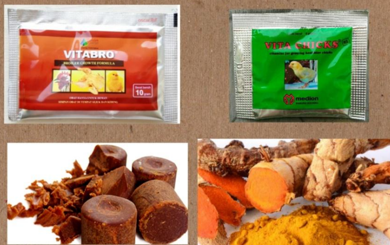
Gambar 15 : Jenis-Jenis Suplemen Yang Digunakan.