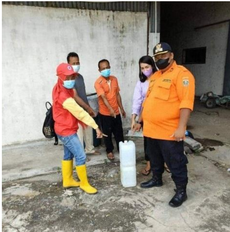
Gambar 11 : Penyaluran Bantuan Disinfektan.