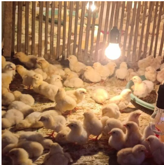
Gambar 2.3.3 : Gambar ketika sedang prosesi Broding.

Gambar ini ketika proses pemberian pakan konsentrat polos untuk bibit ayam pejantan.