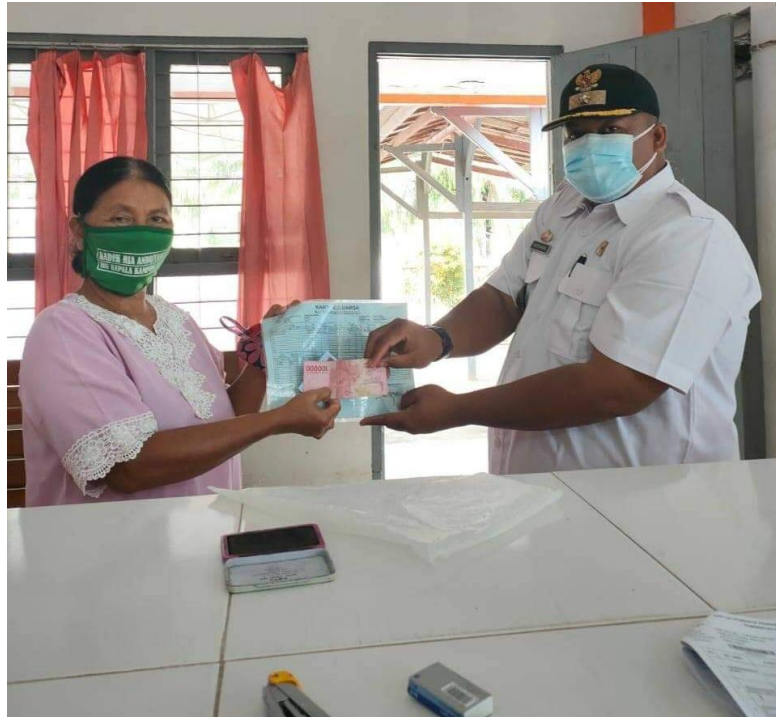
Gambar 10 : Proses Pencairan Bantuan Langsung Tunai (BLT).