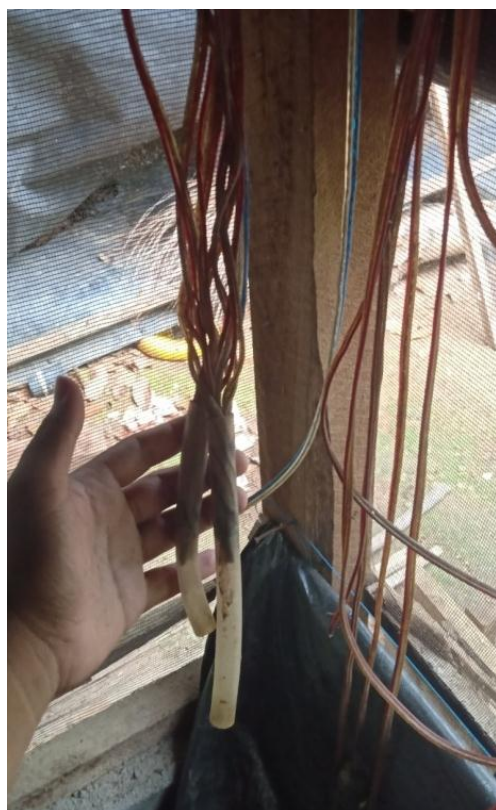
Gambar 4 : Proses Membuat Rangkaian Kabel dan Lampu Bohlam.