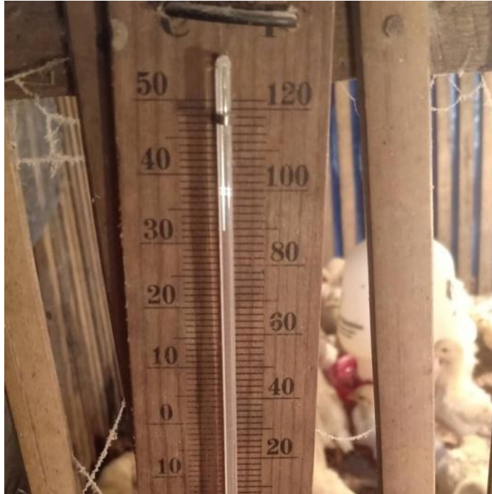
Gambar 2.3.7 : Gambar Termometer untuk media pengatur suhu. Termometer digunakan untuk pengecekan suhu kandang agar tetap stabil.