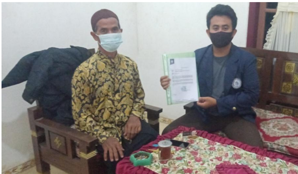
Gambar 2 : Proses Perizinan Dengan Pemilik UMKM Yang Akan Dilakukannya PKPM.