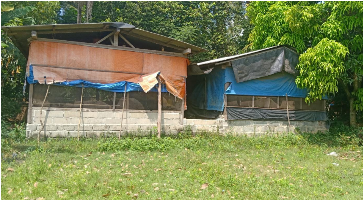
Gambar 9 : Kondisi Kandang.