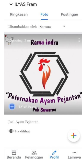
Gambar 2.3.1 : Gambar profil akun Google Bisnisku.

Google Bisnisku Adalah Merupakan sebuah fitur gratis yang sangat mudah digunakan untuk para pelaku bisnis. Tujuan ialah mengelola kehadiran bisnis mereka dalam portal Google serta Maps. Fitur tersebut memungkinkan sebuah bidang usaha agar lebih dikenal publik. Manfaat Google Bisnisku Bagi Pelaku Usaha adalah mudahan mengelola informasi. Sebuah bisnis yang memverifikasi informasinya melalui Google dapat dianggap memiliki reputasi yang baik dan terpercaya oleh para pelanggan. Manfaat lain yang tak kalah penting ialah kemudahan berinteraksi dengan para pelanggan. Fungsi Google Bisnisku adalah dapat memunculkan bisnis ke Google Bisnisku dan dapat menyediakan informasi yang lengkap.