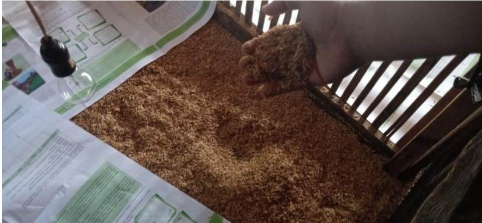
Gambar 5: Proses Pemasangan Sekam Padi dan Koran Untuk Alas Ayam Pejantan.