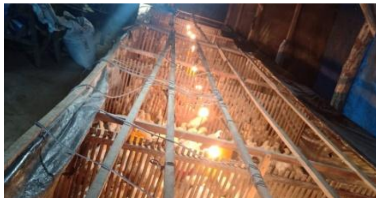
Gambar 2.3.10 : Gambar kondisi ayam dalam kandang. kondisi ayam dalam kandang yang masih membutuhkan lampu bohlam.