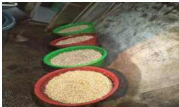
Pengisian Kedelai Kedalam Plastik