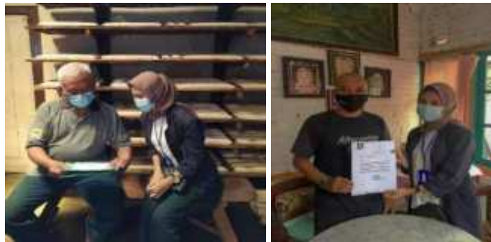
Penyerah Surat Izin Kepada Lurah,Rt,dan Pemilik UMKM