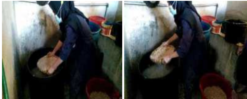
Pemberian Air Ragi

Pembersihan kedelai setelah di giling dan di buang dari ampas kulitnya