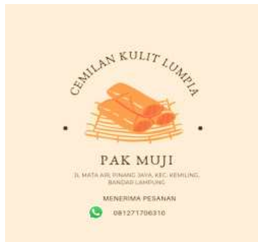
Gambar 2.3.2.10 Pembuatan logo untuk umkm kulit lumpia