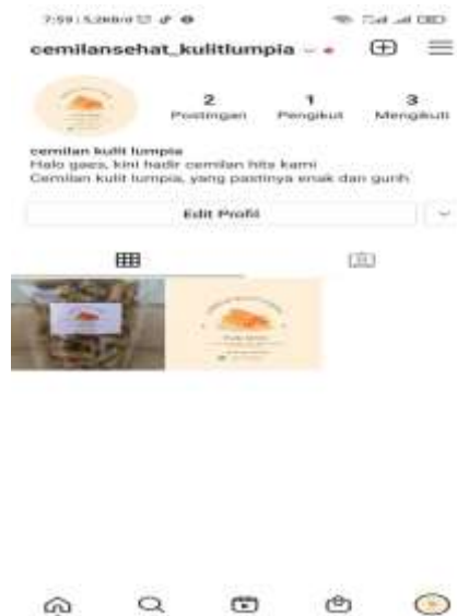
Gambar 2.3.2.12 Pembuatan akun Instagram untuk umkm kulit lumpia