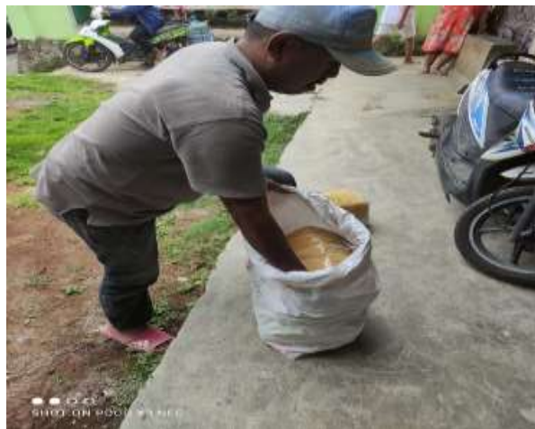
Gambar 2.3.2.4 Proses pengiriman pesanan kulit lumpia