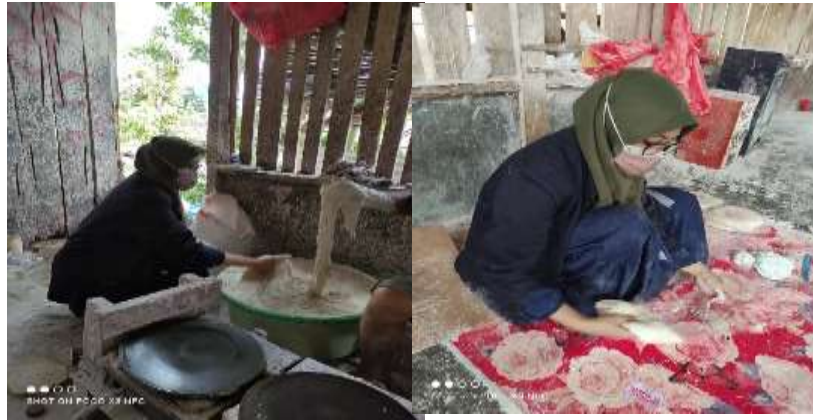
Gambar 2.3.2.3 Proses pembuatan kulit lumpia