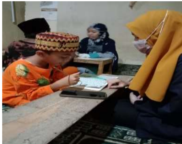
Gambar 2.3.2.14 Mengajarkan mengaji anak-anak di TPA