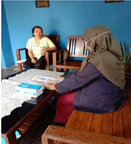
Gambar 2.3.2.9 Sosialisasi tentang pencegahan covid-19 pada warga