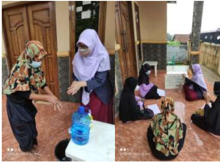
Gambar 2.3.2.5 Edukasi Pencegahan covid-19 pada anak SD dan SMP