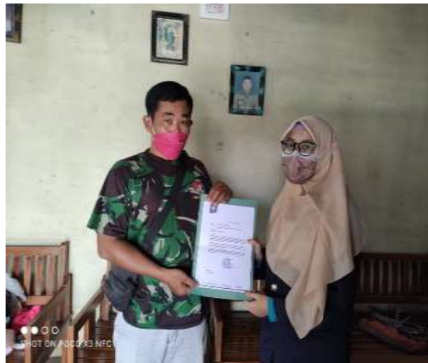
Gambar 2.3.2.2 Dokumentasi bersama pemilik umkm kulit lumpia