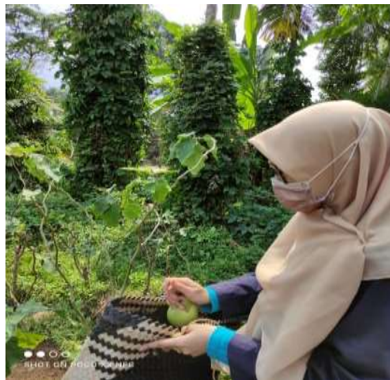
Gambar 2.3.2.6 Membantu petani dalam memanen sayuran terong