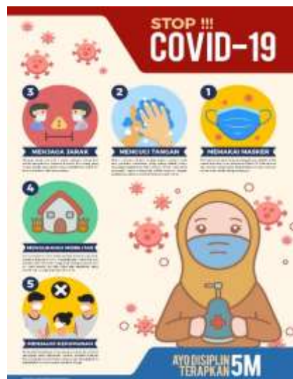
Gambar 2.3.2.8 Pembuatan poster tentang pencegahan covid-19