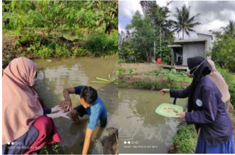
Gambar 2.3.2.11 Membantu dalam budidaya ikan air tawar