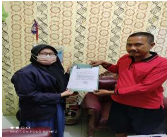
Gambar 2.3.2.1 Dokumentasi bersama ketua RT yang lama