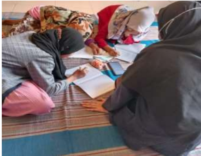
Gambar 2.3.2.7 Pendampingan belajar daring pada anak SD dan SMP