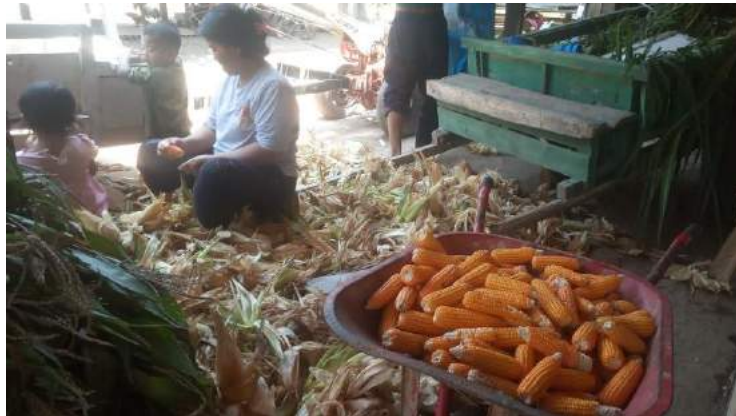
Gambar 2.1 Mengamati kegiatan masyarakat

Pengamatan dilakukan di minggu pertama dalam rangka mengetahui kegiatan sehari-hari masyarakat, yang mayoritas beraktivitas di sawah dan ladang. Pekerjaan seperti buruh bangunan, berjualan dipasar, dan pekerjaan sampingan lainnya hanya untuk mencukupi kebutuhan makan setiap hari nya.