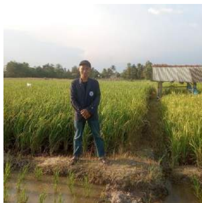
Gambar 3.2 Mengunjungi sawah pertanian milik masyarakat