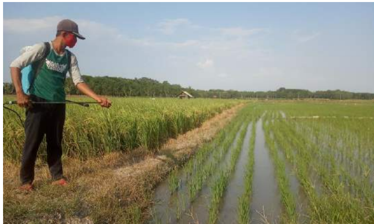
Gambar 2.2 Proses perawatan padi