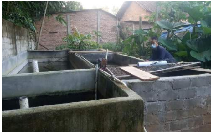
Gambar 2.4 Kunjungan di hari berikutnya