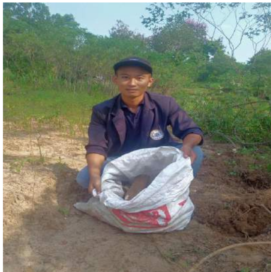
Gambar 2.6 Pengambilan singkong