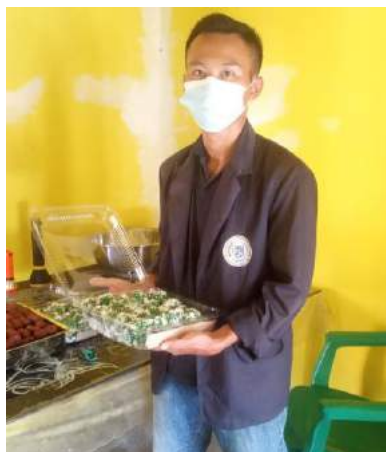
Gambar 3.5 Memasarkan produk