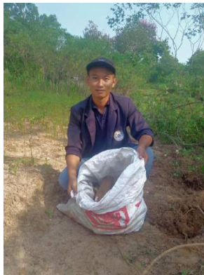
Gambar 3.4 Mengambil hasil panen