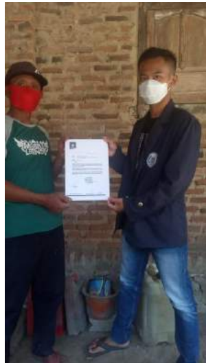
Gambar 3.1 Memberikan surat pengantar PKPM

Adapun yang terlampir disini yaitu bukti aktivasi kegiatan dalam bentuk dokumentasi gunna untuk melengkapi kegiatan Praktek Kerja Kegiatan Masyarakat (PKPM).