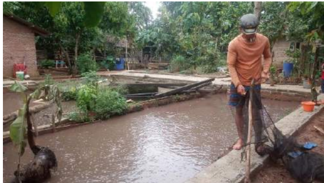
Gambar 2.3 Kunjungan di UMKM ikan lele

Selain bertani beberapa masyarakat juga memiliki usaha lainnya, yaitu berternak lele sebagai mata pencaharian lain. Selama masa pandemi para pelaku UMKM dalam hal ini usaha lele, mengalami penurunan produktivitas dimana kurangnya minat beli masyarakat dimasa pandemi covid-19.