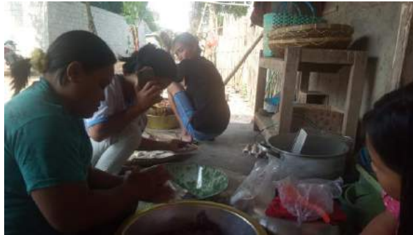
Gambar 2.5 Membantu kegiatan kelompok tani

Diminggu kedua ini kegiatan kelompok tani, yaitu ibu rumah tangga melakukan kegiatan pengolahan hasil panen singkong dan ubi yang dibuat menjadi olahan jajanan pasar. Kegiatan ini dilakukan secara bebas, yang bisa dilakukan oleh setiap anggota kelompok tergantung permintaan pesanan. Olahan yang dibuat adalah kue combro, klepon, dan ubi goreng.