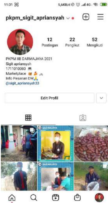
Gambar 3.7 Akun kegiatan PKPM