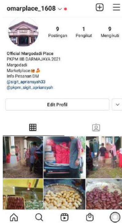
Gambar 3.6 Akun sosial media