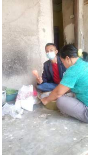
Gambar 3.3 Membantu kegiatan kelompok tani