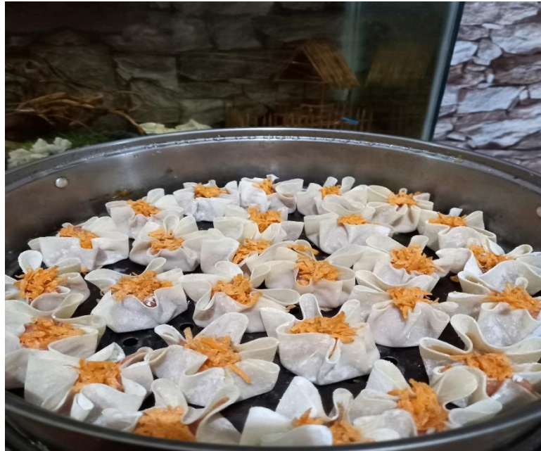
Ini Merupakan Gambar Dimsum Ayam Sebelum di Inovasi