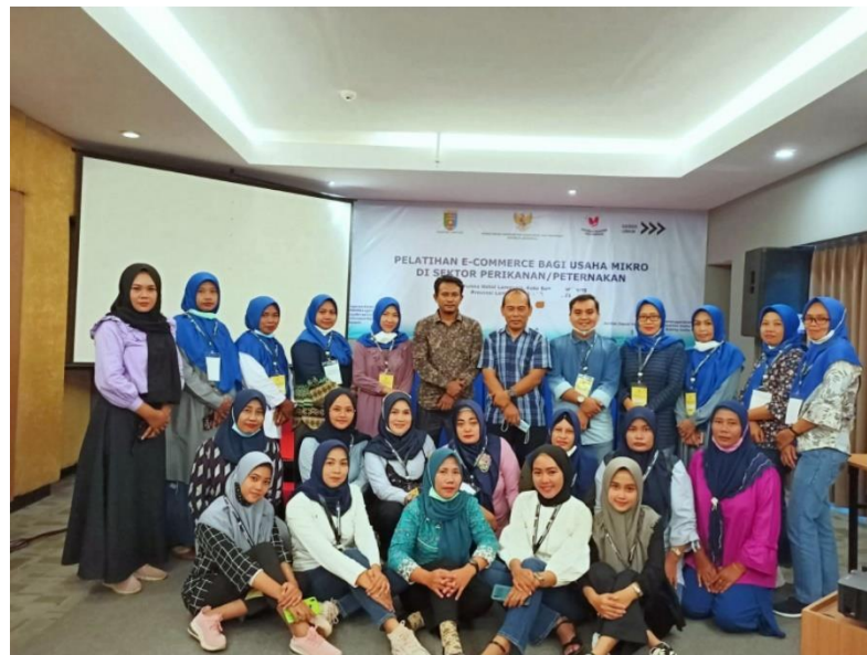
Gambar pelatihan E-commers bersama anggota UMKM