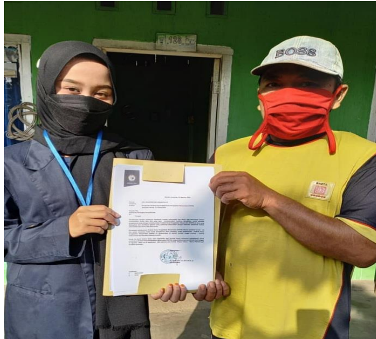
Gambar Memberikan Surat Pengantar PKPM Mandiri Sekaligus Meminta Perizinan Melakukan Kegiatan PKPM di Lingkungan RT 01 Warnasari Desa Durian Kecamatan Padang Cermin