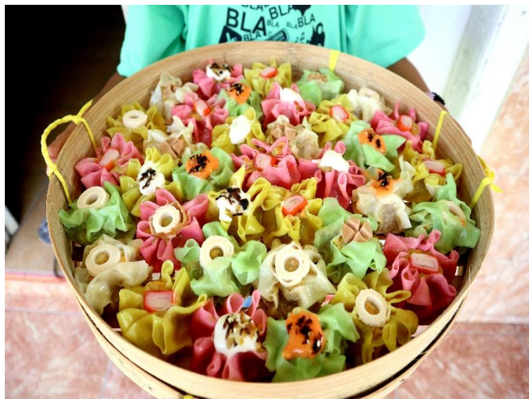
Ini Merupakan Gambar Dimsum Ayam yang Sudah di Inovasi