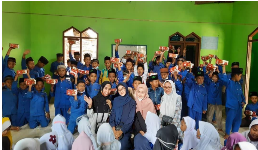
Gambar Kunjungan ke TPA Darul Falah Bersama Pemudi Desa Durian Sekaligus Dalam Rangka Kegiatan Jumat Berkah