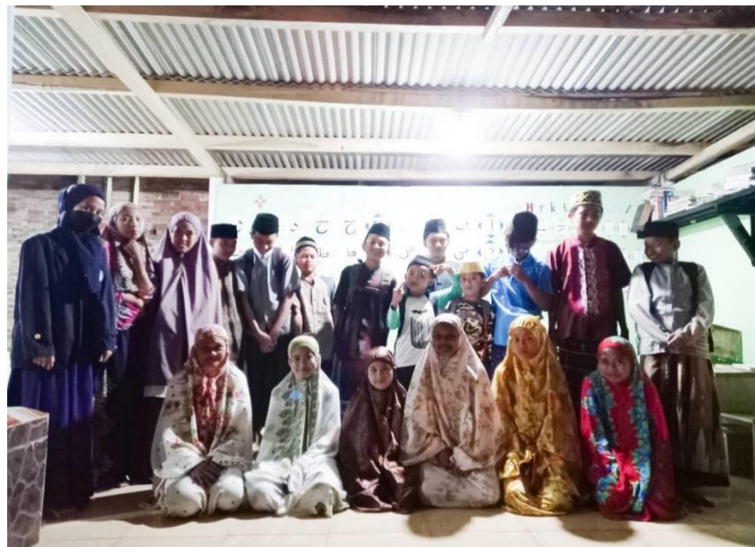
Gambar Mengajar Anak-Anak TPA Hasanudin