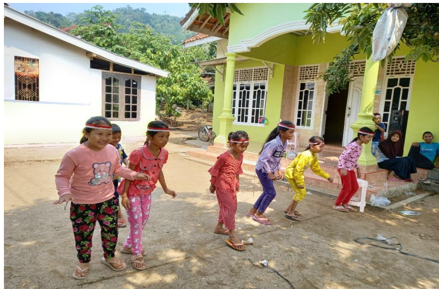
Gambar Perlombaan Menyambut Hari Ulang Tahun Kemerdekaan Indonesia