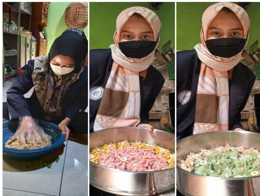
Gambar Proses Pembuatan UMKM Dimsum Ayam Rainbow