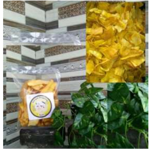
Gambar 2.10 Promosi pada media sosial.