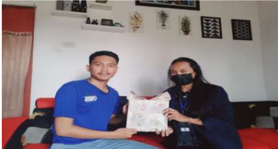
Gambar 2.18 Memberikan buah tangan kepada pemilik UMKM

Buana dengan menyerahkan buah tangan kepada pemilik UMKM sebagai tanda terima kasih selama saya melakukan PKPM di desa Resstu Buana kecamatan Rumbia Kabupaten Lampung Tengah.