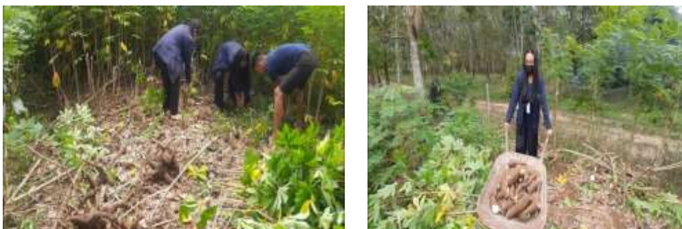
Gambar 2.5 Proses pencabutan singkong

Proses pembuatan pembuatan kripik singkong dimulai dari pencabutan singkong, proses mengupas singkong, pembersihan singkong, memotong menggunakan mesin, menggoreng hingga promosi.