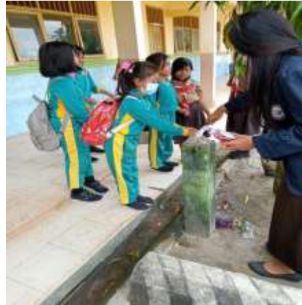
Gambar 2.16 Edukasi cara mencuci tangan yang benar