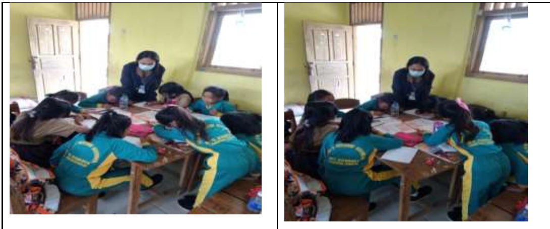
Gambar 2.17 Mengajar

Dengan kampus mengajar dapat bersosialisasi terhadap siswa siswi sekolah dasar agar dapat menambah wawasan mereka.