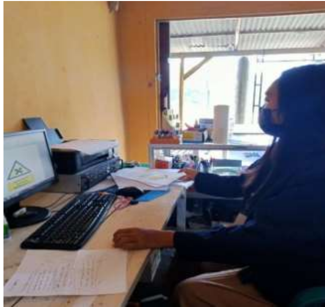
Gambar 2.14 pembuatan video promosi