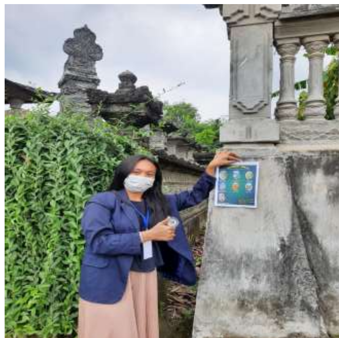
Gambar 2.11 Promosi sekitar