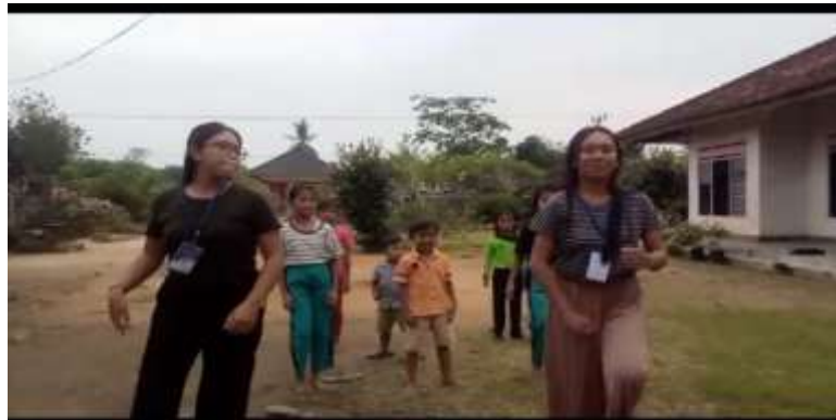
Gambar 2.15 Senam

Kegiatan senam ini dilakukan untuk menyadarkan betapa pentingnya kesehatan dan mendatangkan manfaat bagi kesehatan tubuh. Selain memberikan manfaat untuk tubuh, dilakukan agar anak-anak semakin aktif dan mengigat.