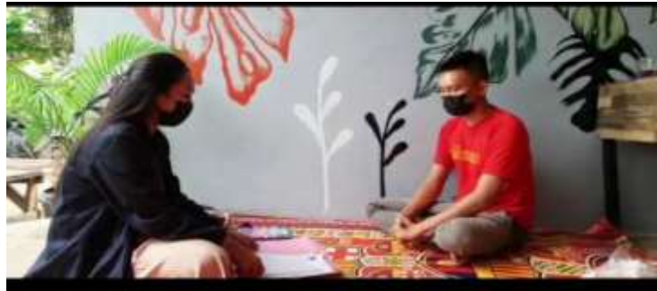
Gambar 2.9 Melakukan wawancara

Untuk mengetahui berapa omset yang didapatkan oleh mas dewa setiap bulanannya dan berapa modal yang dikeluarkan.