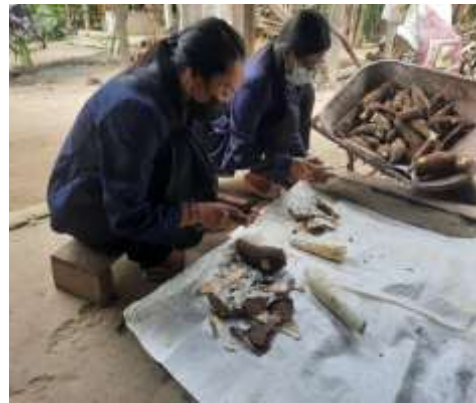
Gambar 2.6 Pengupasan dan pembersihan singkong