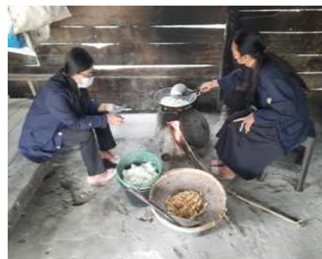
Gambar 2.7 Pematangan singkong, dan menggoreng singkong.