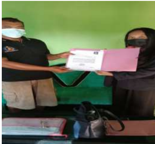
Gambar 2.2 Penyerahan surat izin PKPM kepada RT desa restu buana

Surat Pengantar Praktek Kerja Pengabdian Masyarakat (PKPM) Adalah sebagai bentuk surat izin ke pemerintah desa untuk melakukan kegiatan PKPM. Bersyukur pemerintah desa menerima saya dengan sambutan yang ramah dan hangat, sehingga penyerahan surat izin berjalan dengan lancar.