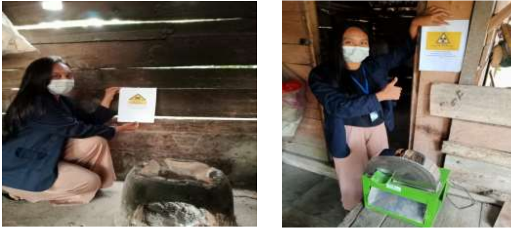
Gambar 2.12 Pemasangan peringatan disekitar dapur