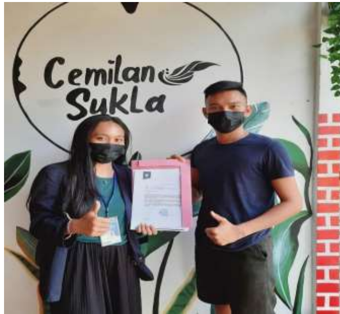
Gambar 2.4 Meminta izin kepada pemilik UMKM