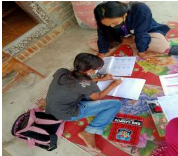
Gambar 2.3 Pendampingan belajar di rumah