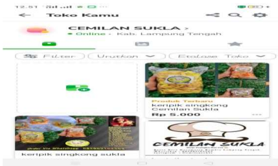
Gambar 2.13 Marketplace