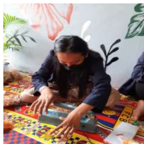
Gambar 2.8 Proses pembungkusan dan melebelan kripik singkong.