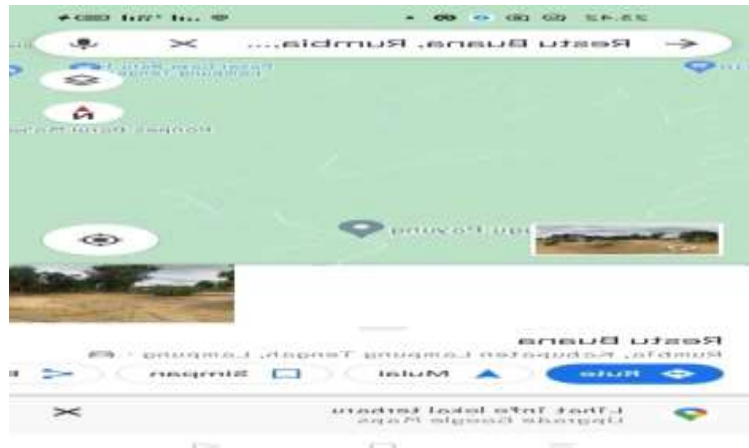
Gambar 2.1 denah desa restu buana

Seperti pada Jumlah penduduk di Desa Restu Buana Kecamatan Rumbia, Kabupaten Lampung Tengah adalah 2.524 jiwa. Kondisi pendidikan di desa Restu Buana terdapat TK, SD, dan SMA. Agama yang dianut di desa Restu Buana mayoritas beragama Hindu, dengan memiliki 3 tempat ibadah (pura). Masyarakat di desa Restu Buana bermata pencarian sebagai petani, seperti padi, jagung, dan ubi kayu. Serta perkembangan potensi di desa Restu Buana adalah kelapa, coklat, karet, dan kelapa sawit.