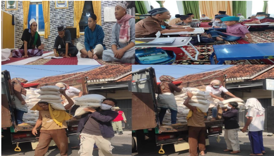
Gambar 2. Foto sosialisasi kepada masyarakat kelurahan jagabaya II