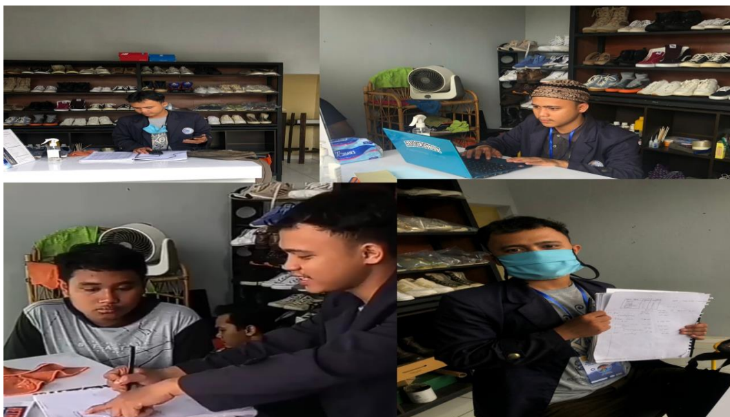
Gambar 3. Foto program edukasi wawasan ilmu dasar akuntansi kepada karyawan UMKM Soc.celan lampung dan membuat jurnal umum periode bulan Agustus 2021