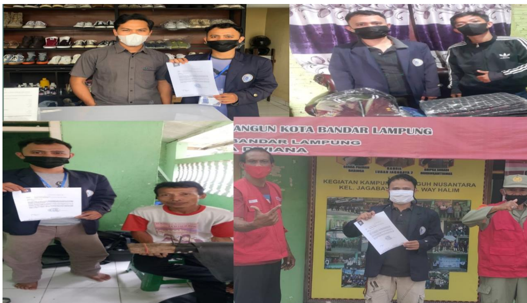
Gambar 1. Foto dengan anggota kelurahan dan kunjungan kepada pemilik UMKM

Dokumentasi pelaksanaan program-program PKPM: