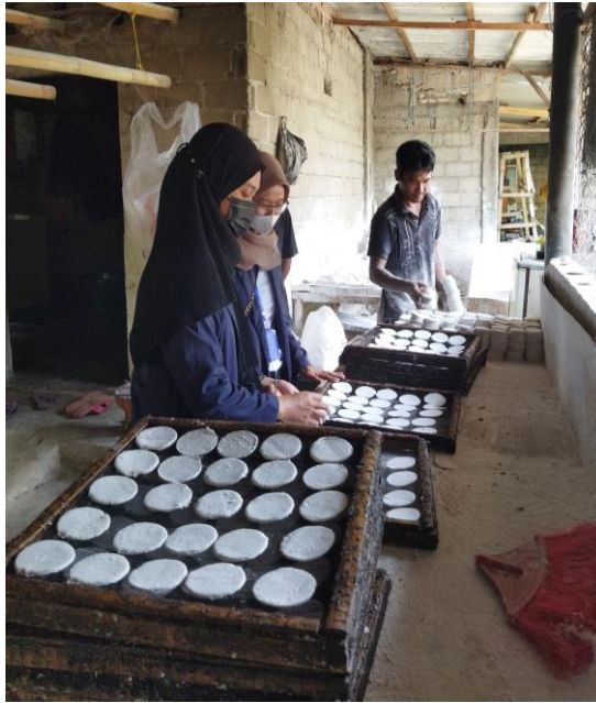
Gambar 2.8 Pembuatan kerupuk kemplang