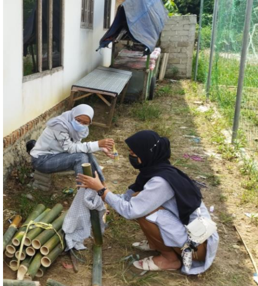
Gambar 2.3 Membersihkan bambu dan mengecat