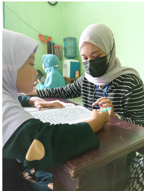
Gambar 2.2 Mengajari anak-anak mengaji dan hafalan