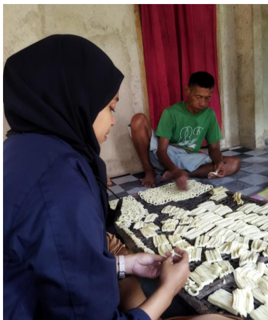
Gambar 2.9 Pembuatan klanting