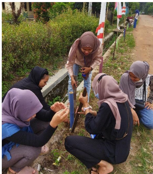
Gambar 2.4 pemasangan patok di pinggir jalan taman balai desa