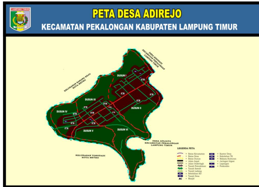
Gambar 1.1. Peta Desa Adirejo