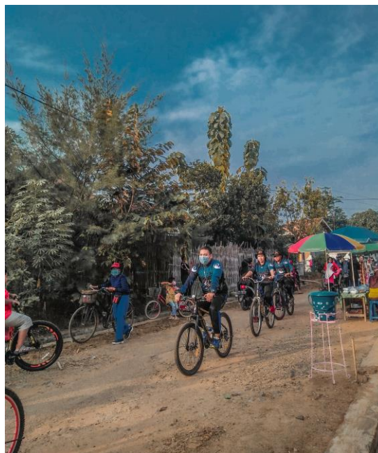
Gambar 2.6 Gowes sepeda yang diadakan di pawang macan