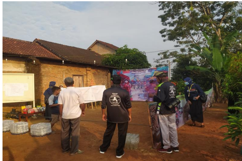
Gambar 2.5 Perlombaan di pasar kreatif warung macan