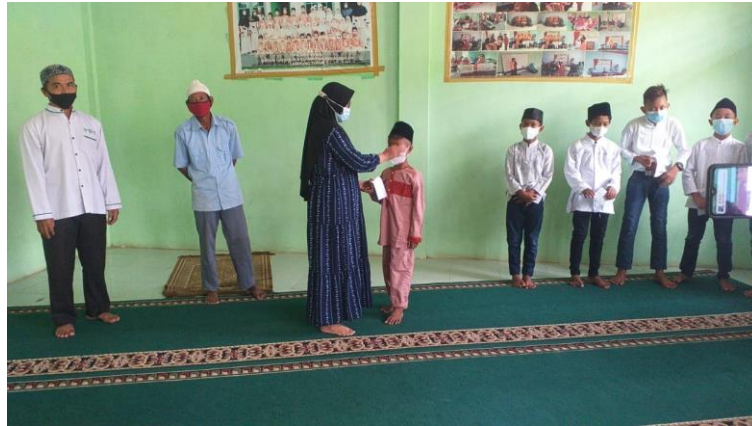
Gambar 2.1 Pemberian santunan uang untuk anak yatim