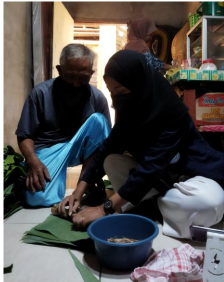
Gambar 2.7 Pembuatan lontong