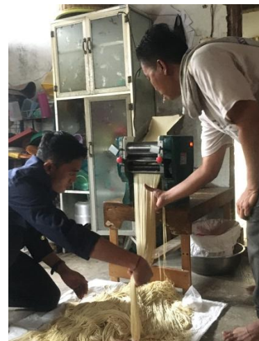
(Membantu UMKM dalam Produksi Pembuatan mie dengan mesin giling )