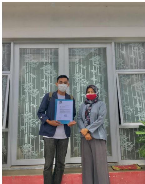
Gambar 1.1 kunjungan kepada ketua RT

Selama PKPM berlangsung saya ikut serta dalam proses pembuatan Mie Ayam Eka dari tahap awal sampai dengan tahap akhir serta berinovasi membuat logo untuk Mie Ayam Eka dan mengedukasi pemilik UMKM tentang penggunaan media sosial