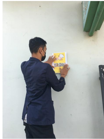
(Menempelkan Pamflet promosi Mie Ayam yang dapat membantu promosi Mie ayam dikenal banyak konsumen)