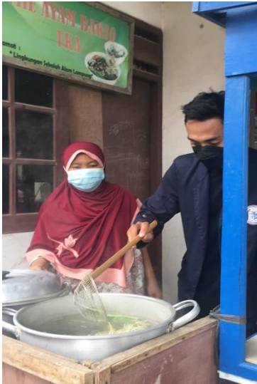
(Belajar cara membuat mie ayam yang dibantu oleh pemilik UMKM)