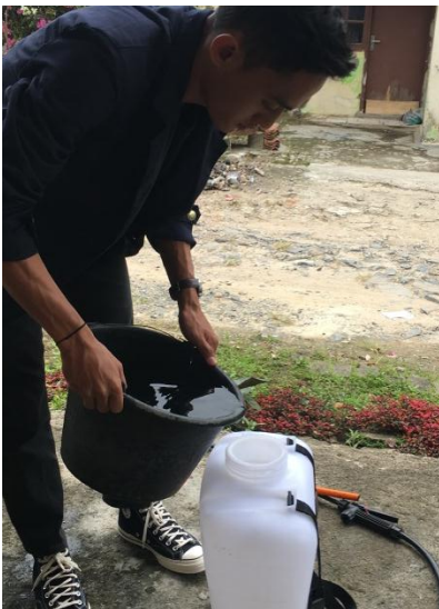
(Melakukan Penyemprotan Disinfektan)

Mengajar anak-anak Desa sekitar dalam proses pembelajar tugas Online sekolah