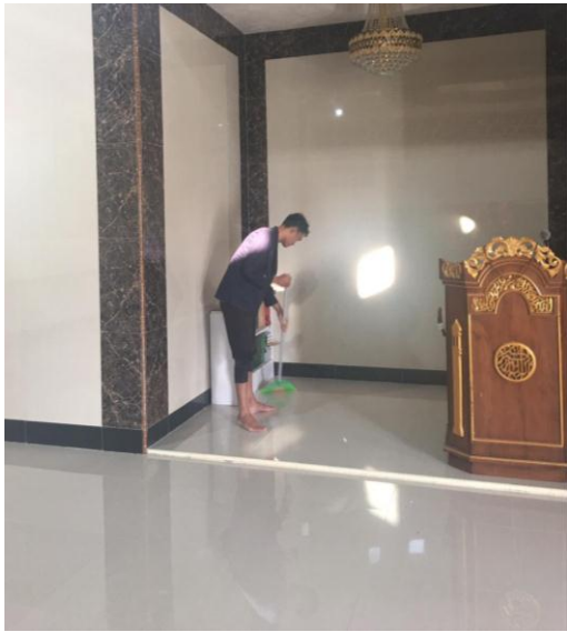
(Membersihkan Masjid Nurul Pemda )