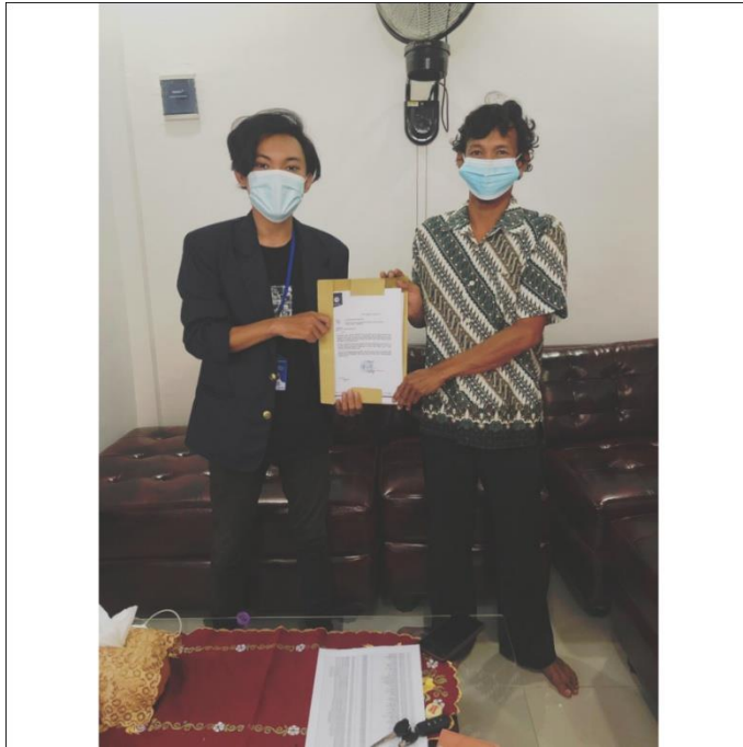
Gambar 2.1 Dokumentasi foto meminta izin melaksanakan kegiatan