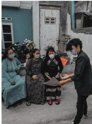
Gambar 2.4 Dokumentasi tentang Covid-19