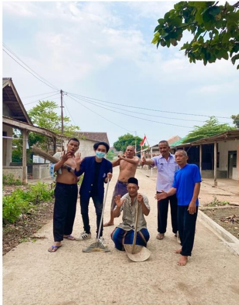
Gambar 2.2 Dokumentasi kegiatan Gotong Ro