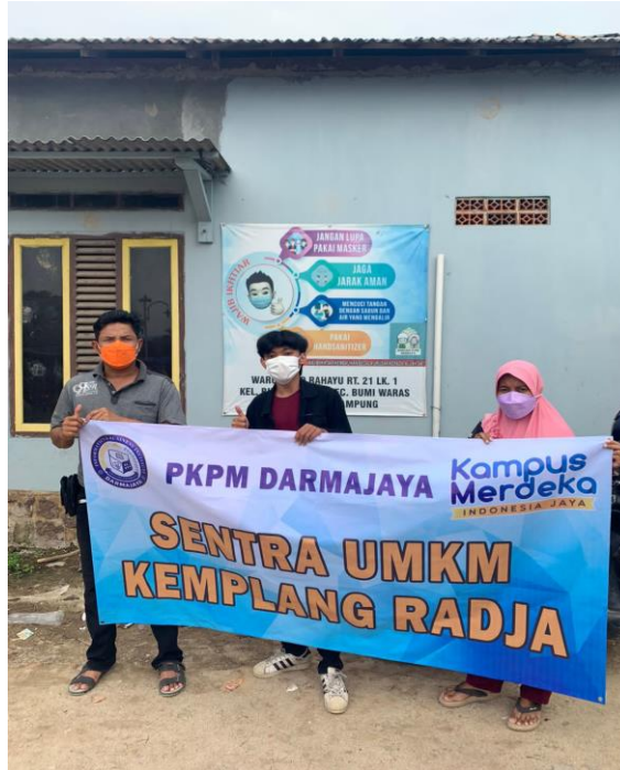
Penyerahan Benner kepada UMKM