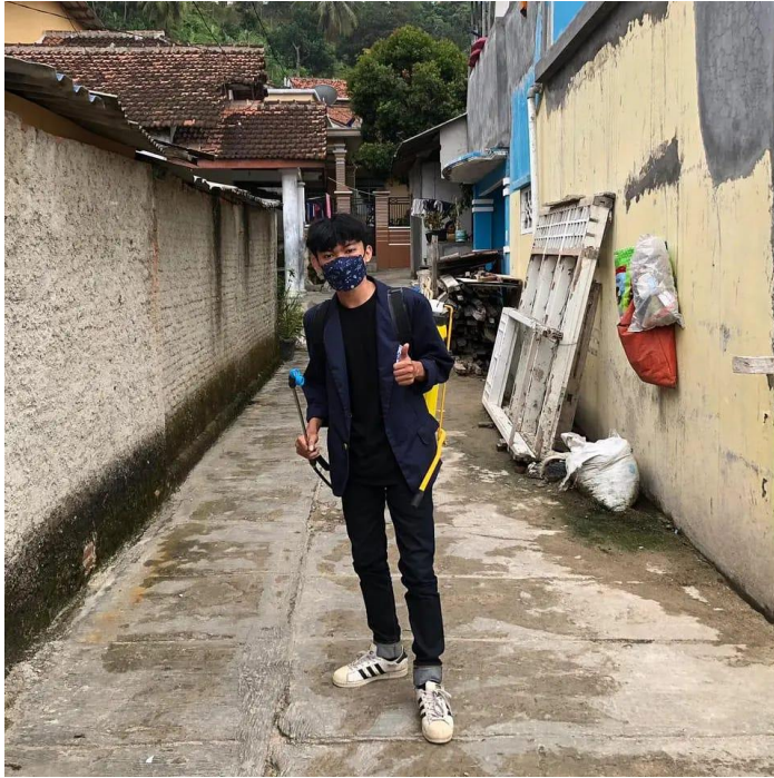
Gambar 2.5 Penyemprotan Disinpektan di sekitar lingkungan