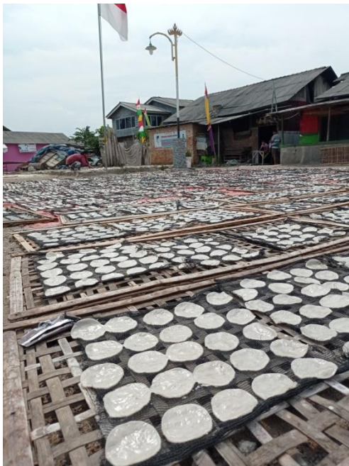
Proses Penjemuran Kemplang