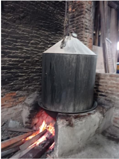
Proses pemanggangan kemplang