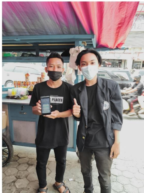
Pengamplikasian Buku Warung Membersihkan Musholah