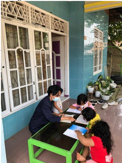
Gambar 2.6 dokumentasi memberikan pembelajaran kepada anak-anak Pembuatan Sosial media untuk UMKM