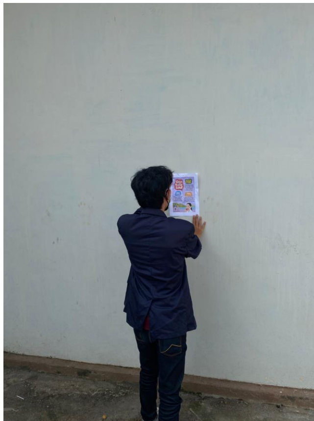
Penempelan Poster tentang hidup sehat di era pandemi