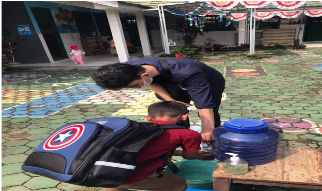
Gambar 2.11. Mensosialisasi dan mengajarkan kebersihan dengan mencuci tangan kepada anak-anak