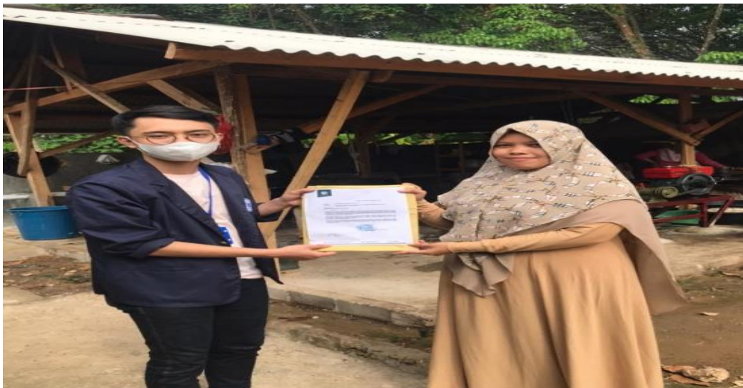
Gambar 2. Meminta izin ke pemilik UMKM untuk melakukan kegiatan PKPM