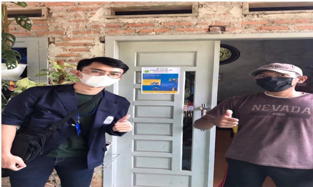
Gambar 8.Memasang Poster Covid-19