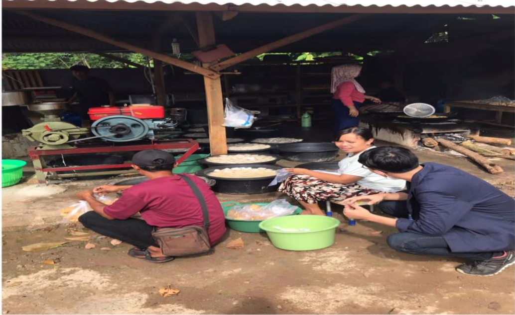
Gambar 3. Melakukan Surver Ke UMKM