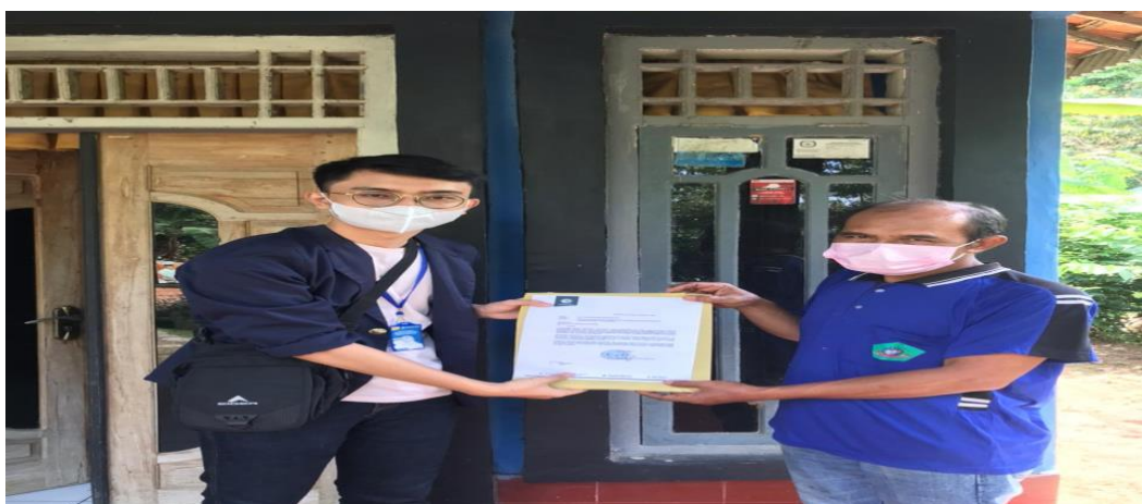
Gambar 2.1. Meminta izin ke Kepala RT