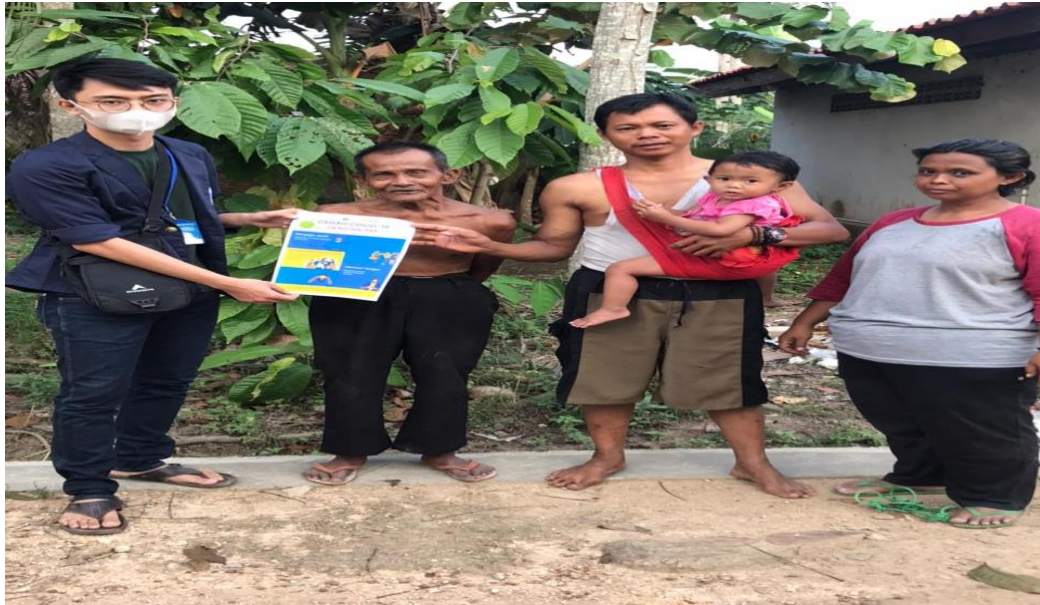
Gambar 2.7. Sosialisasi Covid 19 kepada warga sekitar

Masyarakat memiliki peran penting dalam memutus mata rantai penularan COVID-19 agar tidak menimbulkan sumber penularan baru/cluster pada tempat-tempat dimana terjadinya pergerakan orang, interaksi antar manusia dan berkumpulnya banyak orang. Masyarakat harus dapat beraktivitas kembali dalam situasi pandemi COVID-19 dengan beradaptasi pada kebiasaan baru yang lebih sehat, lebih bersih, dan lebih taat, yang dilaksanakan oleh seluruh komponen yang ada di masyarakat serta memberdayakan semua sumber daya yang ada.