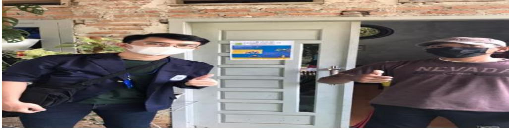
Gambar 2.8. Memasang poster tentang penerapan protokol kesehatan

Salah satu program kerja yang dilakukan adalah mengedukasi masyarakat terkait pencegahan Covid-19 melalui poster yang dipasang dan dibagikan ke masyarakat. Poster ini merupakan salah satu cara untuk membantu pemerintah dalam mencegah penyebaran virus Covid-19. Dengan adanya poster pencegahan Covid-19 ini, diharapkan seluruh masyarakat memperoleh edukasi yang sama terkait langkah pencegahan Covid-19 dan selalu menaati protokol kesehatan yang diberikan. Kegiatan tersebut mendapat respon positif dari aparat pemerintahan dan masyarakat desa setempat.