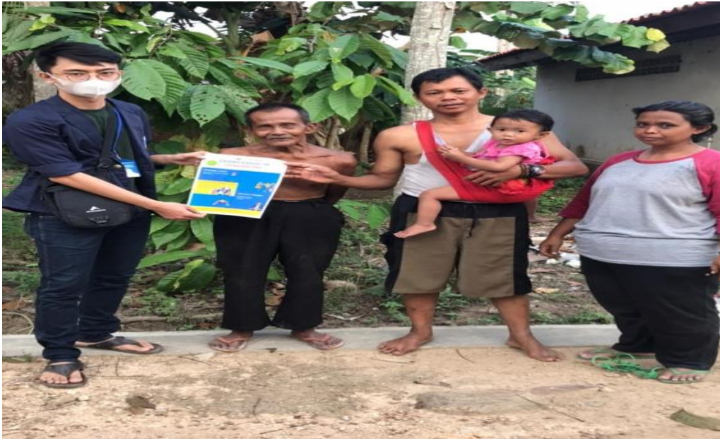
Gambar 7.Sosialisasi Kepada warga sekitar tentang Covid-19