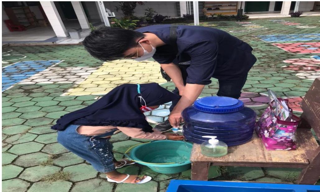
Gambar 11. Mengajarkan Kebersihan Terutama Dengan Mencuci Tangan