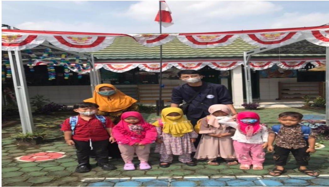
Gambar 2.9. Meminta izin ke guru untuk melakukan kegiatan PKPM dengan membantu mengajar kepada murid-murid

Bertujuan untuk meminta izin kepada pihak sekolah untuk melakukan kegiatan PKPM Mandiri 2021 selama 5 hari dengan meminta dukungan dari pihak guru, staf sekolah, dan para murid