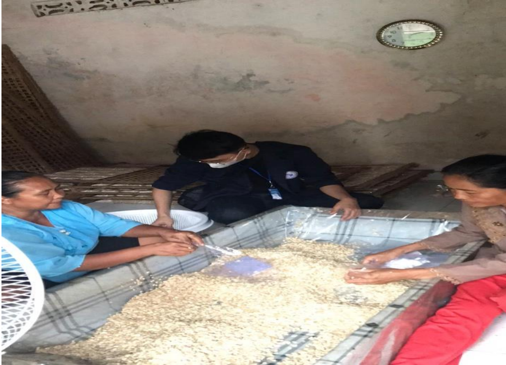
Gambar 5. Tahap Pengemasan Tempe