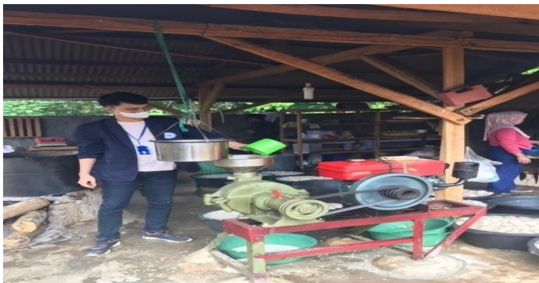
Gambar 2.4. Proses memproduksi pembuatan tahu dan tempe