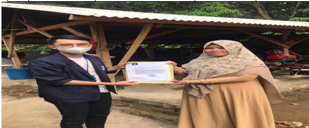
Gambar 2.2. Meminta izin kepada pemilik UMKM