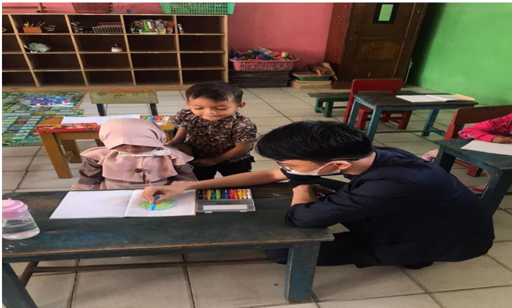
Gambar 10. Membantu Proses Belajar Mengajar di Masa Pandemi Covid-19