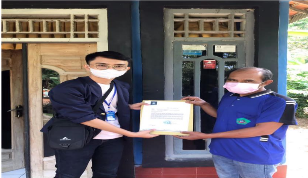
Gambar 1. Meminta izin kepada ketua RT untuk melakukan kegiatan PKPM