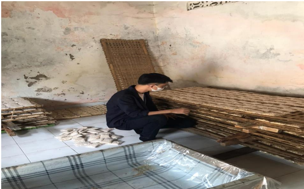
Gambar 6. Tahap Penghitungan tempe yang telah di produksi per hari