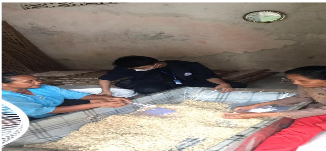
Gambar 2.5. Tahap Pengemasan Tempe