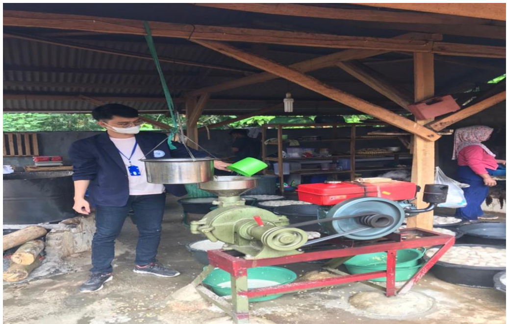
Gambar 4. Melakukan Produksi Pembuatan Tahu dan Tempe