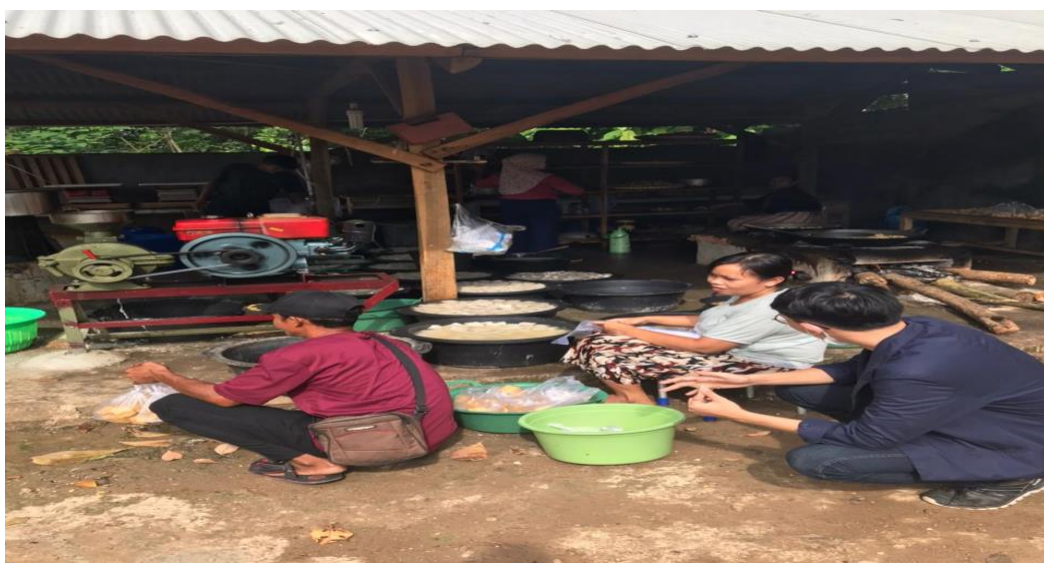
Gambar 2.3. Survey UMKM