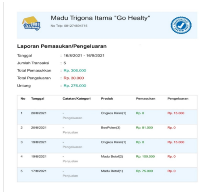
Gambar 2.7 Laporan keuangan menggunakan aplikasi "Buku Warung"

Pembuatan Laporan Keuangan sangatlah penting dalam menumbuhkan kemajuan UMKM. Dalam pelaporan keuangan, kita dapat mengetahui kondisi finansial UMKM menjadi lebih baik atau tidak.