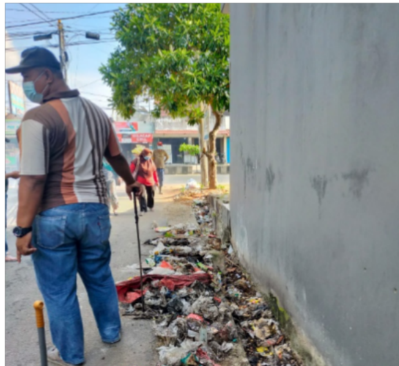
Gambar 2.10 Melakukan kegiatan gotong royong dengan warga

Mengikuti kegiatan gotong royong yang dilakukan oleh warga RT 13 Kedamaian Bandar Lampung. Setiap hari jumat pagi dari jam 08.00 warga RT 13 melakukan kegiatan gotong royong yaitu bersih-bersih jalan yang berada di daerah Jalan Pangeran Antasari. Yang terlibat dalam kegiatan ini adalah Lurah, Camat, seluruh Ketua RT yang ada di Desa Kedamaian, dan para warga Desa Kedamaian Bandar Lampung.