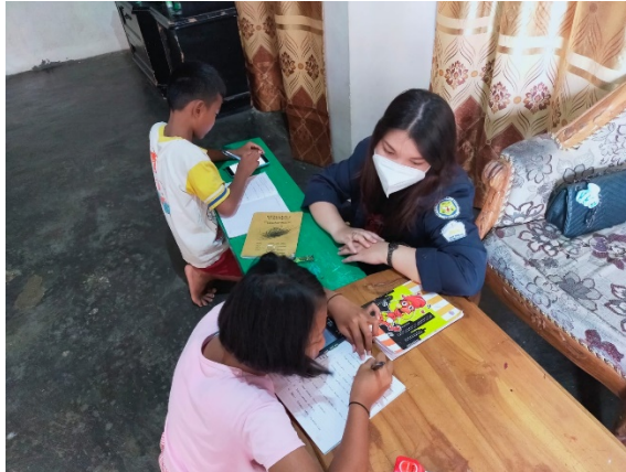
Gambar 2.8 Kegiatan mengajar dan mendampingi anak-anak belajar