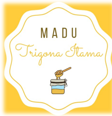
Gambar 2.5 Logo milik UMKM Ternak Lebah