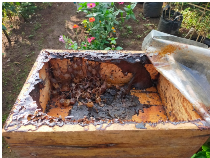
Sarang lebah (Madu Trigona Itama)