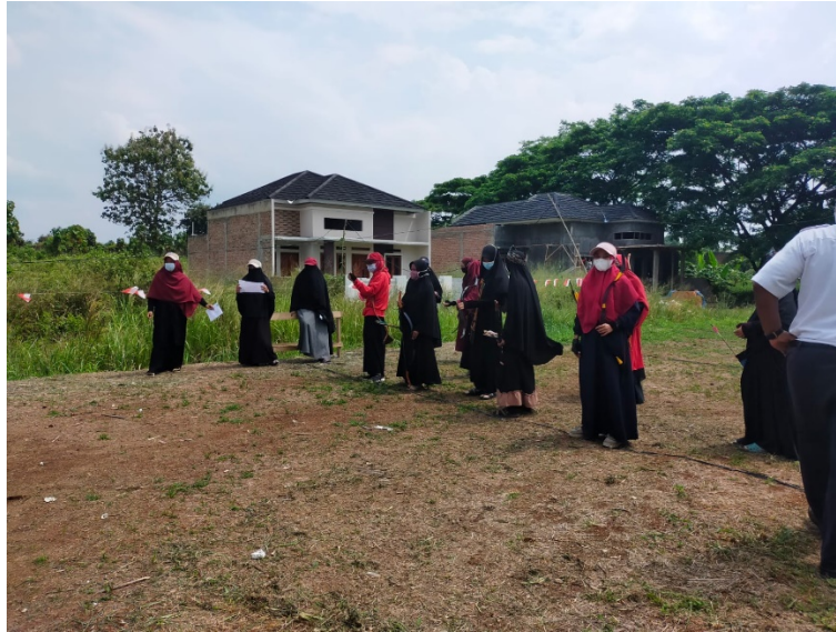
Kegiatan acara perlombaan 17an di RT 13 Kedamaian Bandar Lampung