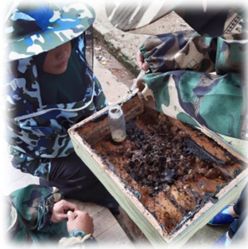
Gambar 2.4 Proses produksi Ternak Lebah

Proses produksi usaha Ternak Lebah ini dimulai ketika sudah siap untuk di panen. Ketika sudah siap di panen, para santri di Yayasan Sanggar Yatim Baitul Jannah melakukan proses produksi dengan melakukan alat untuk memasukan mad ke dalam botol.