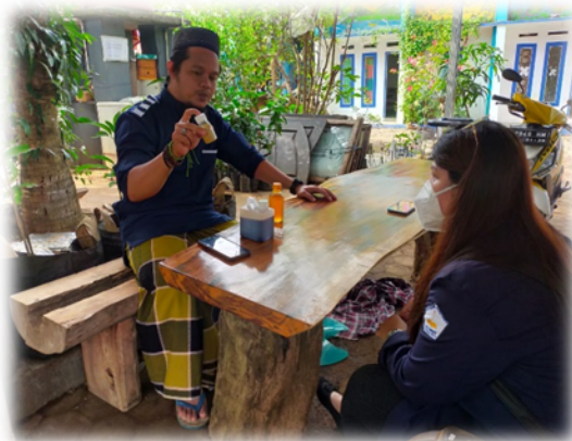
Gambar 2.3 Melakukan wawancara kepada pemilik UMKM Ternak Lebah