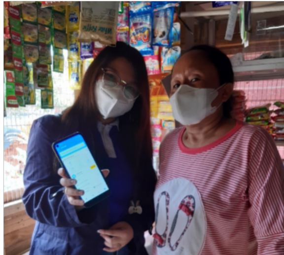
Gambar 2.1 Kegiatan Mengenalkan Aplikasi "Buku Warung" kepada UMKM

ibu warung agar bisa mencatat kas masuk, kas keluar, utang, dan piutang. Dengan menggunakan aplikasi ini juga membantu ibu warung untuk membedakan uang untuk usaha warung dengan uang untuk keperluan pribadi.