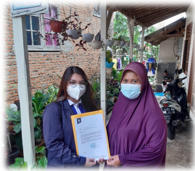
Kegiatan Penyerahan Surat Pengantar kepada Ketua RT