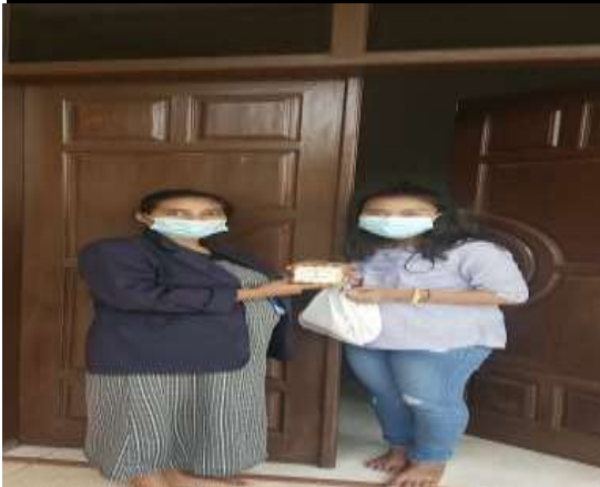
Pembeli kue pia af