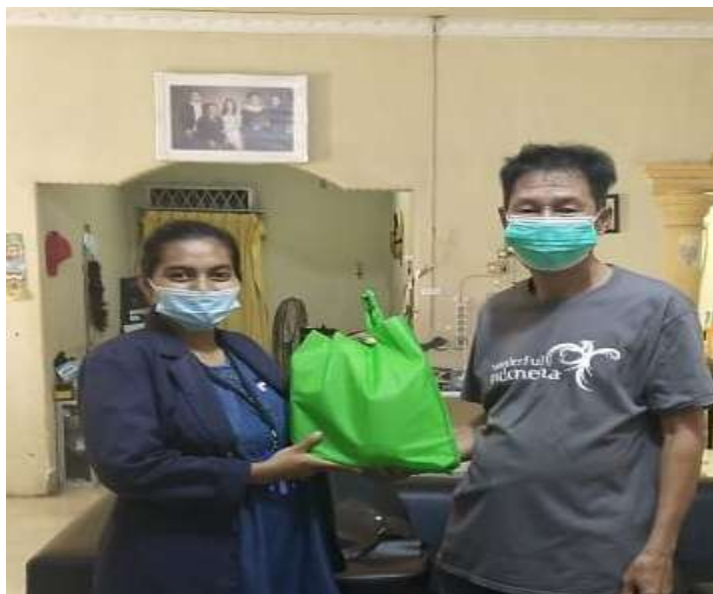
Gambar 3.3 Pemberian Cendramata Kepada Pemilik UMK

Tujuan pembuatan instagram dan wib site ini adalah sebagai sarana promosi, sehingga harapannya dengan adanya instagram ini market pasar dari “ Kue Pia AF” menjadi lebih luas dan masyarakat lebih mudah untuk mengetahui produk ini, serta akses pembelian oleh konsumen jauh lebih mudah dari sebelumnya.