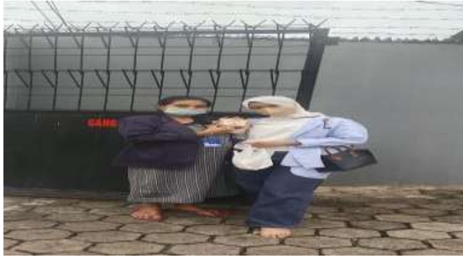
Pembeli kue pia af dari social media