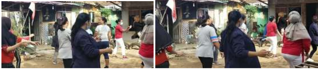
Gambar 1.5 Blosur pencegahan covid 19

Kegiatan selanjutnya adalah pemberian sosialisasi kepada masyarakat sekitar. Dengan tujuan untuk membantu pemerintah dalam memutus rantai penyebaran COVID-19 dan mensosialisasikan NewNormal kepada masyarakat. Karena masih banyak dari mereka yang tidak menerapkan protokol kesehatan dalam kehidupan sehari-hari. Contohnya seperti tidak memakai masker dalam lingkungan sekitar.