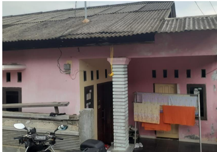
Gambar 1.2 Profil Produksi UMKM Bapak Supono

Mitra disini adalah UMKM yang bergerak dalam bidang Home Industri Macaroni yang terletak di Jl. Cendana, Tanjung Senang. Saya melakukan edukasi memotivasi serta menerapkan konsep peningkatan kualitas di UMKM. Mengedukasi bagaimana untuk mendapatkan macaroni yang berkualitas, serta untuk tetap menjaga kesehatan dan memakai protokol kesehatan di UMKM Macaroni tersebut.