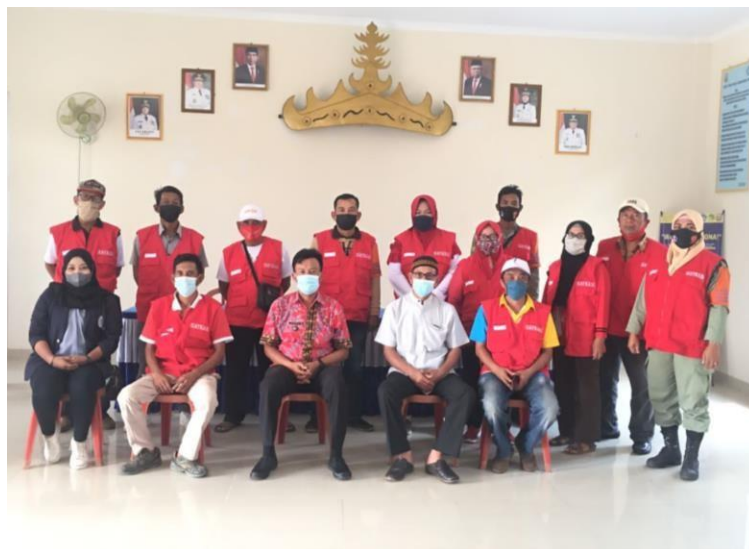
Gambar 3.1 Penutupan dan Perpisahan PKPM