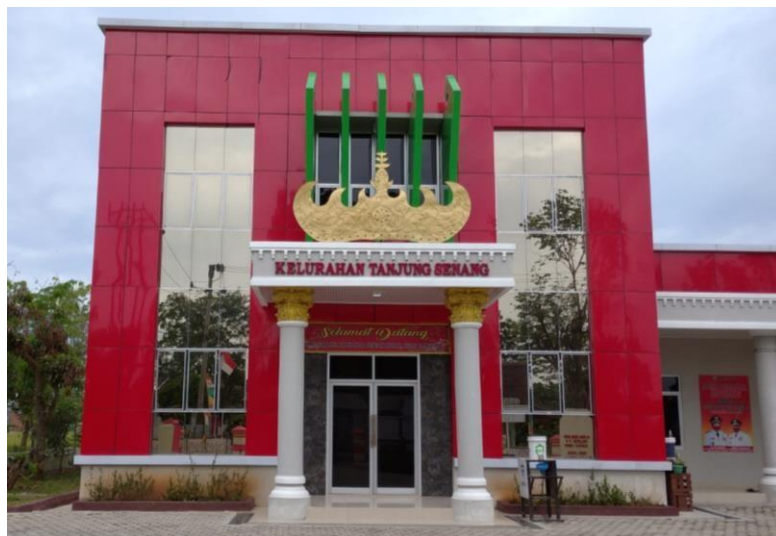
Gambar 1.1 Lokasi Kelurahan Tanjung Senang Jl. Damai Tj.Senang, Bandar Lampung.

Kegiatan PKPM ini dilaksanakan sebagai upaya untuk memperdayakan potensi dan sumber daya yang dimiliki di Kelurahan Tanjung Senang dengan membuat Usaha Mikro Kecil Menengah yang baru. Di Tanjung Senang terdapat UMKM Macaroni. Makaroni adalah sejenis pasta yang terbuat dari campuran gandum jenis durum, tepung terigu, dan air. Makaroni yang beredar di pasaran umumnya telah diperkaya dengan berbagai vitamin dan mineral seperti zat besi, vitamin B1, vitamin B2, vitamin B3, dan asam folat.