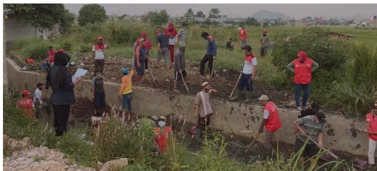
Gambar 2.3 Kegiatan Gotong Royong di aliran sungai