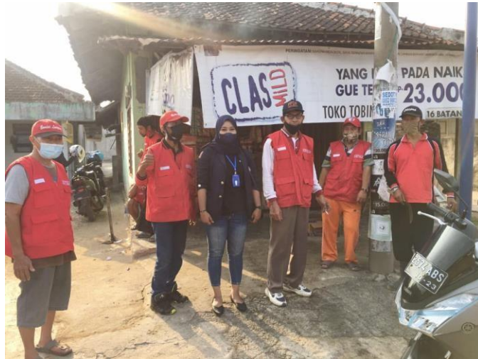
Gambar 2.9 Kegiatan Razia Masker bersama Satgas Covid-19