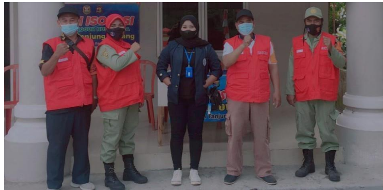
Kegiatan Piket di Posko Covid-19