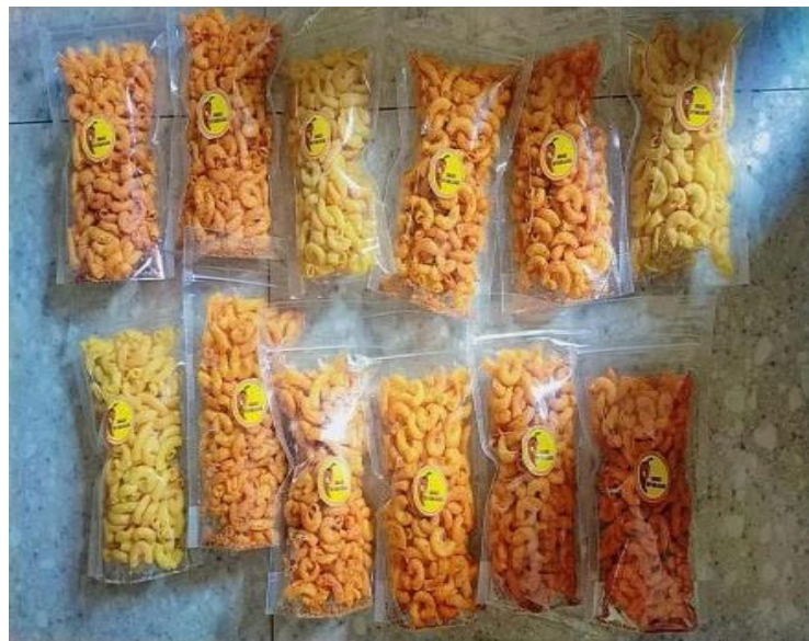
Tampilan Kemasan Macaroni