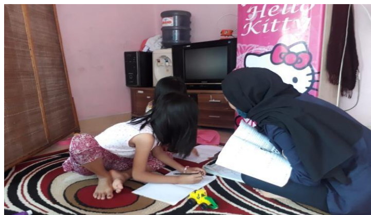
Gambar 2.7 Pendampingan Siswa Belajar Dirumah