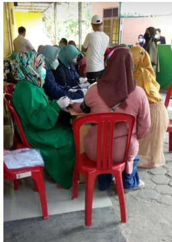
Gambar 2.6 Membantu vaksin Covid-19