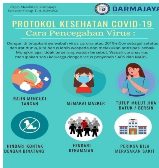
Gambar 2.8 Membuat poster pencegahan virus covid-19