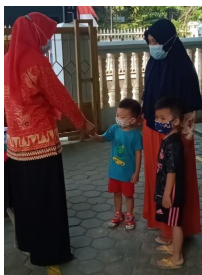
Gambar 2.4 Kegiatan Posyandu