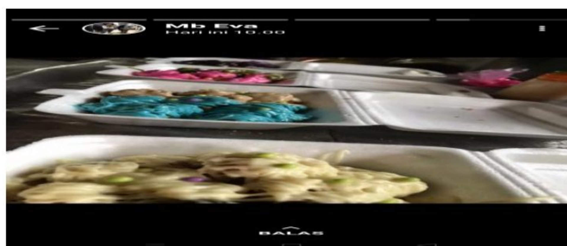
Gambar 1.3 Whatshapp Banana Royalll