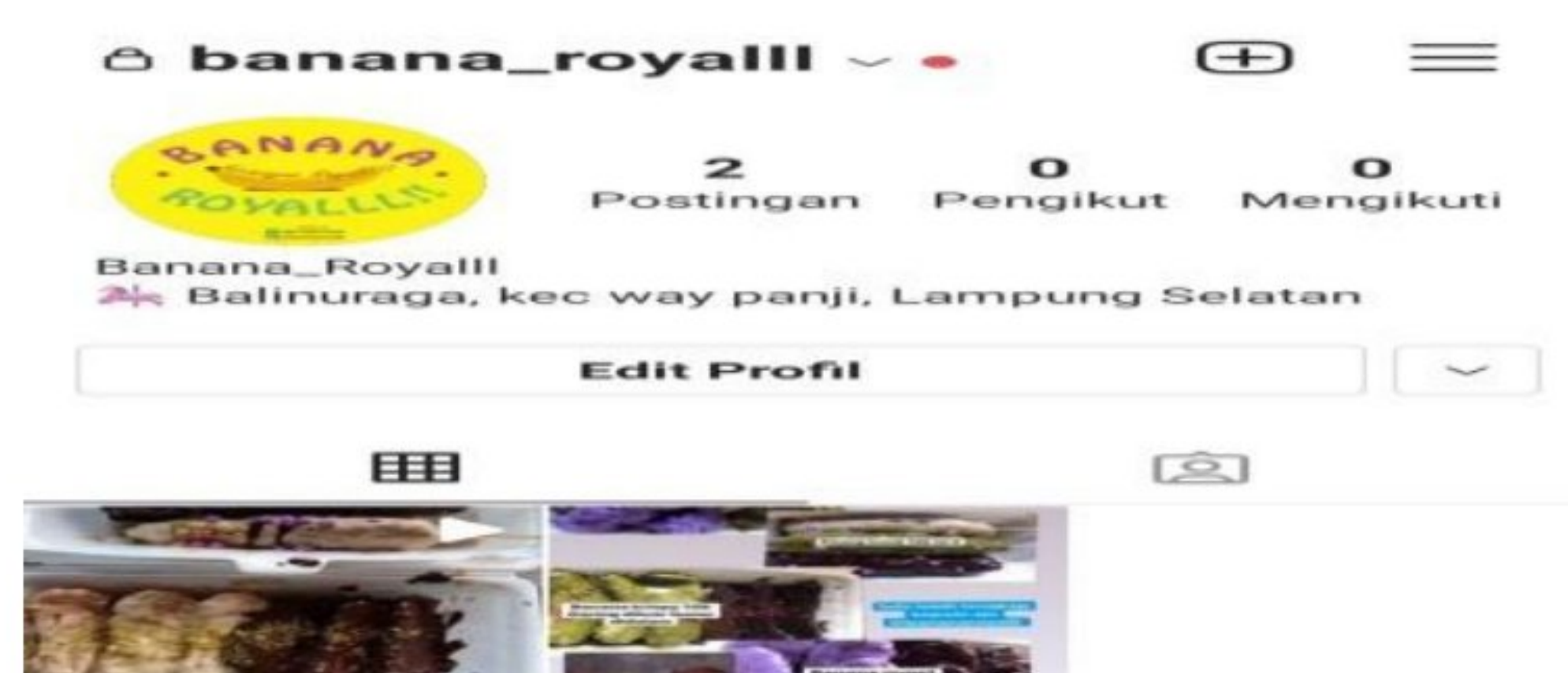
Gambar 1.1 Instagram Banana Royalll