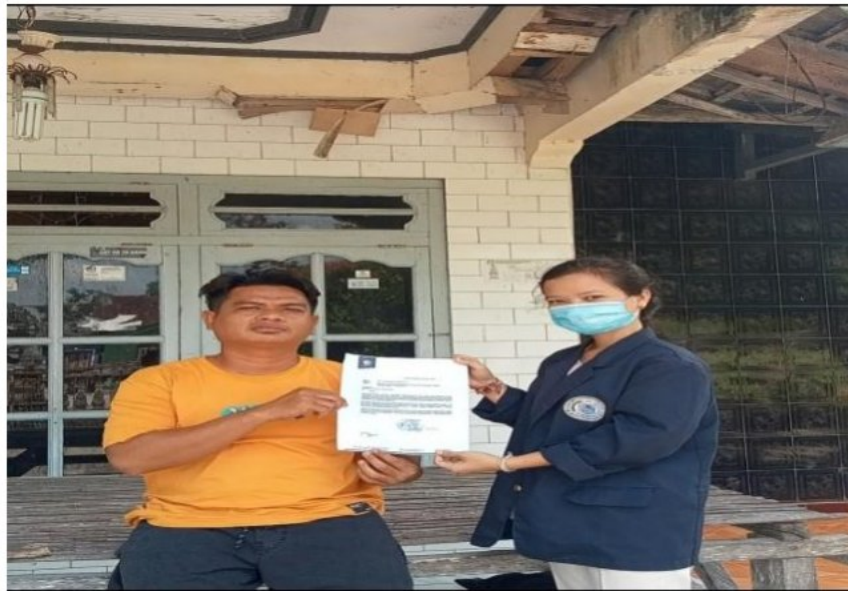
Gambar 1.9 Meminta izin Kepada Kepala Dusun Setempat