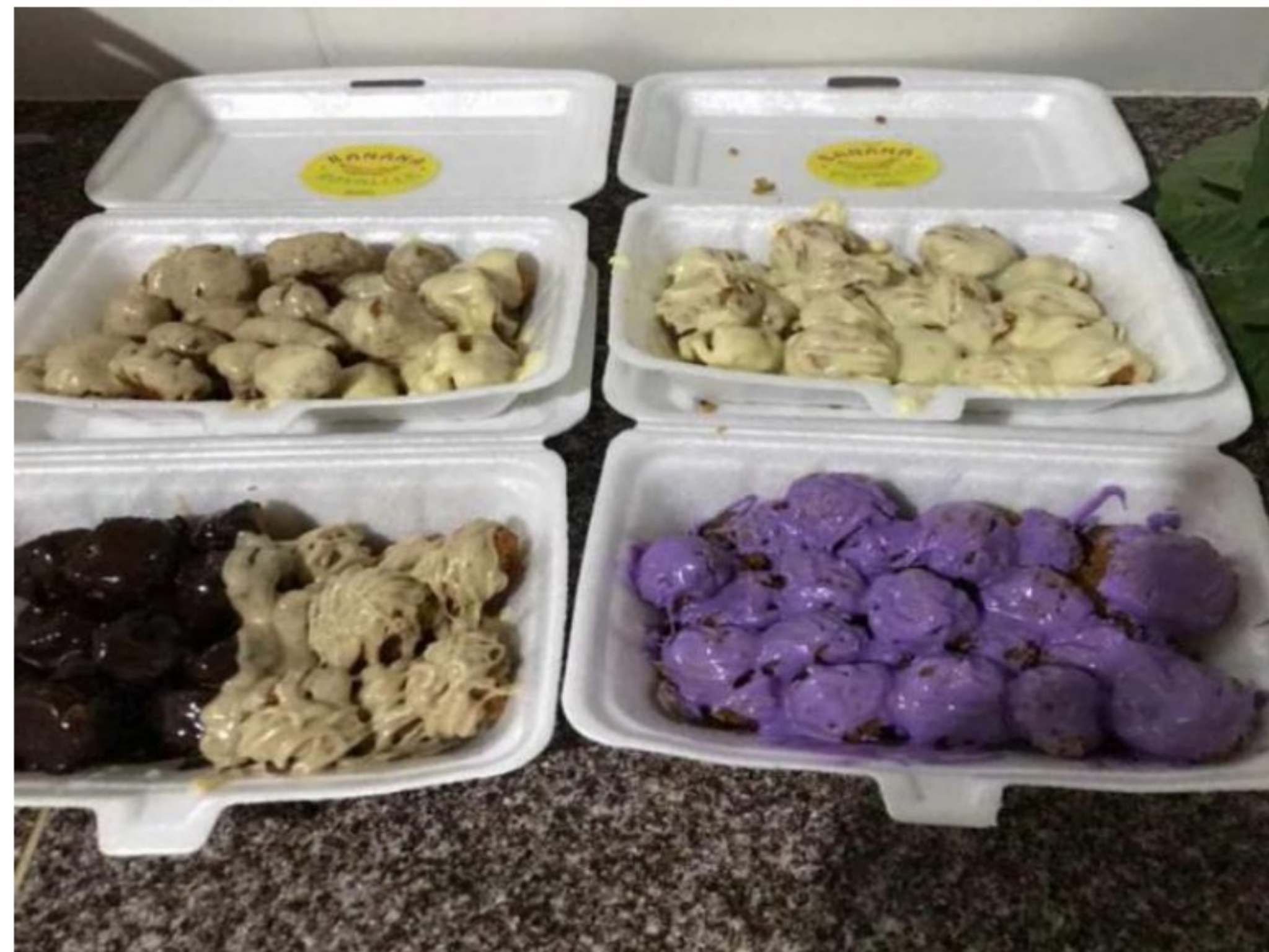
Gambar 1.16 Proses Pengemasan Banana Royalll setelah ada logo