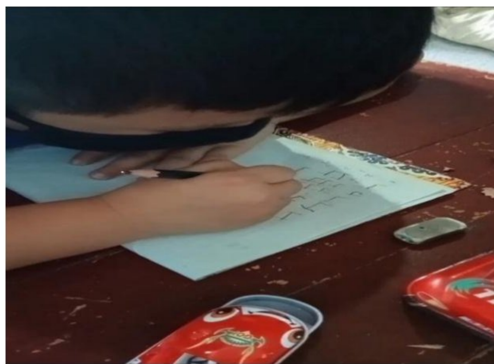
Gambar 1.8 Belajar menulis

Sistem pembelajaran jarak jauh yang diterapkan sejak terjadinya pandemi COVID-19 mengakibatkan siswa SD mengalami banyak kesulitan. Adapun kegiatan lain yang Penulis lakukan yaitu membimbing dan membantu proses pembelajaran siswa sekolah dasar secara langsung baik secara tidak langsung dan hasil yang diperoleh yaitu siswa tersebut lebih mengerti materi materi yang diberikan oleh guru secara daring dengan baik sehingga dapat mengerjakan tugas yang diberikan oleh guru dengan baik dan benar.