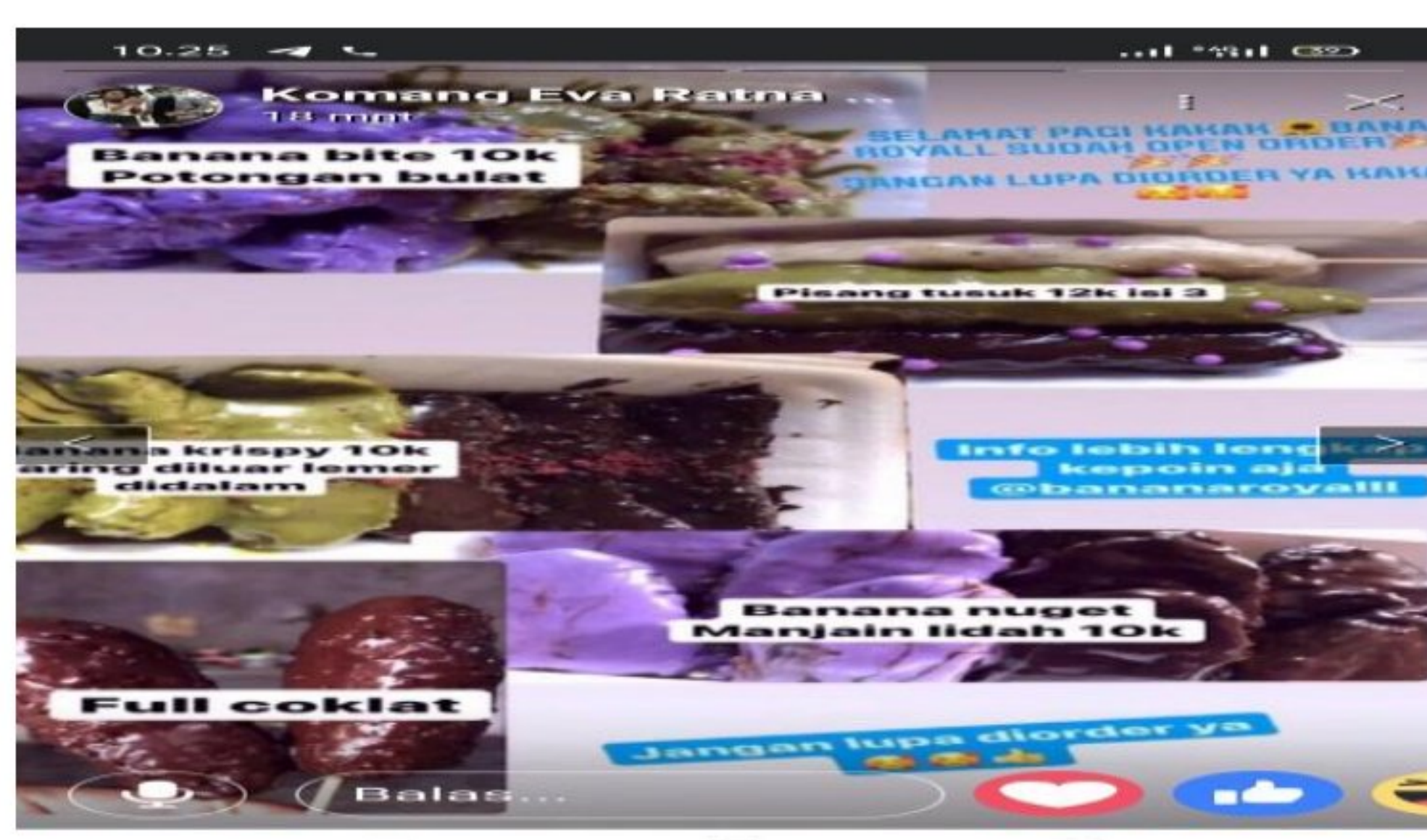
Gambar 1.2 Facebook Banana Royalll