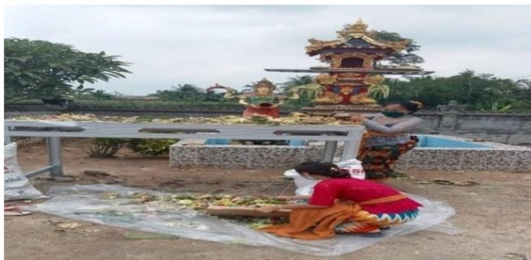
Gambar 1.7 Membersihkan Lingkungan Pura