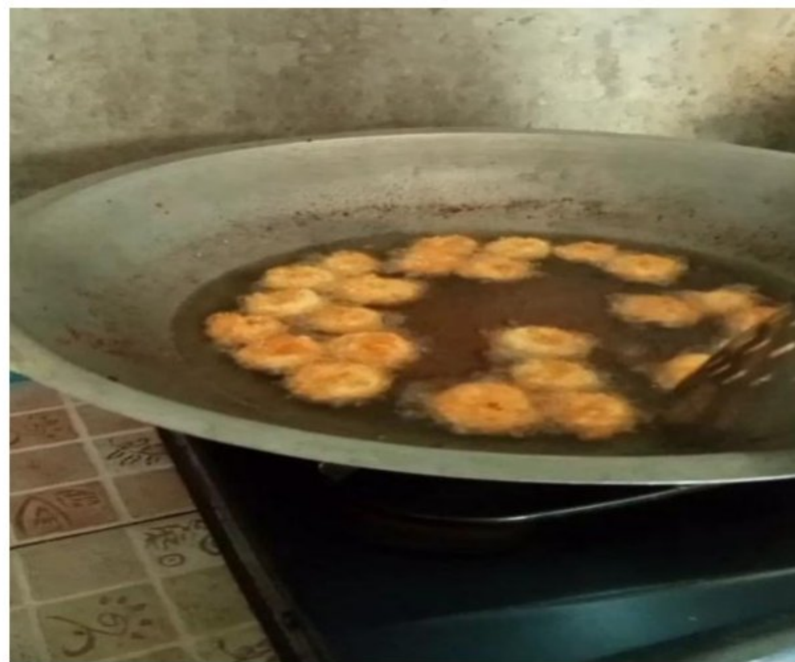
Gambar 1.13 Proses Penggorengan Banana Royal