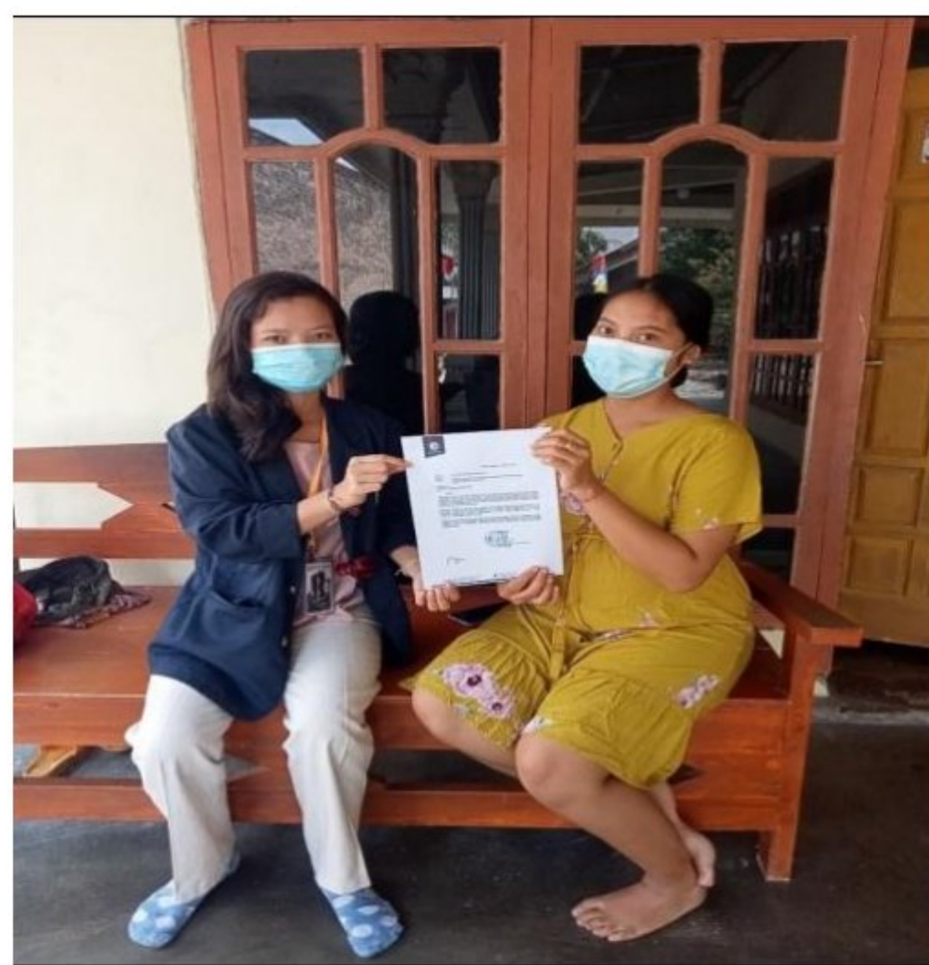
Gambar 1.10 Meminta izin Kepada Pemilik UMKM