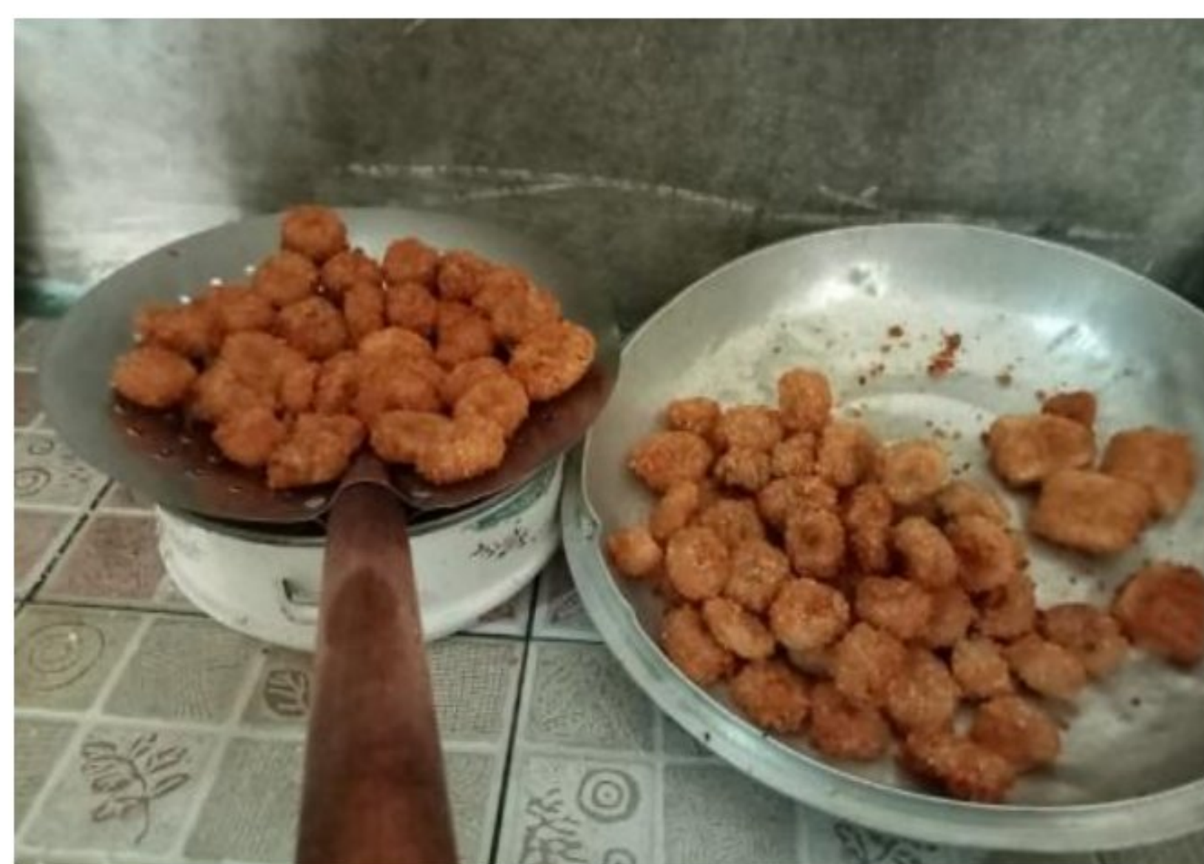
Gambar 1.14 Proses Pendinginan Setelah digoreng