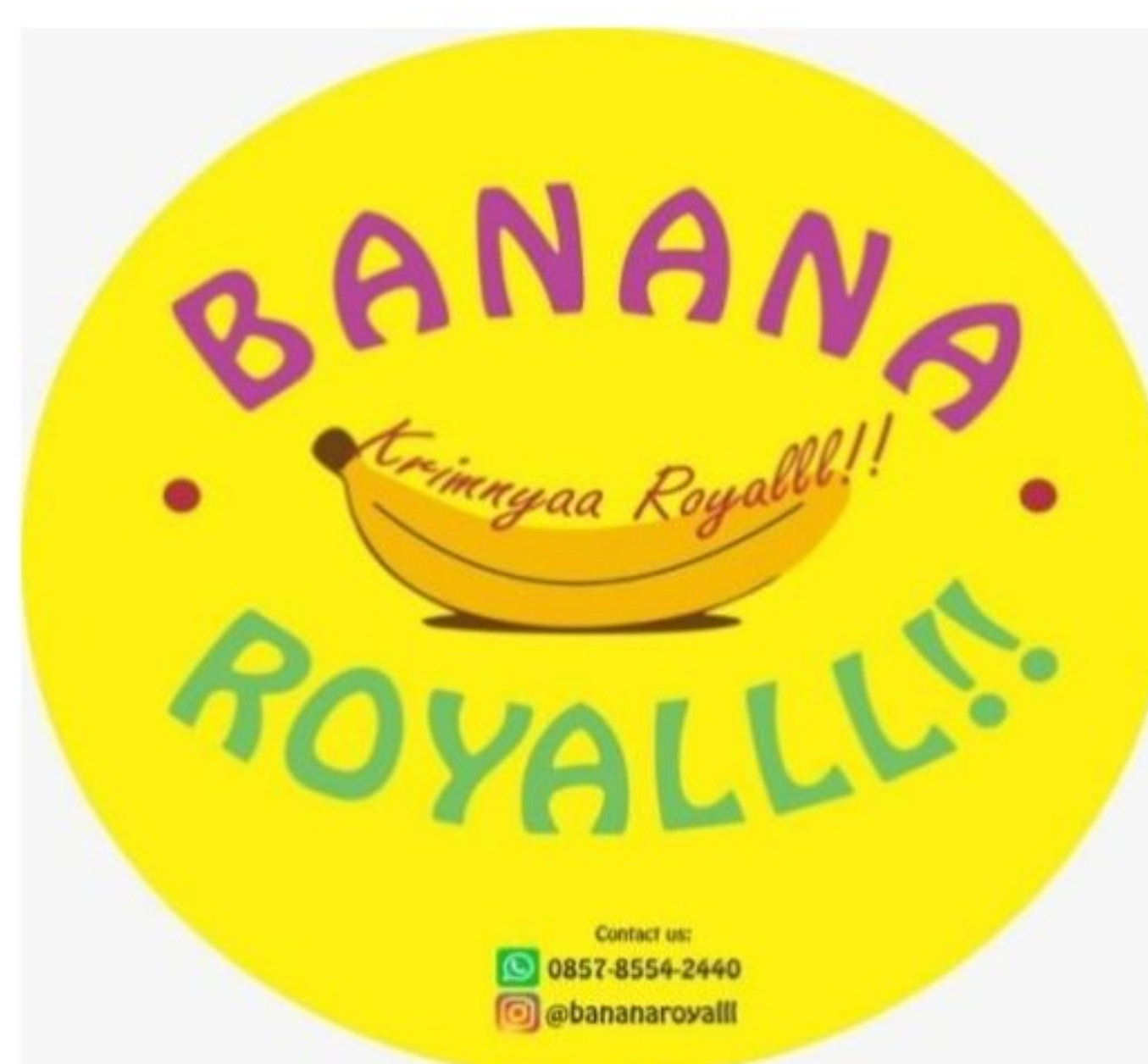
Gambar 1.4 logo Banana Royalll

Dengan adanya design merk bisa dijadikan sebagai sarana untuk mengembangkan produk salah satunya adalah promosi, sehingga dapat mempromosikan hasil produksi cukup dengan menyebut merk nya, dan juga sebagai jaminan atas mutu barang yang diperdagangkan serta merk juga menunjukkan asal barang tersebut dihasilkan.