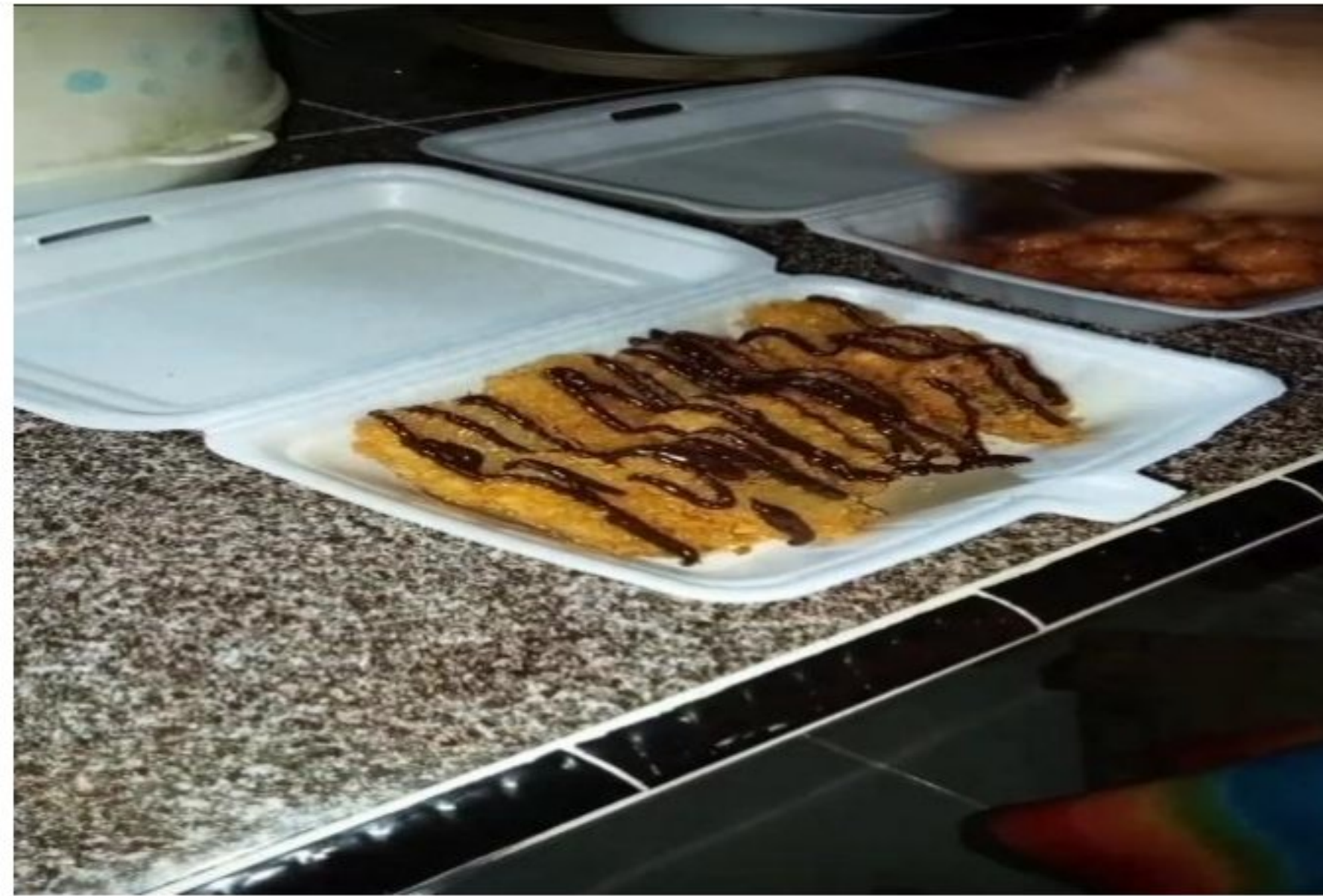
Gambar 1.15 Proses Pengemasan sekaligus Memberikan varian rasa coklat