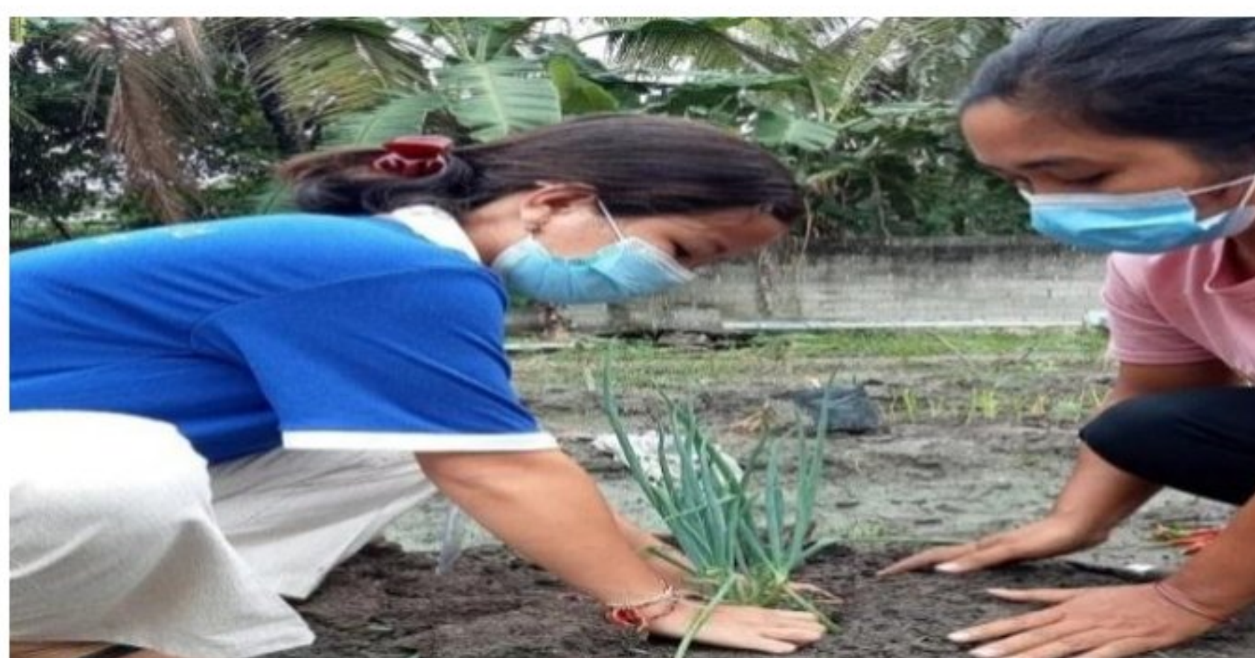
Gambar 1.6 Bercocok Tanam

Desa Balinuraga banyak mempunyai program desa seperti kegiatan bercocok tanam dan gotong royong, program –program tersebut membuat masyarakat desa Balinuraga menjadi lebih semangat lagi dalam melakukan kegiatan yang bermanfaat untuk desa masyarakat desa. Tujuan Penulis membantu program kerja yang ada di Desa Balinuraga agar program kerja tersebut berjalan dengan cepat dan baik dengan adanya bantuan Penulis Diharapkan Mampu Mengetahui kondisi yang ada di Desa Balinuraga agar Semakin Maju.