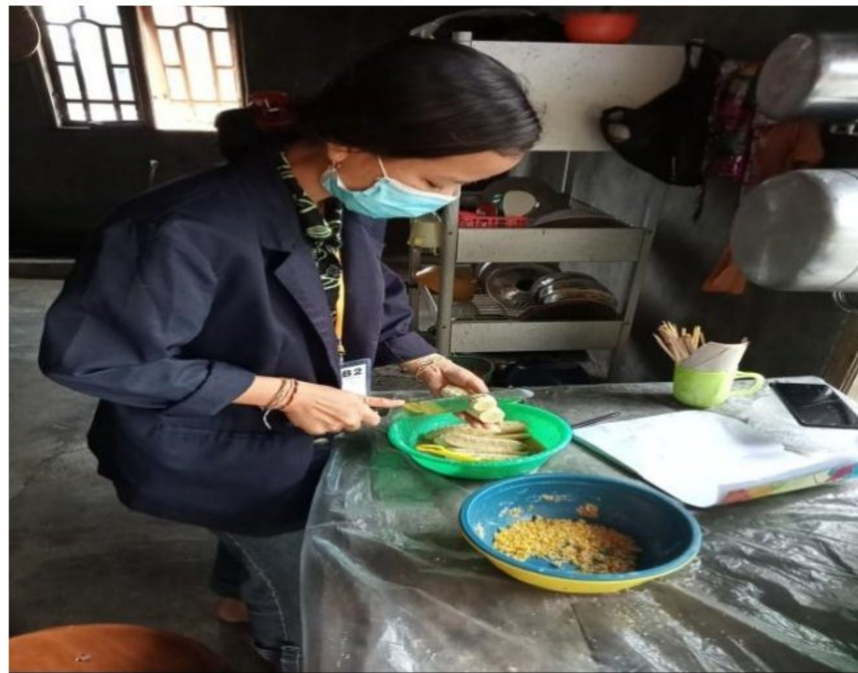
Gambar 1.12 Poses Pemotongan Pisang