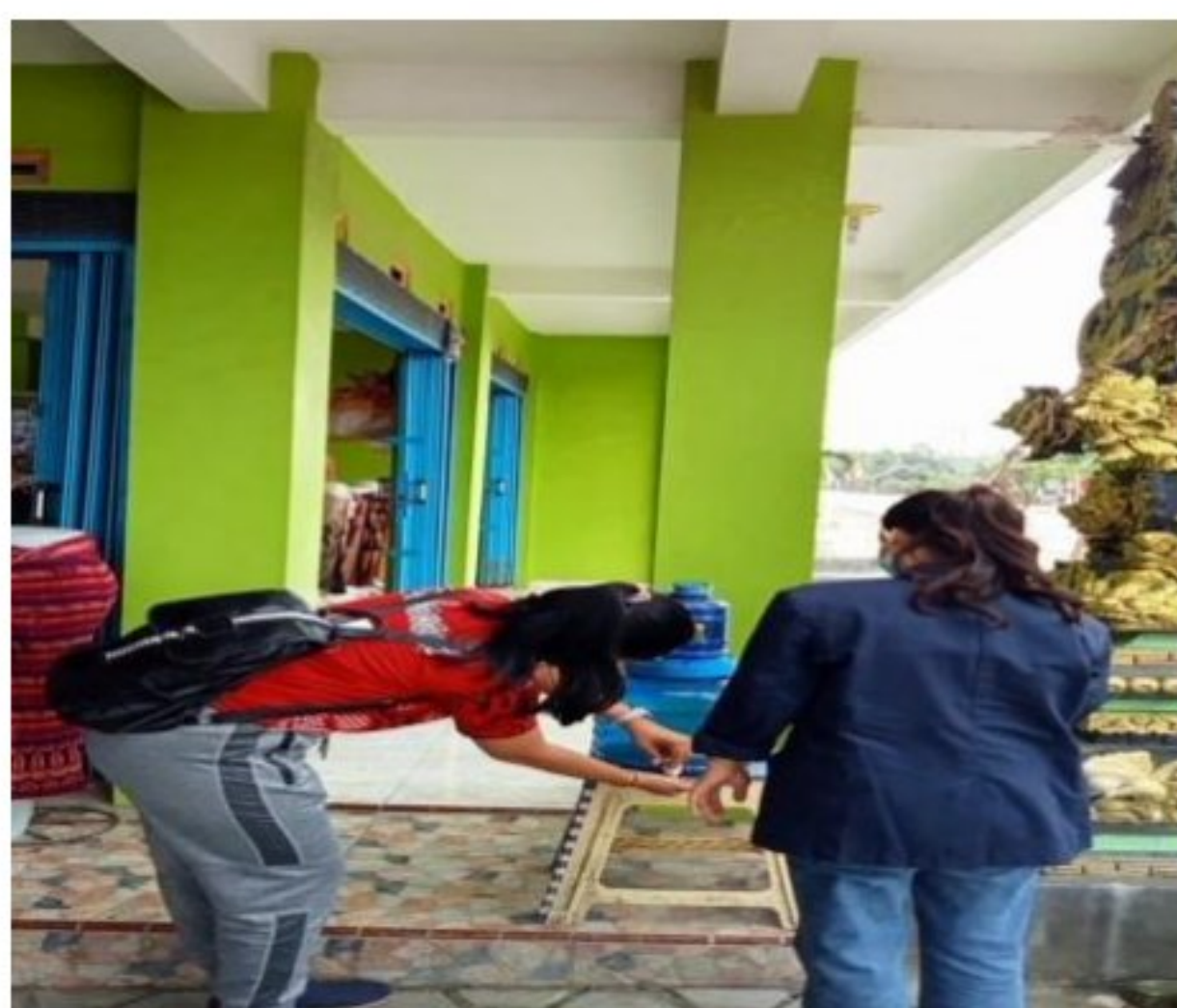
Gambar 1.5 Mencuci Tangan

Pemerintah. Oleh karena itu, Penulis berinisiatif mensosialisasikan Kepada Masyarakat Rumah akan bahaya COVID-19.