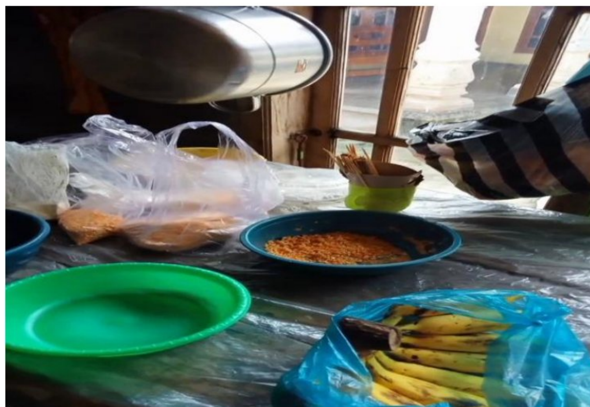
Gambar 1.11 Mempersiapkan Bahan-bahan Pembuatan Banana Royall