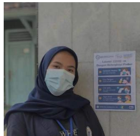
Gambar 12. Poster Covid-19

Menghimbau masyarakat sekitar tentang bahaya covid 19 untuk mengikuti protokol