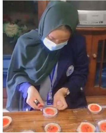
Gambar 7. Proses pengemasan kue pie

Sedang membantu proses membalurkan wijen di kue onde-onde dan juga mengemas kue pie ditempat pembuatan jajanan pasar