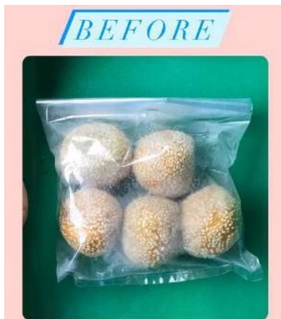
Gambar 8. Kemasan before

Sedang membantu proses membalurkan wijen di kue onde-onde dan juga mengemas kue pie ditempat pembuatan jajanan pasar