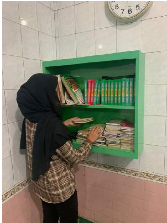
Gambar 33.. Merapihkan yasin dimasjid

Dokumentasi tasyakuran dan aqiqah anak warga sekitar lingkungan yang diadakan di Masjid Baitur Rahma