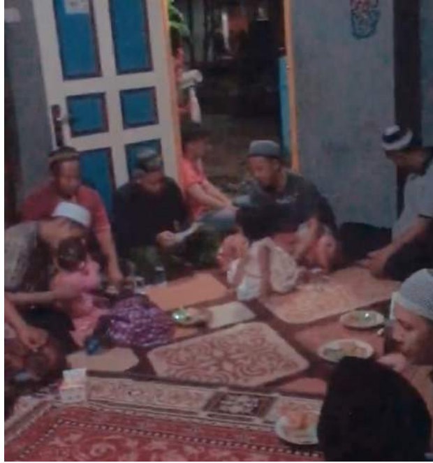
Gambar 31. pengajian

Pengajian ini dilaksanakan dilingkungan sekitar oleh warga-warga sekitar juga tiap dua minggu sekali