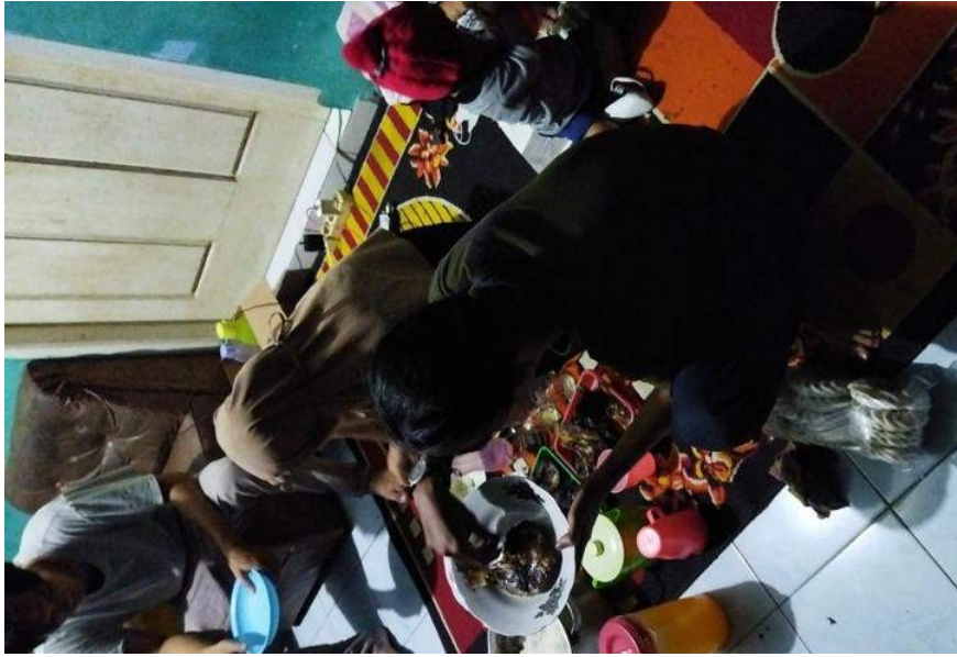
Gambar 27. Makan bersama

Selain bersama muda-mudi esok hari lingkungan sekitar kamu mengadakan bersama ibu-ibu dan juga bapak-bapak