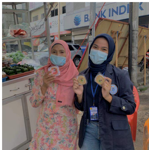
Gambar 5. Mengunjungi pemilik UMKM

Bergotong royong bersama muda mudi kaliawi untuk membersihkan masjid Baitur Rahma yg merupakan kegiatan rutin setiap hari jum'at diingkungan kaliawi, setiap harijum'at kegiatan itu rutin berlangsung, membersihkan masjid sampai dengan rumput mempersiapkan masjid untuk dipakai solat jum'at