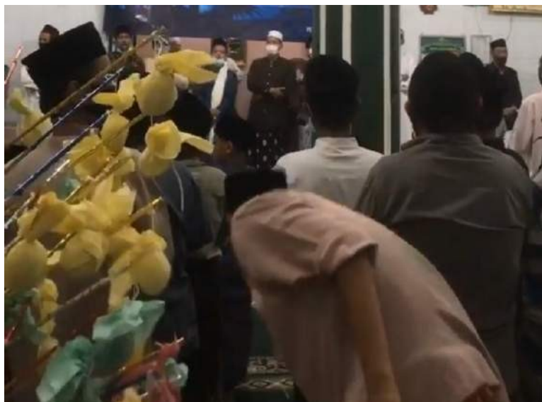
Gambar 32. Tasyakuran anak warga

Pengajian ini dilaksanakan dilingkungan sekitar oleh warga-warga sekitar juga tiap dua minggu sekali