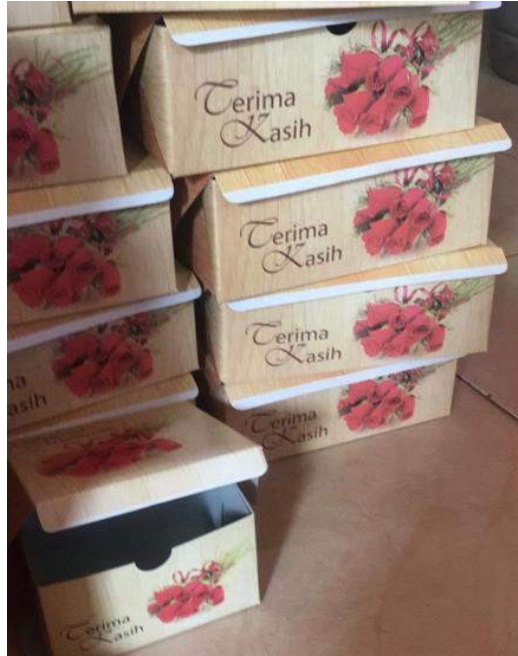
Gambar 30. pelipatan kotak

produksi ini diolah jika ada tetangga atau warga sebelah yang memesan kripik kentang mustofa