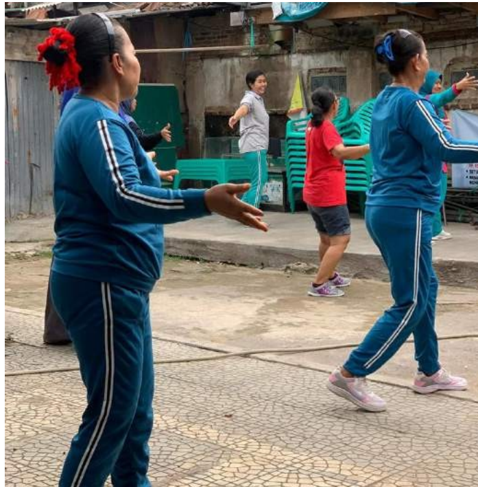
Gambar 24. Kegiatan senam

Dokumentasi penyebaran ulang poster langkah-langkah melawan covid 19 dilingkungan sekitar yang lebih sering orang lewat