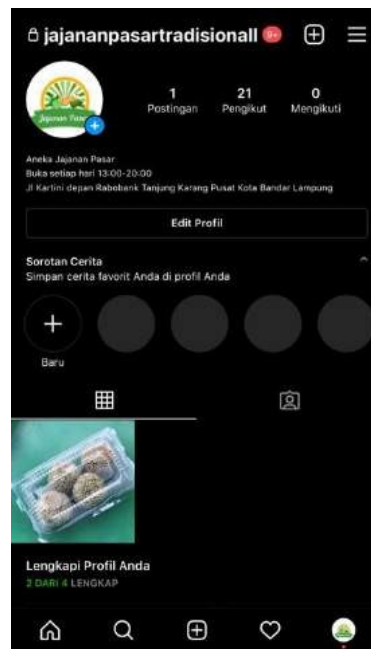
Gambar 10. Instagram jajanan pasar

Membuat akun media social khusus untuk umkm jajanan pasar guna mengoptimalkan promosi dan ketertarikan pembeli, melalui akses digital ini kita bisa melakukan penjualan melalu sistem online dengan begitu kita juga bisa memutus rantai penyebaran virus covid 19 karna pembeli tidak harus datang kelokasi penjualan