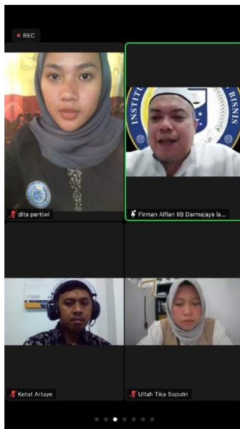
Gambar 35. pelepasan pkpm

Mengikuti kegiatan arisan pengajian yang dilaksanakan hanya ibu-ibu saja