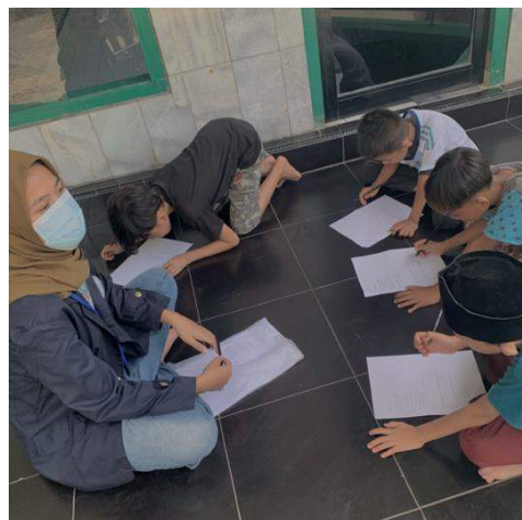
Gambar 3. Belajar bersama

Selasa, 17 Agustus 2021 ikut serta menjadi panitia lomba hari kemerdekaan, mengadakan berbagai macam lomba salah satunya adalah lomba makan kerupuk seperti yang ada digambar atas