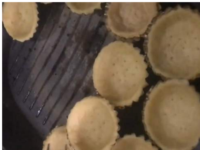
Gambar 15. Proses pemanggangan kue pie

Membantu guru ngaji di Tpa Ar-Rahman untuk mengajar anak-anak mengaji, pengajian ini rutin dilakukan dari hari senin sampai dengan hari sabtu