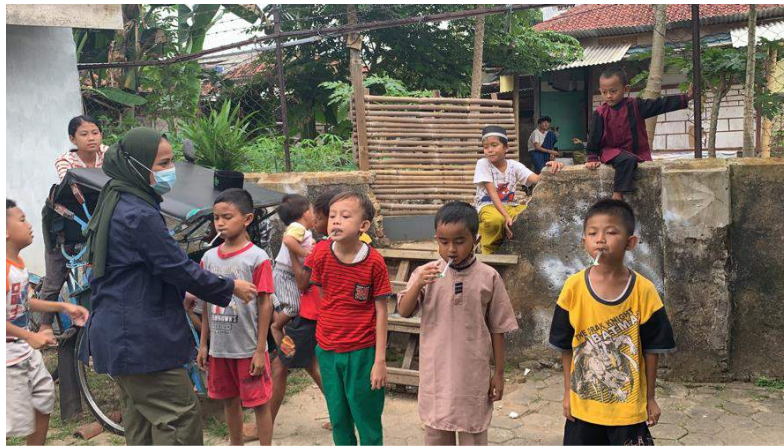
Gambar 20. Bermain sambil berlomba bersama anak-anak

Membantu pemilik UMKM mengantarkan pesanan donat didaerah gedong air kerumah pemilik pesanan