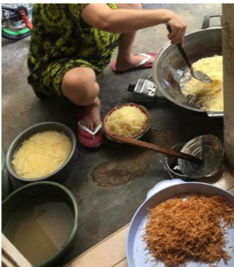
Gambar 28. proses mengolah kentang

Selain bersama muda-mudi esok hari lingkungan sekitar kamu mengadakan bersama ibu-ibu dan juga bapak-bapak