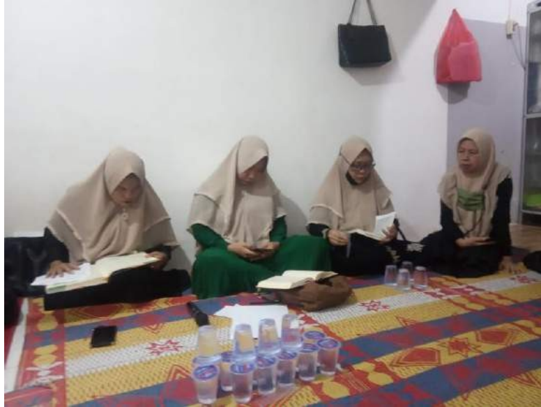
Gambar 34. Pengajian

Mengikuti kegiatan arisan pengajian yang dilaksanakan hanya ibu-ibu saja