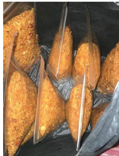
Gambar 29. Kentang siap dikirim

Membantu bu Rt memproduksi pengolahan kentang menjadi keripik kentang sambel