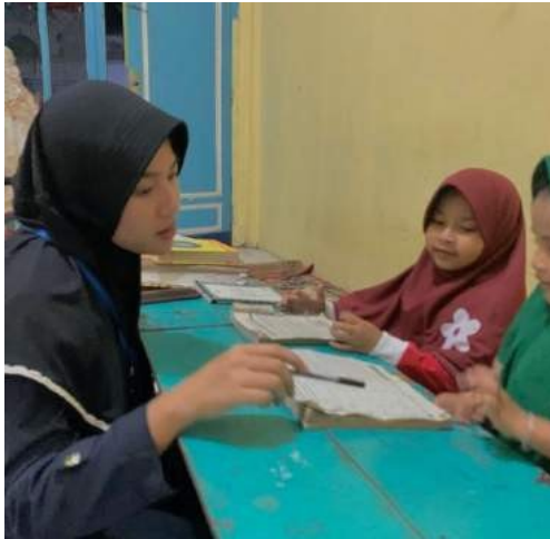
Gambar 13. Mengajar mengaji

kesehatan dengan menempel poster langkah-langkah melawan covid 19 dilingkungan sekitar