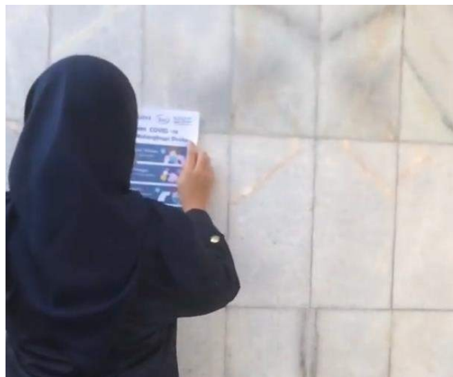
Gambar 23. Penyebaran ulang poster covid 19

Gambar anak-anak diatas adalah dokumentasi kegiatan pendampingan belajar mereka dilingkungan sekitar agar tidak lupa dengan pelajaran karna sudah lama belajar daring