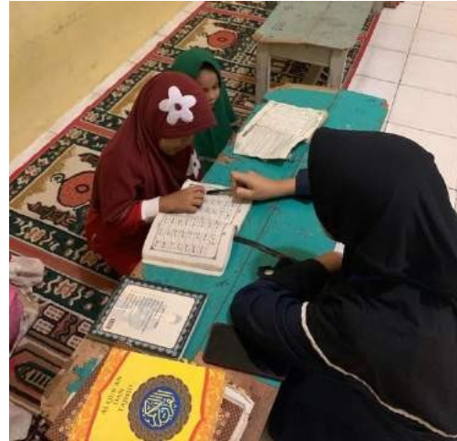
Gambar 14. Mengaji bersama anak-anak

Membantu guru ngaji di Tpa Ar-Rahman untuk mengajar anak-anak mengaji, pengajian ini rutin dilakukan dari hari senin sampai dengan hari sabtu