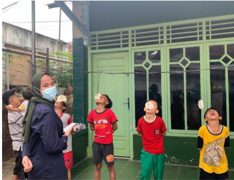
Gambar 2. Panitia hari kemerdekaan

Selasa, 17 Agustus 2021 ikut serta menjadi panitia lomba hari kemerdekaan, mengadakan berbagai macam lomba salah satunya adalah lomba makan kerupuk seperti yang ada digambar atas