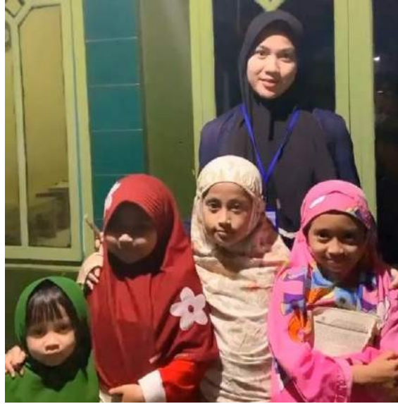
Gambar 25. Pengajian rutin

Dokumentasi selesai mengaji, selama kegiatan PKPM saya membantu guru ngaji di Tpa Ar-Rahma untuk mengajar mengaji disini