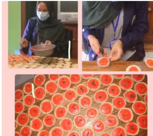
Gambar 16. membantu penuangan dan pengemasan kue pie

Kembali ke home industri UMKM jajanan pasar untuk membantu membuat kue yang lain yaitu memanggang kue pie