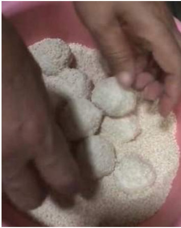
Gambar 6. Proses pembuatan kue onde-onde