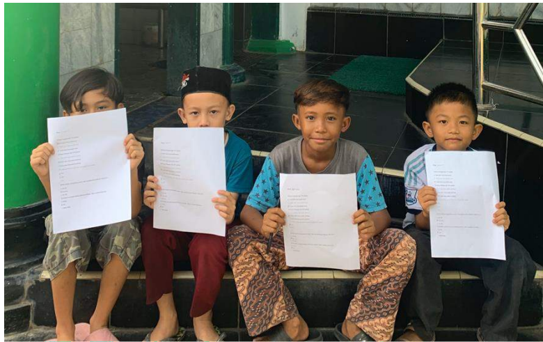
Gambar 22. Pendampingan belajar anak-anak sekitar

Memberikan makanan atau jajanan untuk anak-anak yang sudah bermain dan berlomba, mendapat hadiah sesuai dengan urutan juara yang mereka menangkan