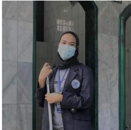
Gambar 4. Membersihkan masjid

Bergotong royong bersama muda mudi kaliawi untuk membersihkan masjid Baitur Rahma yg merupakan kegiatan rutin setiap hari jum'at diingkungan kaliawi, setiap harijum'at kegiatan itu rutin berlangsung, membersihkan masjid sampai dengan rumput mempersiapkan masjid untuk dipakai solat jum'at