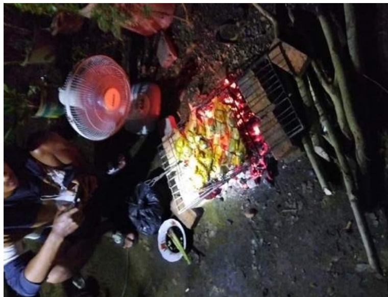
Gambar 26. bakaran bersama muda mudi

Dokumentasi selesai mengaji, selama kegiatan PKPM saya membantu guru ngaji di Tpa Ar-Rahma untuk mengajar mengaji disini