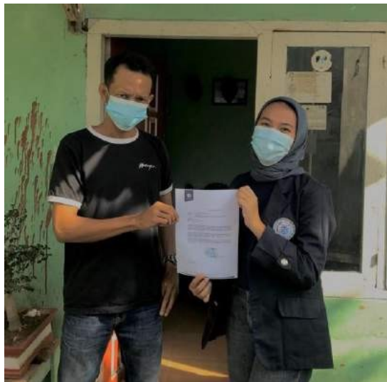
Gambar 1. Izin kepada ketua RT

Senin, 16 Agustus 2021. Bersama Ketua RT 002 Kaliawi untuk meminta izin bahwa akan melaksanakan PKPM di wilayah sekitar