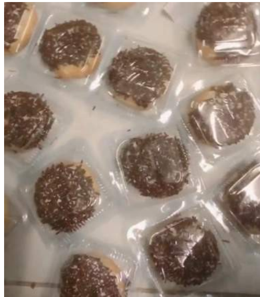
Gambar 18. Donat yang telah di kemas

Kegiatan hari ini adalah membuat donat goreng, di UMKM jajanan pasar ini donat goreng tidak diproduksi setiap hari, donat akan diproduksi jika ada yang memesan saja