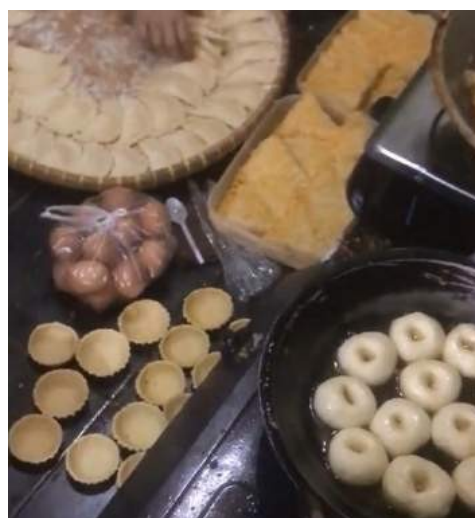
Gambar 17. Proses penggorengan donat

Proses yang dilakukan setelah pemanggangan adalah menuang topping ke dalam lengkungan kue pie tunggu sebentar hingga agak dingin lalu kemas kembali kue pie tersebut