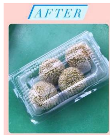
Gambar 9. Kemasan after