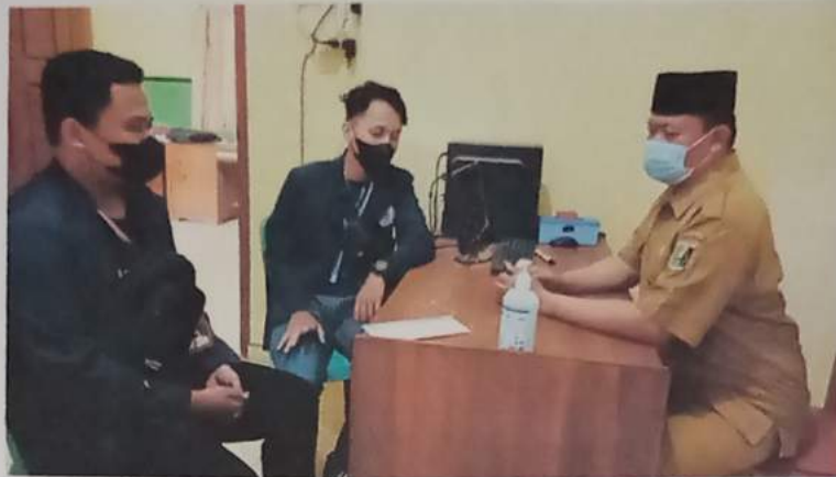
Gambar 6 : meminta izin sekaligus menyerahkan surat pengantar kepada kepala desa Gedung Wani Timur