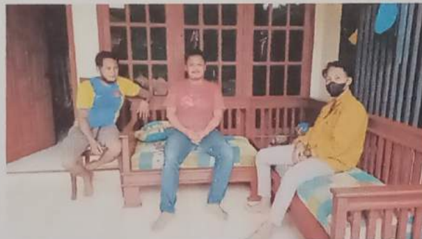
Gambar 5 :silaturahmi dan meminta izin kepada kepala dusun sukajadi