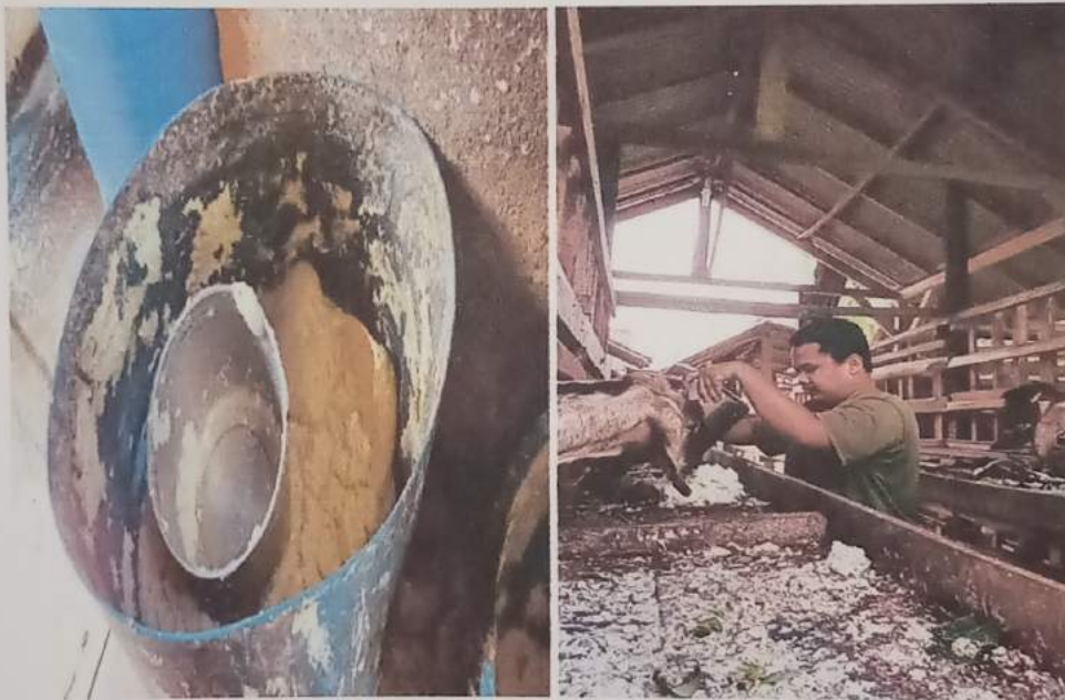
Gambar 2.2 : pemanfaatan ampas tahu menjadi pakan ternak

Salah satu program kerja yang telah saya selesaikan ialah memanfaatkan ampas tahu sebagai pakan ternak milik warga, karena saya melihat ampas tahu yang bisa dimanfaatkan dibuang begitu saja dan menjadi sampah yang bau sehingga mengganggu tetangga sekitar rumah produksi tahu, dan melihat begitu banyak warga yang memelihara ternak, saya coba memanfaatkan ampas tersebut sebagai pakan ternak dan hasilnya cukup memuaskan, ternyata ampas tahu yang dibuang begitu saja bisa dimanfaatkan sebagai pakan ternak, dan menambah keuntungan pemilik umkm tahu tersebut, karena ampas tersebut dijual kepada peternak