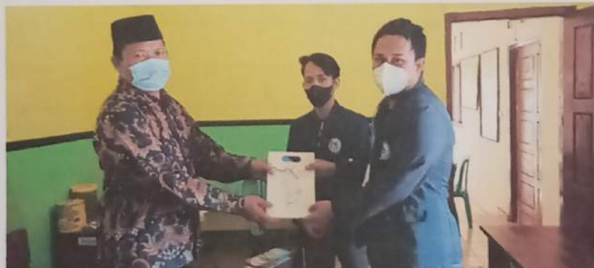
Gambar 17 : penyerahan kenang – kenangan berupa plakat sekaligus berpamitan kepada kepala desa Gedung Wani Timur