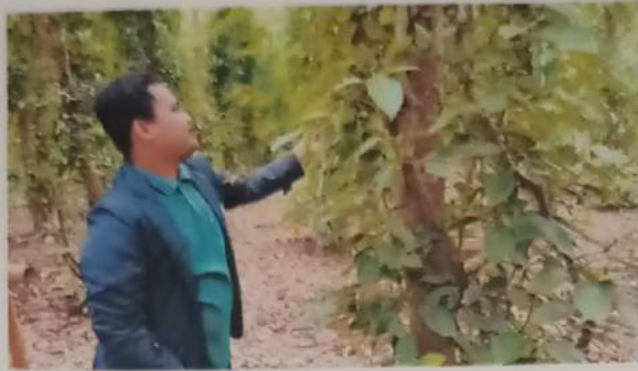
Gambar 15 : membantu petani lada memanen lada