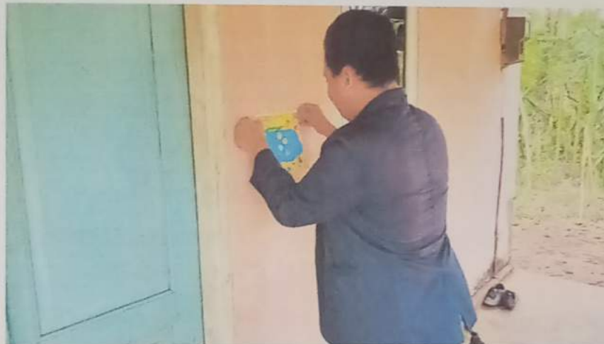
Gambar 14 : pemasangan poster tentang protokol kesehatan