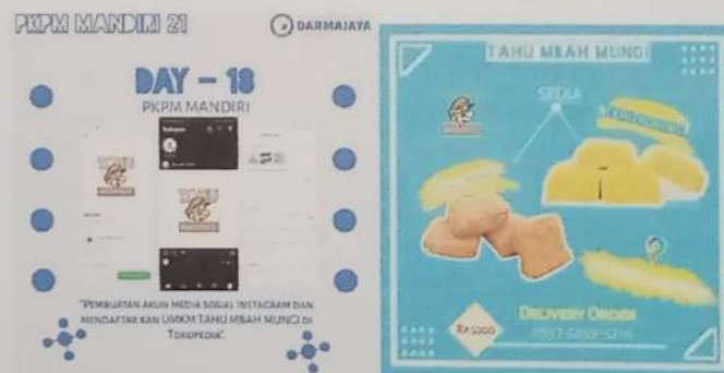
Gambar 2.1 : Pembuatan akun instagram dan tokopedia sekaligus pembuatan pamflet promosi

Sesuai dengan program kerja yang telah saya buat di awal, salah satu tujuan utama dari kedatangan saya ialah mengembangkan strategi pemasaran dimasa pandemi COVID-19 pada UMKM Tahu Mbah Mungi berbasis e-commerce didesa Gedung Wani Timur.