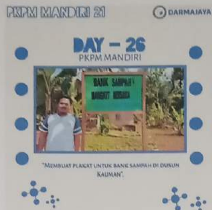
Gambar 2.3 : Pembuatan plakat untuk bang sampah di desa gedung wani timur

Timur Sangat mendukung adanya bank sampah ini, karena dapat mengurangi resiko menumpuknya sampah dilingkungan rumah warga.