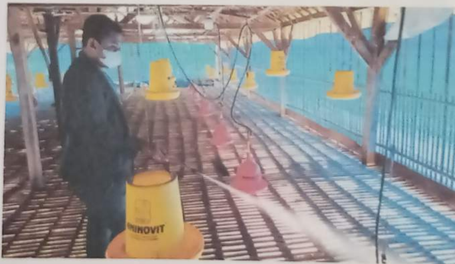
Gambar 10 : membantu membersihkan kandang ayam potong sebelum