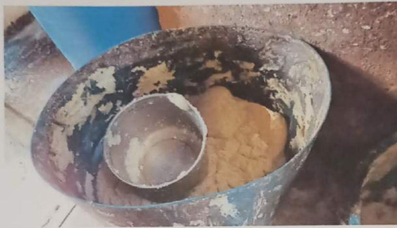
Gambar 16 : memanfaatkan ampas tahu sebagai pakan ternak warga