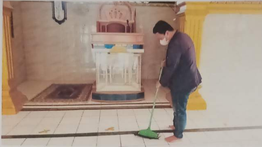
Gambar 11 : membantu membersihkan masjid sebelum dipakai shalat jumat berjamaah