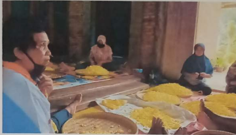
Gambar 13 : berkunjung ke UMKM klaning Family dan belajar proses pembuatannya