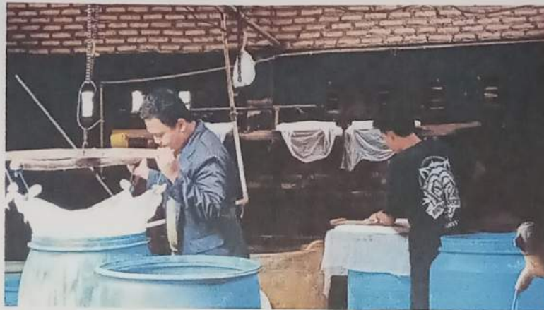
Gambar 7 : survey tempat UMKM