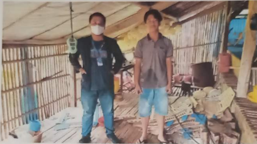
Gambar 9 : survey ketempat usaha ayam potong milik pengusaha muda di desa Gedung Wani Timur