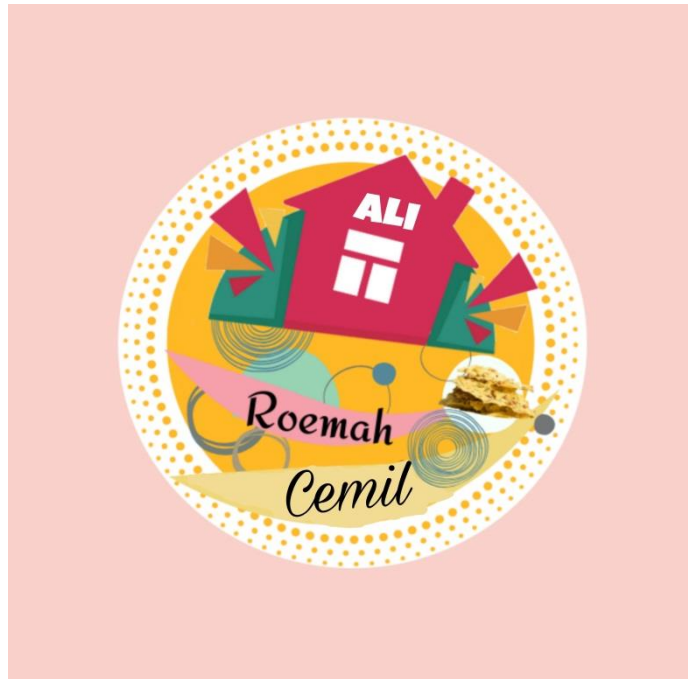
Gambar 2.3 Membuat Logo UMKM.