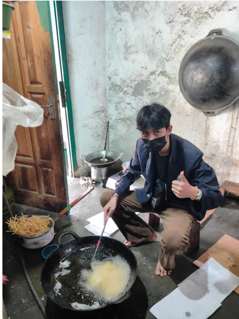
Gambar 2.4 Membantu kegiatan produksi