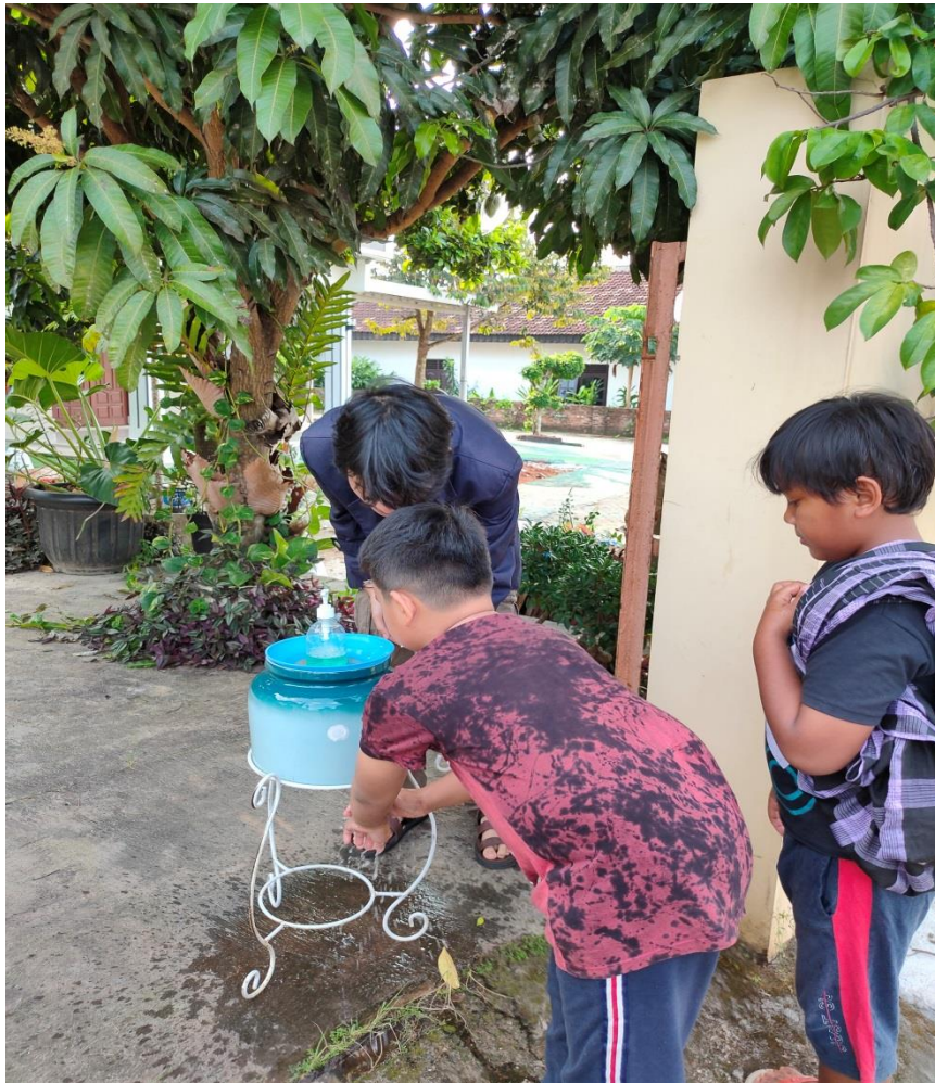
Gambar 2.5 Memberi himbauan kepada anak-anak