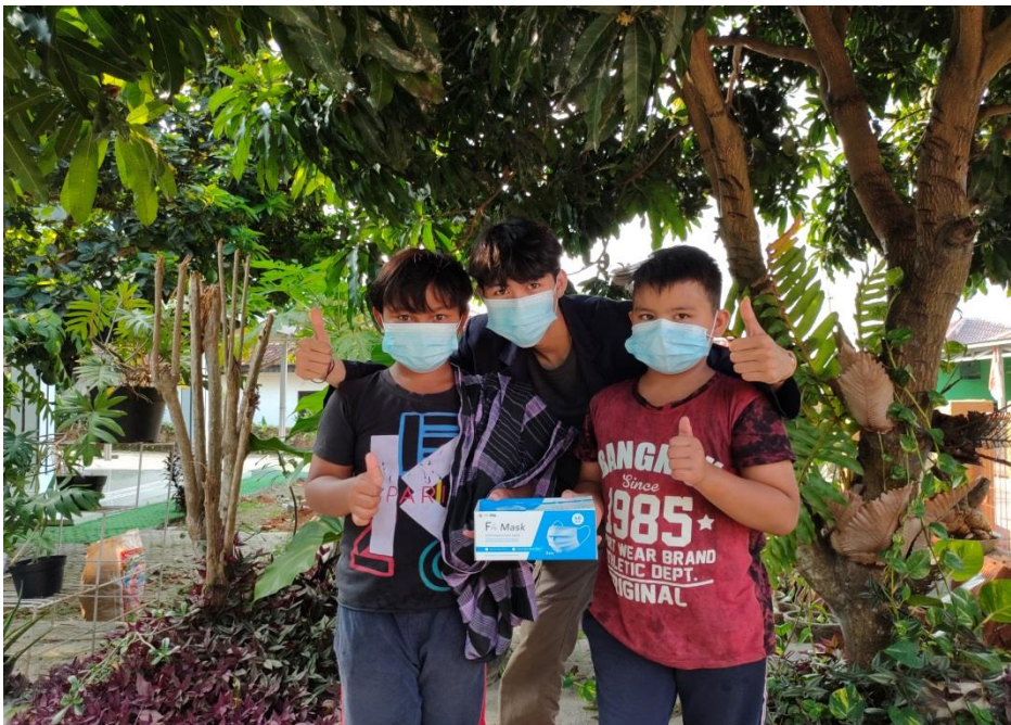
Gambar 2.6 Membagikan masker kepada pemuda dan anak-anak setempat