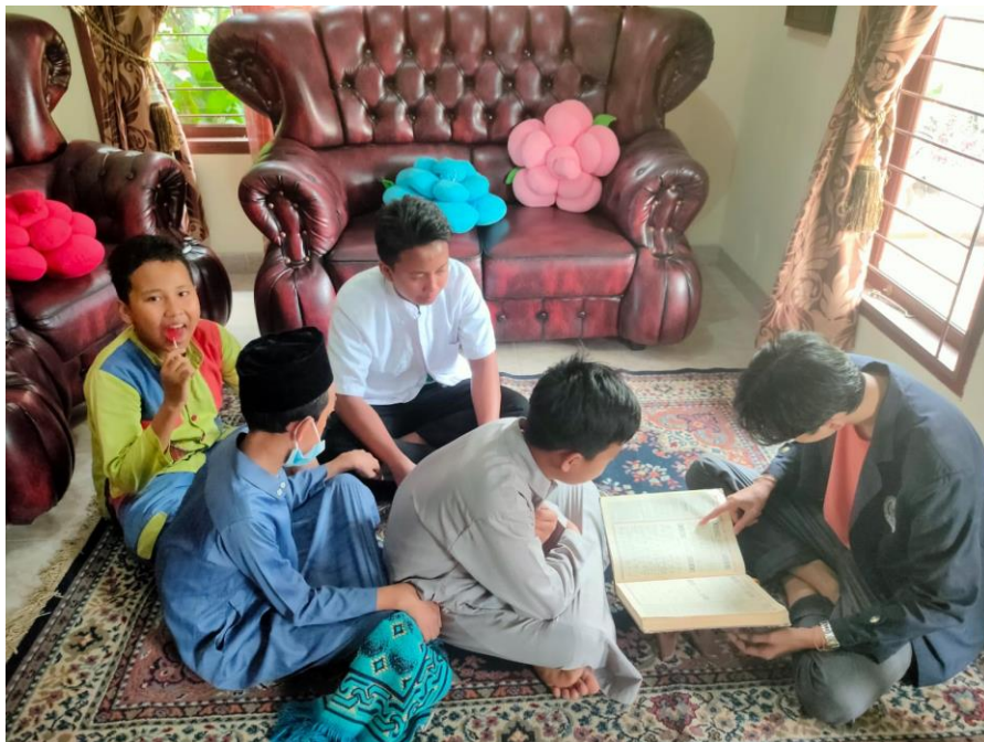
Gambar 2.7 Mendampingi anak-anak setempat membaca Al-Quran

Dalam kondisi pandemi saat ini anak-anak sekolah daring sehingga anak belajar dari rumah menyebabkan anak lebih malas dan terlalu banyak waktu luang karena tidak perlu datang ke sekolah sehingga waktu habis digunakan untuk bermain, maka saya menghimbau dan membantu anak-anak untuk melakukan hal-hal positif salah satunya membaca Al-Quran.