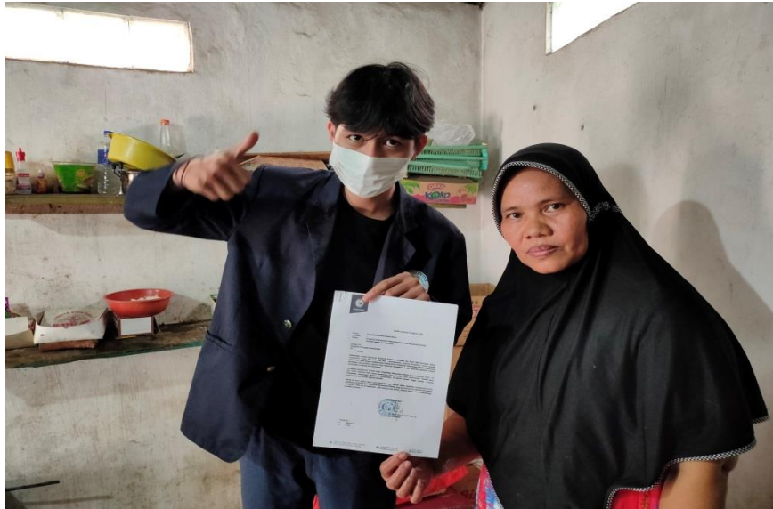
Gambar 2.1 Wawancara terhadap pemilik UMKM