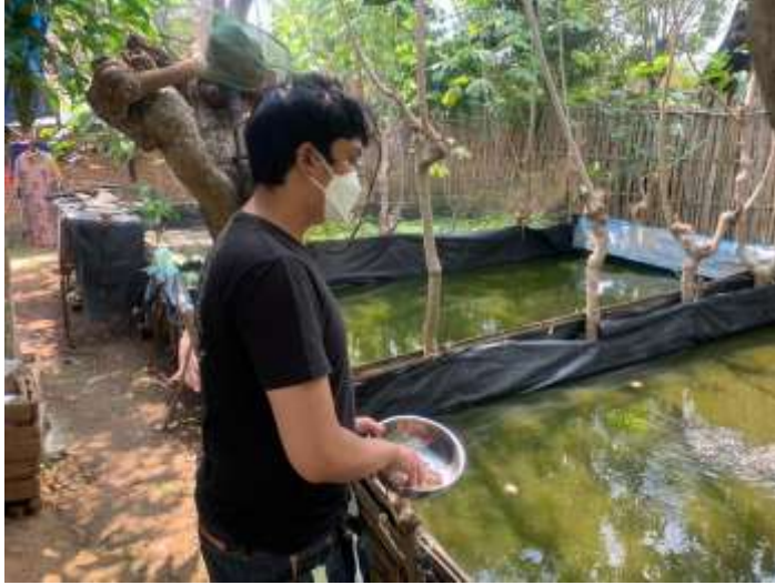
Pemberian Makan Ikan Nila