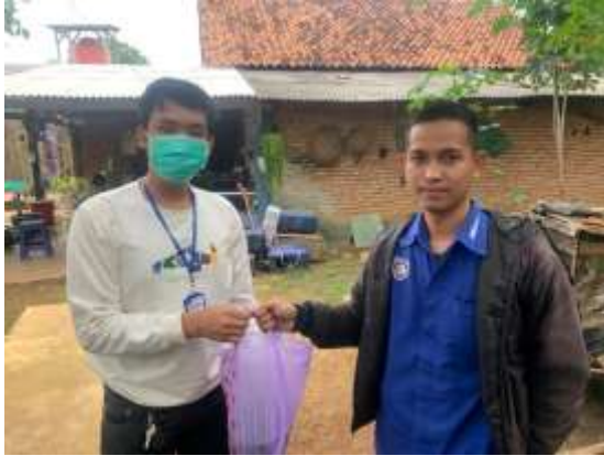
Melayani Pembelian lele konsumsi 80 Kg