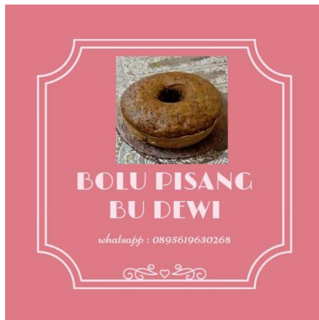
Gambar 2.6 Pembuatan Logo

Desain logo sangat sering diabaikan saat pendirian UMKM. Diabaikannya ini karena pada skala usaha yang masih kecil, penjualan mendapatkan porsi lebih banyak dalam aktivitas sehari-hari. Padahal logo merupakan bagian yang tidak dapat dipisahkan dari strategi branding perusahaan.