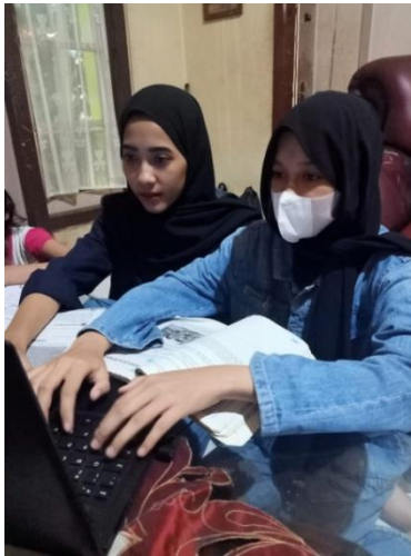
Gambar 2.11 Pendampingan Belajar