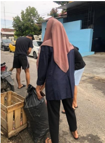
Gambar 2.12 Kegiatan Gotong Royong