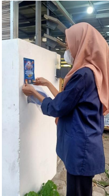
Gambar 2.4 Pemasangan Poster