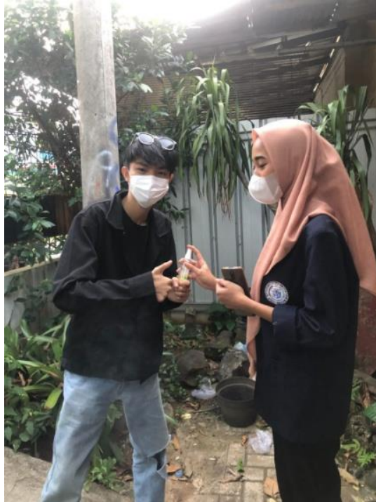
Gambar 2.3 Pembagian Handsanitizer