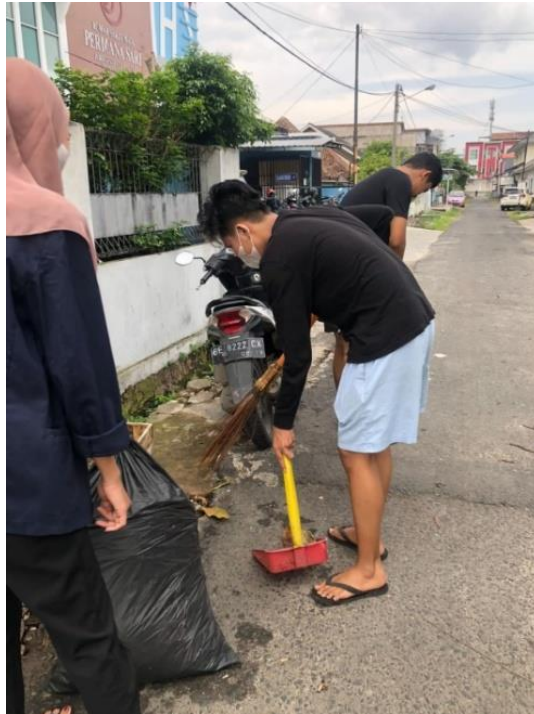
Gambar 2.7 Gotong Royong

Kegiatan gotong royong adalah suatu upaya yang dilakukan untuk meningkatkan rasa saling peduli dan tolong menolong. Gotong royong membersihkan lingkungan juga dapat menjadi salah satu cara untuk melindungi diri dari berbagai virus, apabila lingkungan sekitar kita bersih tentu akan tercipta keadaan fisik yang baik pula. Selain itu kegiatan ini pula memberikan dampak positif seperti menjadikan tubuh berolah raga dan menjadi lebih sehat, kegiatan membersihkan lingkungan di mulai dari lingkungan sekitar. Kegiatan ini juga mengikut sertakan masyarakat sekitar untuk melakukan kerja sama.