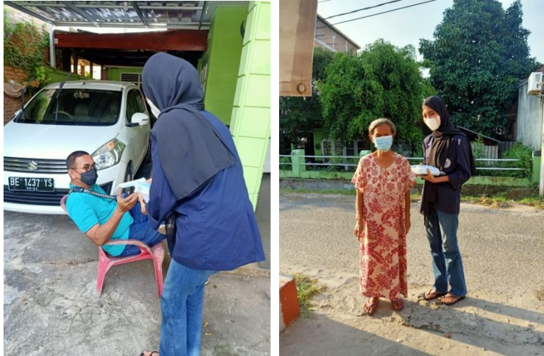
Gambar 2.10 Pembagian Masker