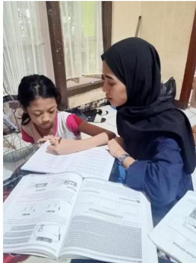
Gambar 2.5 Pendampingan Belajar