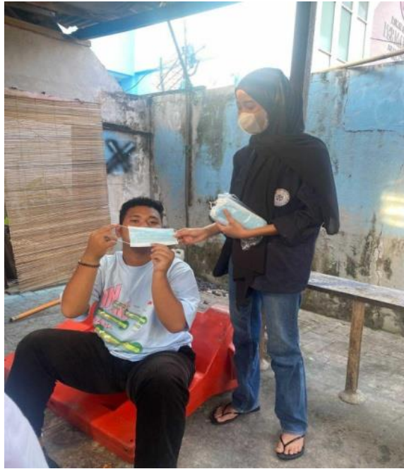
Gambar 2.2 Pembagian Masker