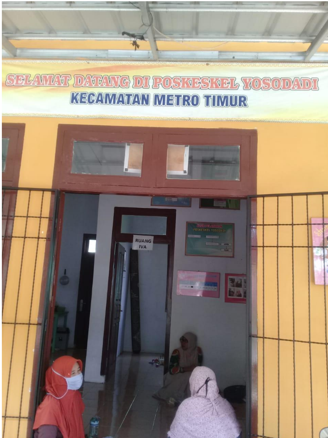
Gambar 1. Kantor Kecamatan Metro timur