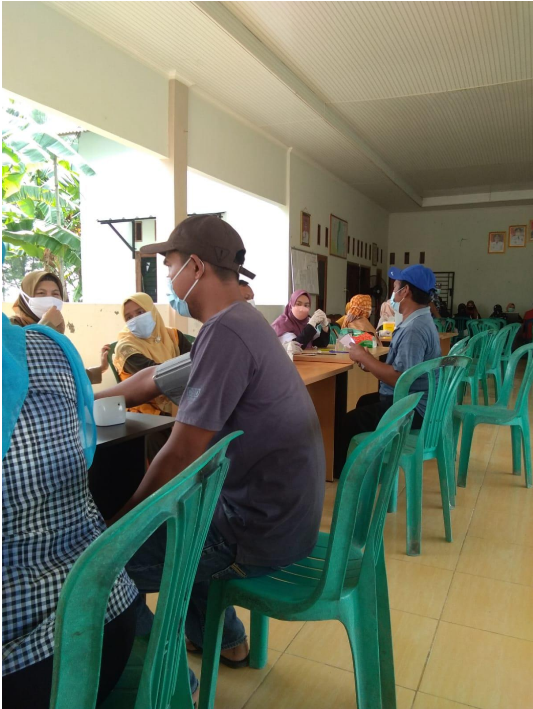
Gambar 4 : Pelaksanaan Vaksin Covid 19 di Desa Yosodadi Kec.Metro Timur