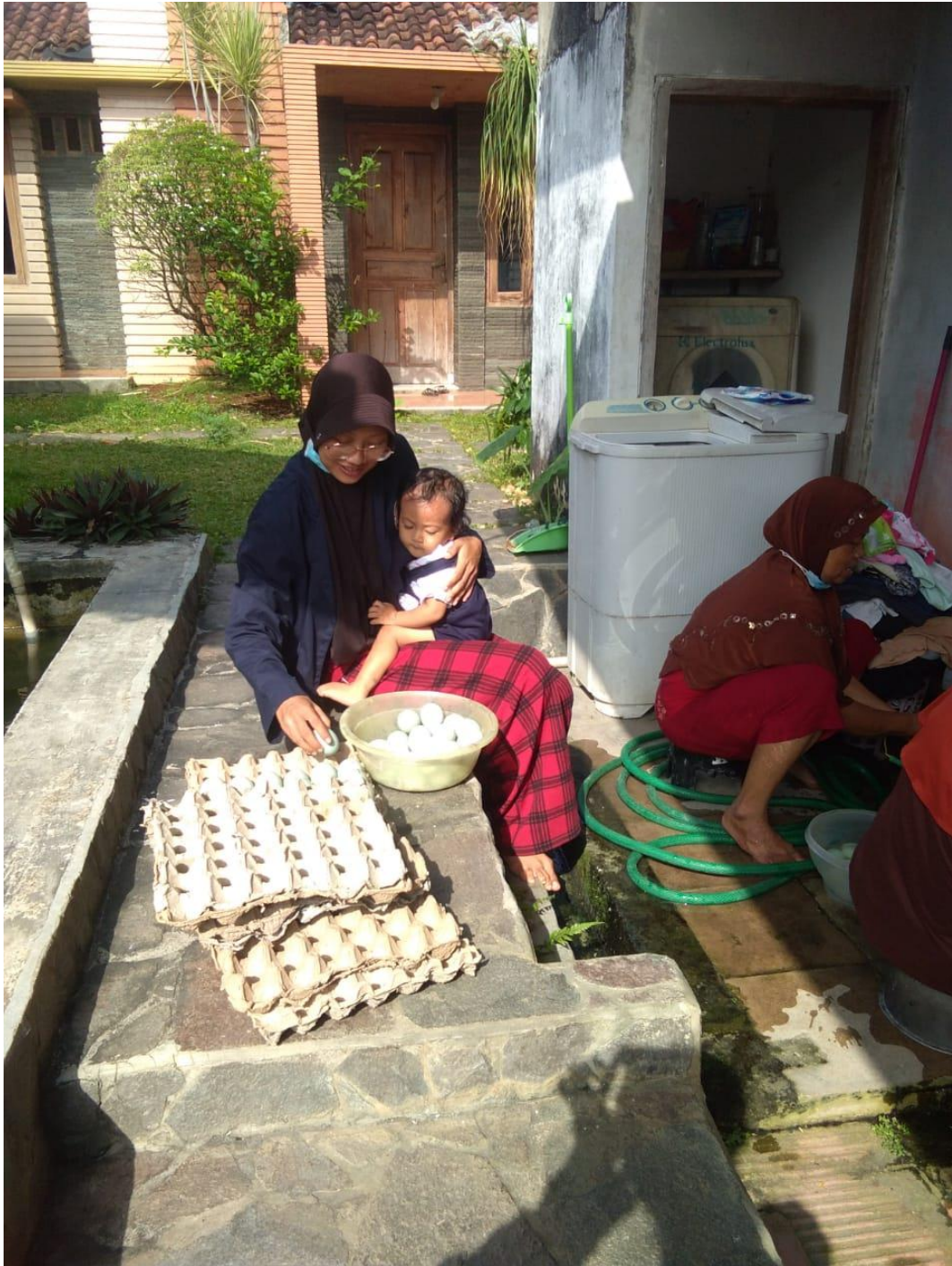
Gambar 3 : Membantu Pembuatan Telor asin Di desa Yosodadi Kec.Metro Timur