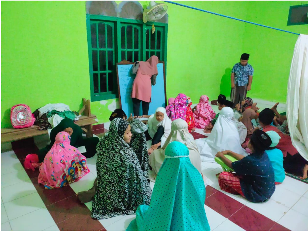
Gambar 2 . mengajar ngaji anak-anak TPA masjid Al-Hikmah Desa yosodadi Kec.Metro Timur