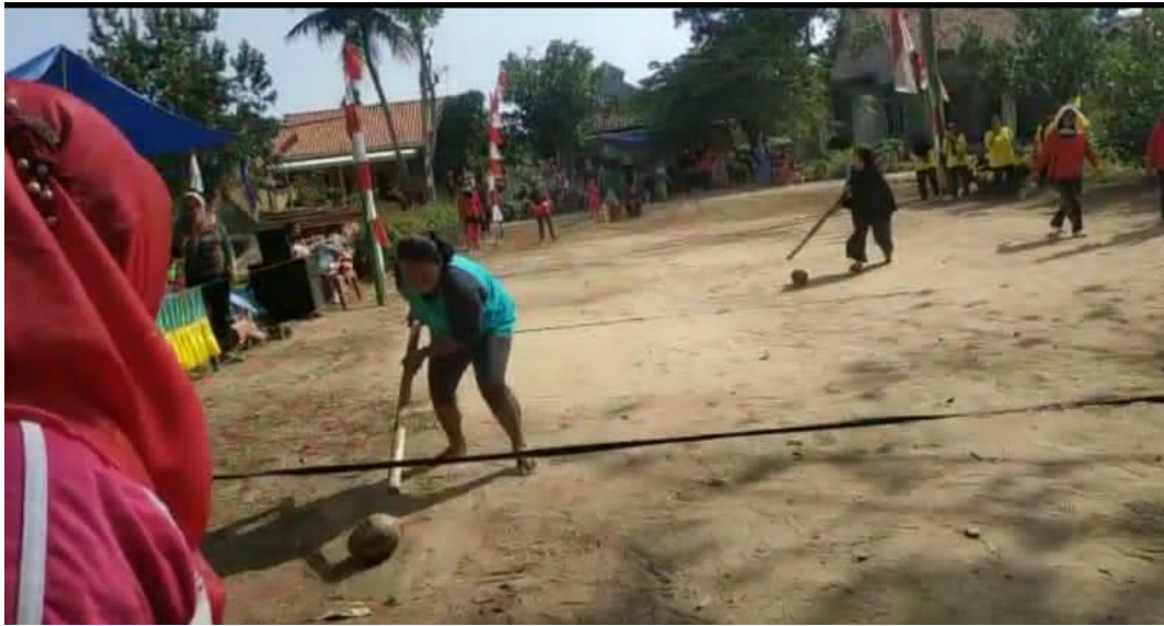
Gambar 5 : pelaksanaan 17 agustus di desa Yosodadi Kec.Metro timur