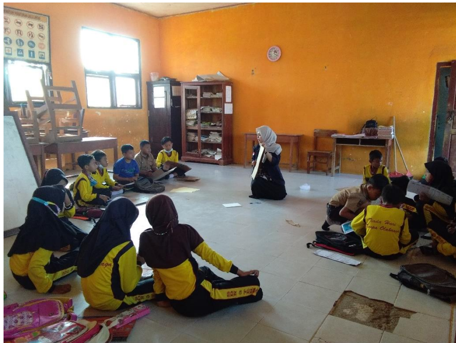
Praktik membuat kreatifitas dari kardus bekas