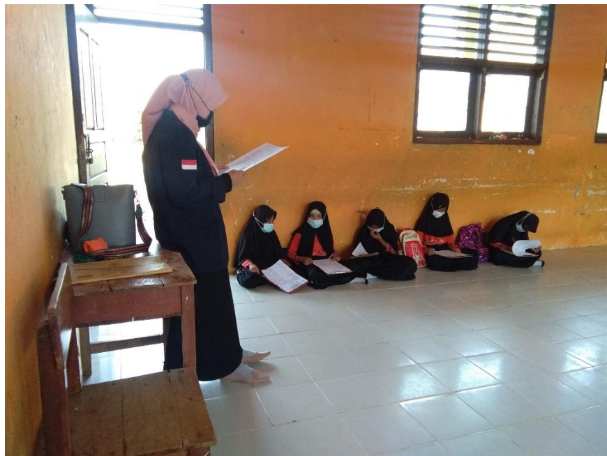
Mengawas jalannya ulangan kenaikan