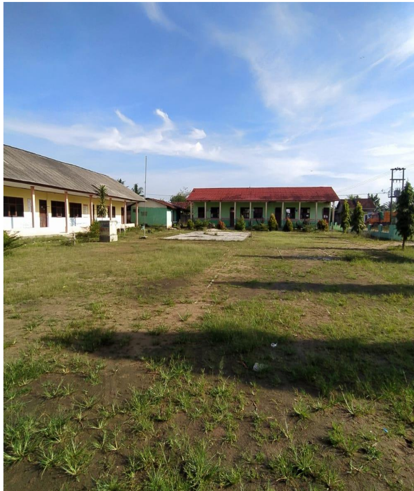
Observasi lingkungan sekolah