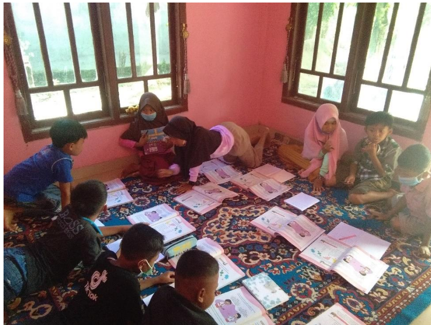
Diskusi dalam kelompok