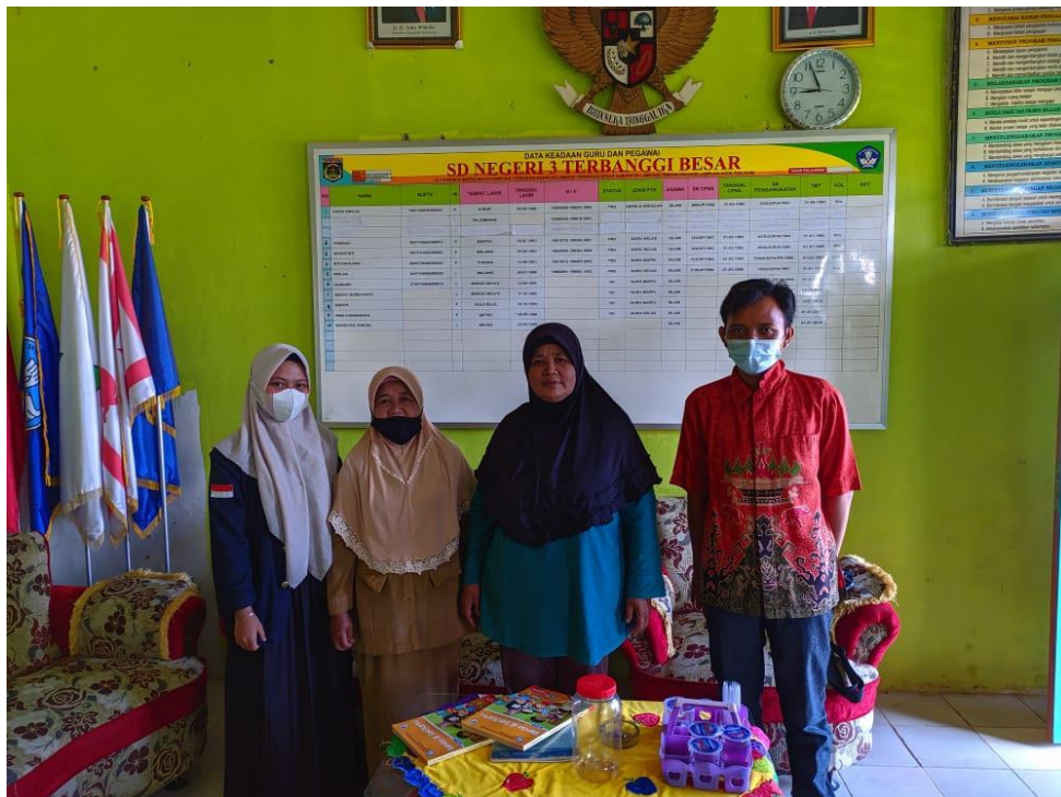
Penerimaan Mahasiswa oleh SDN 3 Terbanggi Besar. (diwakili oleh PLT Kepala Sekolah dan salah satu guru).