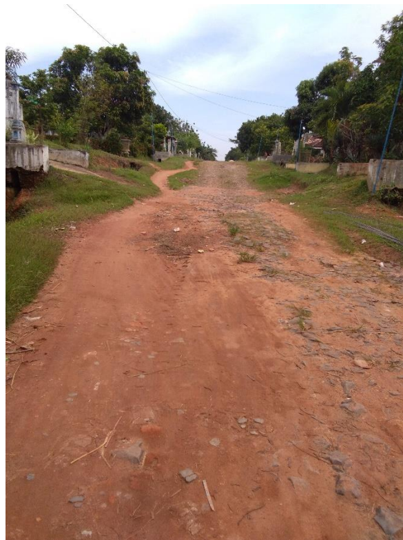
Gambar jalan menuju sekolah