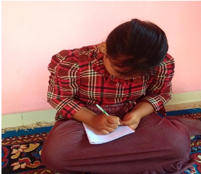
Pembelajaran tambahan bagi siswa yang belum bisa membaca