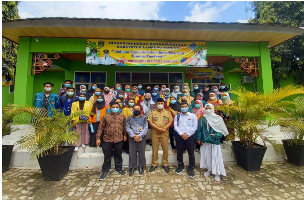
Pengarahan serta penyampaian pesan dari pihak Dinas Pendidikan dan Kebudayaan Lampung Tengah.