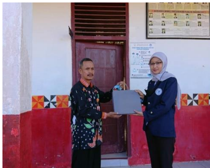
Dok.penyerahan kenang-kenangan ke sekolah