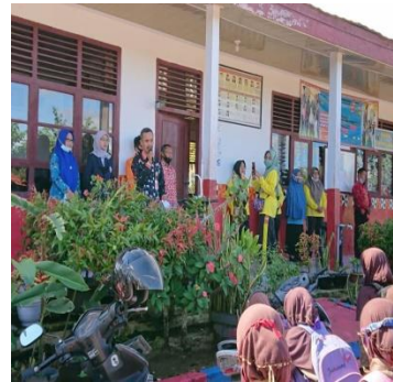
Dok. Perpisahan mahasiswa