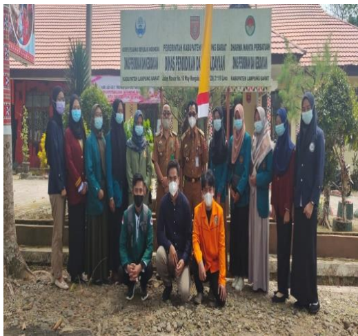
Dok. Dengan kepala dinas