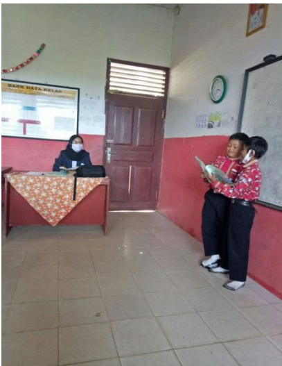
Dok. Kegiatan belajar