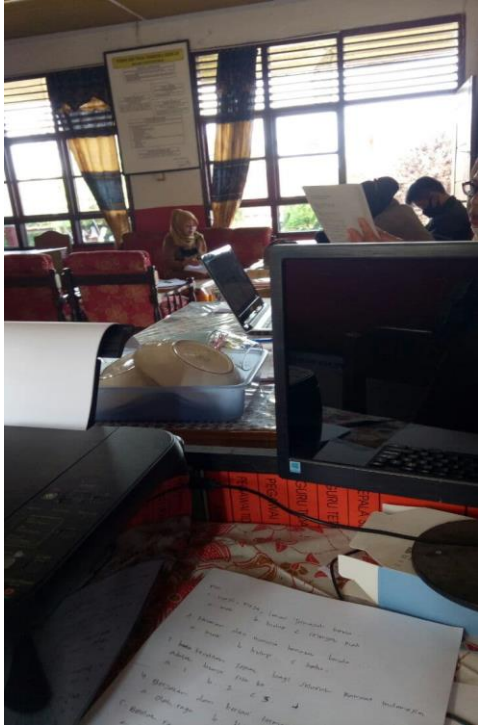
Dok. Kantor sekolah