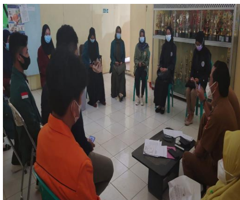
Dok. sosialisasi kepada kepala dinas terkait kampus mengajar