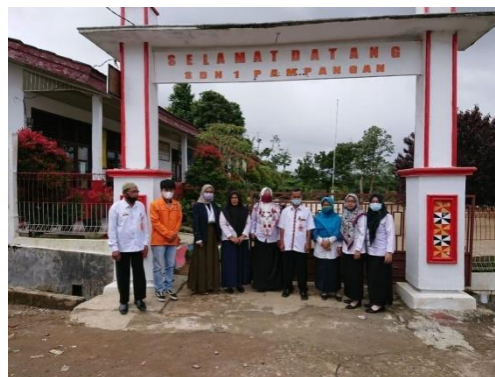
Dok. Penerjunan kesekolah sasaran