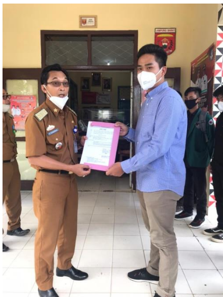
Dok. Pemberian surat tugas dari dinas pendidikan kabupaten lampung barat