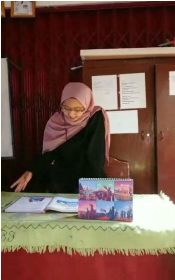
Dok. Kegiatan mengajar