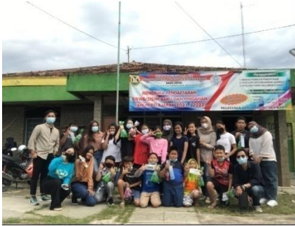
Foto bersama dengan para peserta didik SD Setia Budi