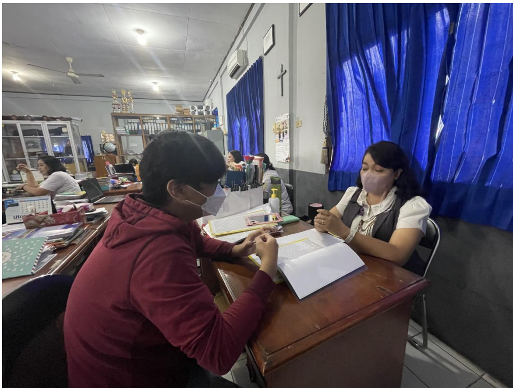
Lampiran 3. meminta izin dan berkonsultasi kepada pihak sekolah