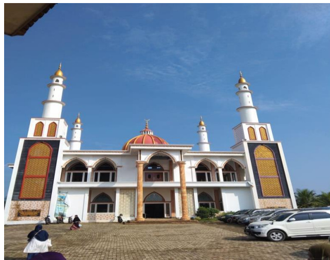
Foto masjid pada pondok pesantren Arafah