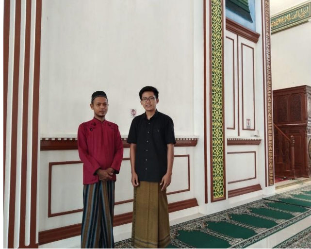
Foto setelah wawancara penelitian