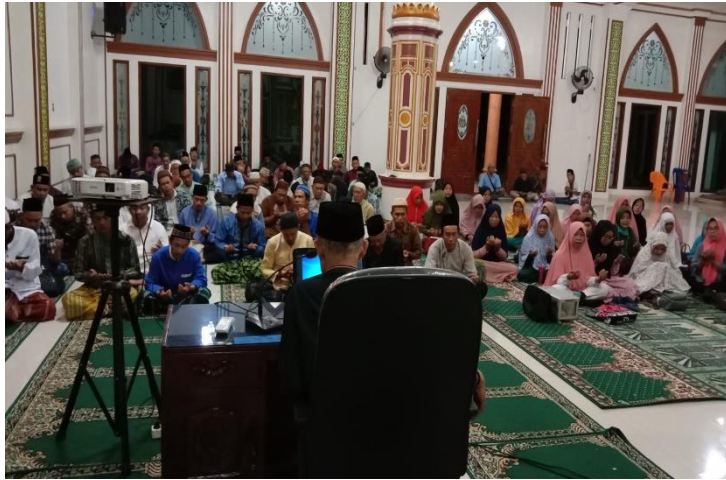
Foto saat kajian pada pondok pesantren Arafah