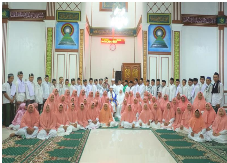
Foto setelah pelaksanaan Musyahadah setiap 4 bulan