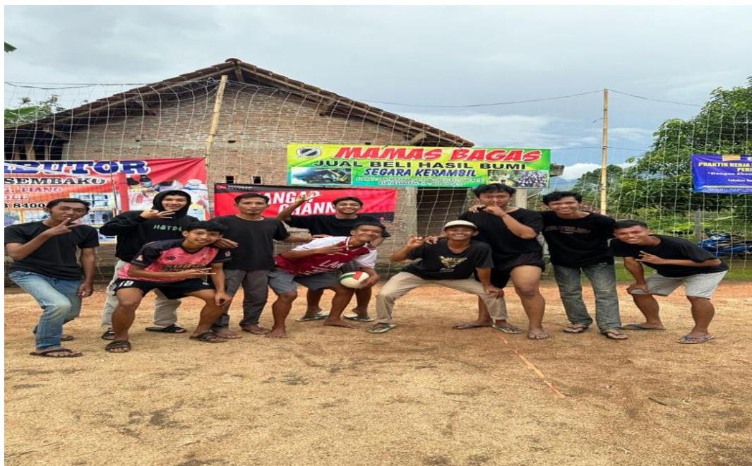
Gambar 2. 10 Foto bersama panitia lomba voli