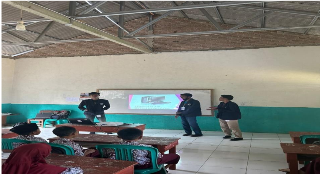
Gambar 2. 7 Proses belajar mengajar di SDN 23 Way Ratai

Upaya dalam membantu siswa/I SD Negeri 23 Way Ratai dan Madrasah Ibtidaiyah dalam meningkatkan semangat belajar serta memperluas pengetahuan mereka. Dalam kegiatan ini kami diminta untuk memberi materi tentang pengenalan komputer.