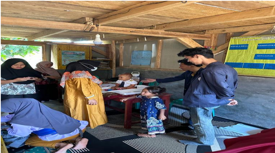
Gambar 2. 5 Membantu Kegiatan Posyandu

Membantu kegiatan sosialisasi dan posyandu guna membantu masyarakat akan pentingnya bahaya stunting dan posyandu juga bisa dimanfaatkan untuk memantau tumbuh kembang anak seperti mengukur berat badan dan tinggi badan untuk mendeteksi sejak dini jika terjadi hal-hal tidak diinginkan seperti kekurangan gizi.