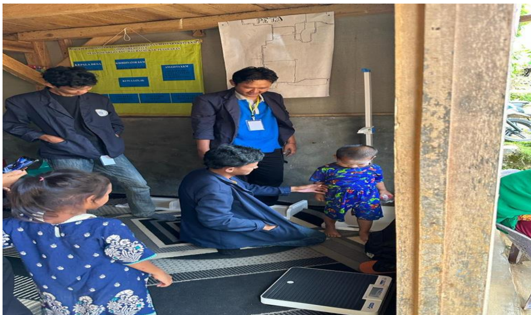
Gambar 2. 6 Membantu sosialisasi stunting