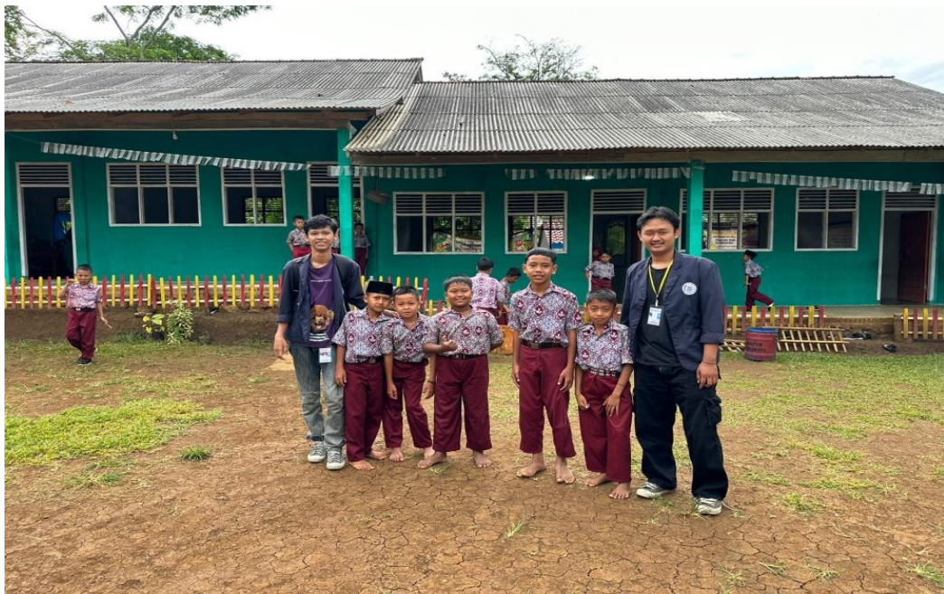
Gambar 2. 8 Foto bersama siswa/i Madrasah Ibtidaiyah An-Nida