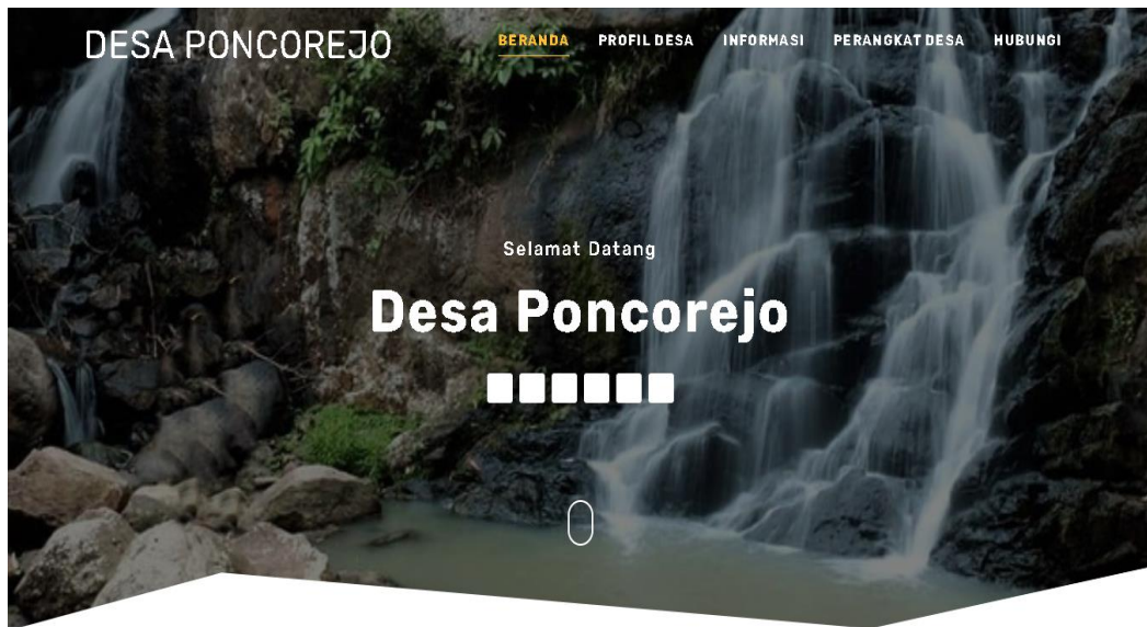
Gambar 2. 3 Hasil Website Desa Poncorejo