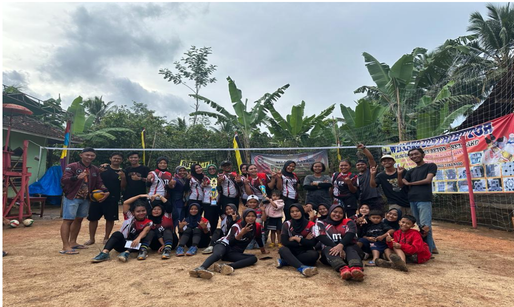
Gambar 2. 9 Foto Bersama Peserta Lomba Voli

Pada saat kegiatan lomba voli kami membantu masyarakat dusun meranti untuk membuat acara lomba voli berjalan dengan lancar hingga ikut memeriahkan lomba voli yang diadakan.