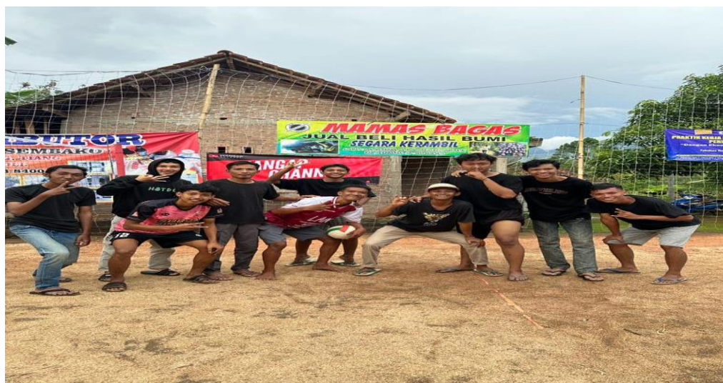
Gambar 2. 10 Foto bersama panitia lomba voli