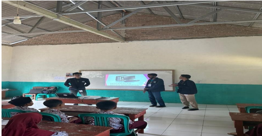
Gambar 2. 7 Proses belajar mengajar di SDN 23 Way Ratai

Upaya dalam membantu siswa/I SD Negeri 23 Way Ratai dan Madrasah Ibtidaiyah dalam meningkatkan semangat belajar serta memperluas pengetahuan mereka. Dalam kegiatan ini kami diminta untuk memberi materi tentang pengenalan komputer.