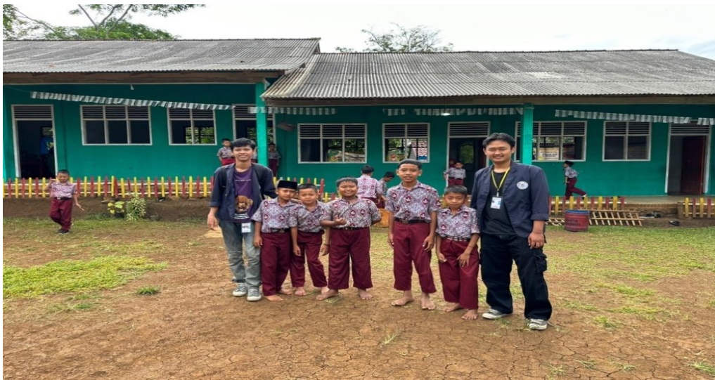
Gambar 2. 8 Foto bersama siswa/I Madrasah Ibtidaiyah An-Nida