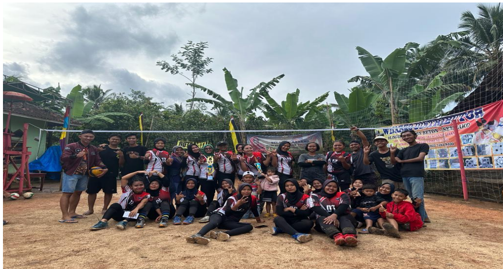
Gambar 2. 9 Foto Bersama Peserta Lomba Voli