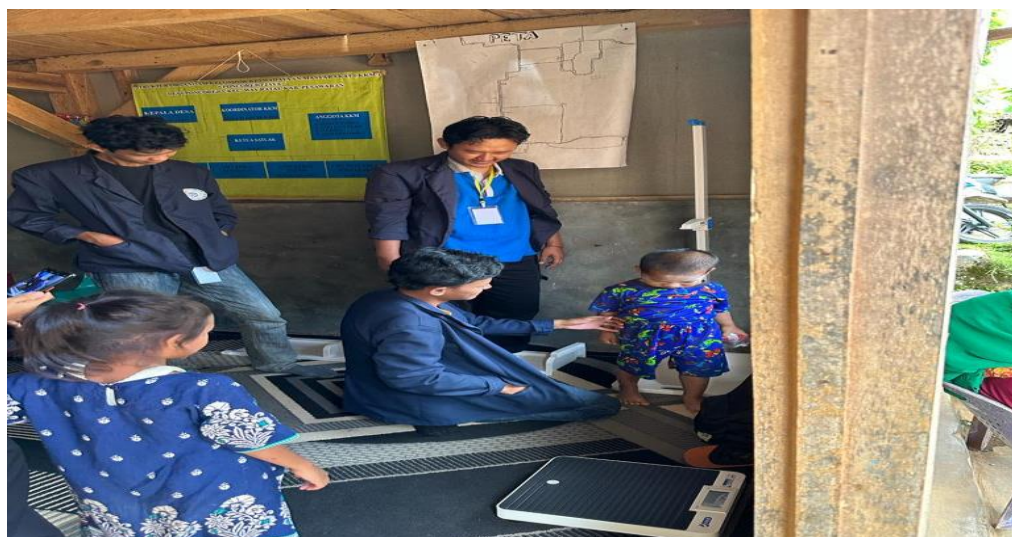
Gambar 2. 6 Membantu sosialisasi stunting