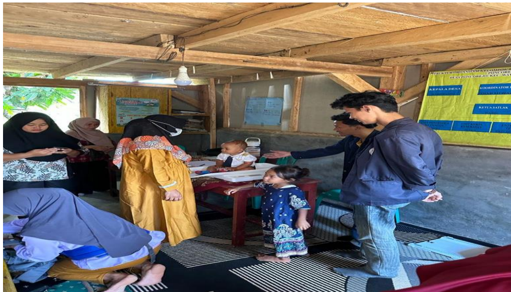
Gambar 2. 5 Membantu Kegiatan Posyandu

Membantu kegiatan sosialisasi dan posyandu guna membantu masyarakat akan pentingnya bahaya stunting dan posyandu juga bisa dimanfaatkan untuk memantau tumbuh kembang anak seperti mengukur berat badan dan tinggi badan untuk mendeteksi sejak dini jika terjadi hal-hal tidak diinginkan seperti kekurangan gizi.